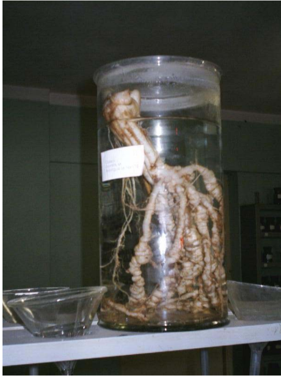
Fig. 3. Daños causados por Meloidogyne sp.