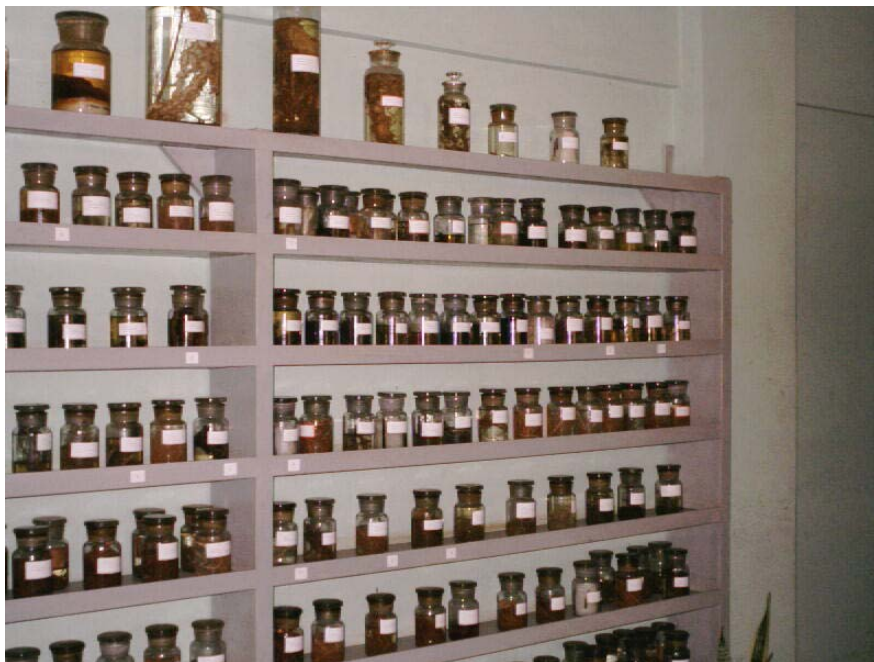
Fig. 2. Colección de muestras vivas conservadas en preparaciones fijas