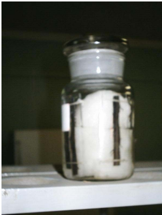
Fig. 4. Daños causados por Radopholus similis