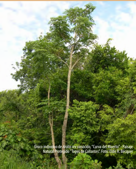
Único individuo de Aralia rex conocido, "Curva del Muerto" - Paisaje Natural Protegido "Topes de Collantes".

Para más información: silvicultura@ua.ffauna.co.cu