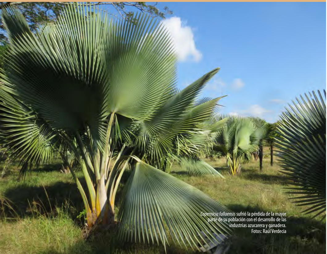
Copernicia fallaensis sufrió la pérdida de la mayor parte de su población con el desarrollo de las industrias azucarera y ganadera.

Para más información: verdecopernicia@gmail.com