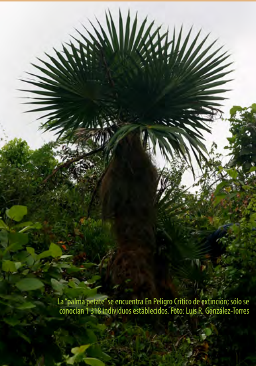
La “palma petate” se encuentra En Peligro Crítico de extinción; sólo se conocían 1 318 individuos establecidos.

Para más información: julio.ismael@rect.uh.cu