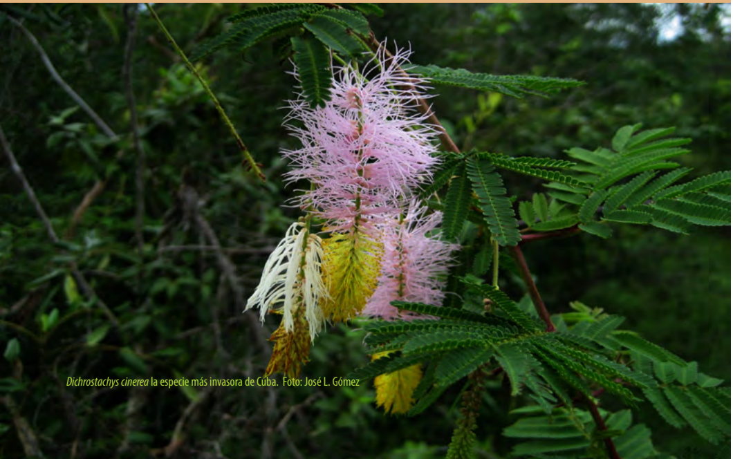
Dichrostachys cinerea la especie más invasora de Cuba.

Para más información: laura.castro@snap.cu