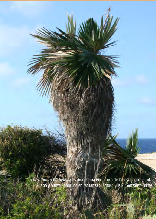
Coccothrinax borhidiana es una palma endémica de la costa entre punta Guano y punta Seboruco en Matanzas.

Para más información: lenia.robledo@umcc.cu