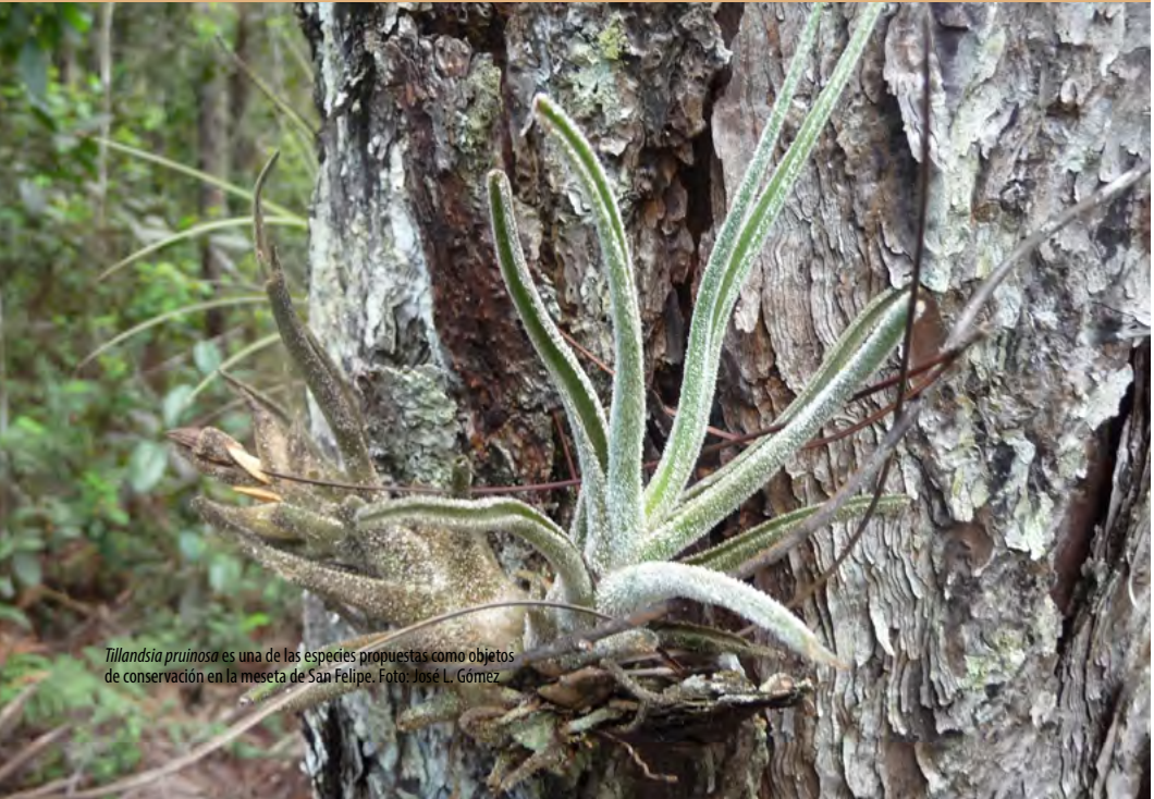
Tillandsia pruinosa es una de las especies propuestas como objetos de conservación en la meseta de San Felipe.