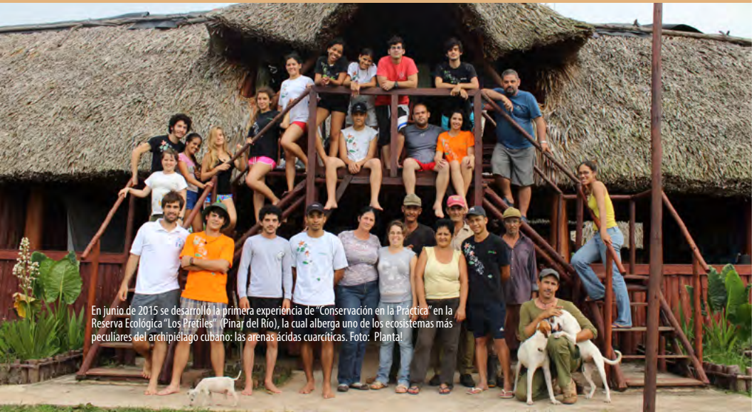
En junio de 2015 se desarrolló la primera experiencia de “Conservación en la Práctica” en la Reserva Ecológica “Los Pretiles” (Pinar del Río), la cual alberga uno de los ecosistemas más peculiares del archipiélago cubano: las arenas ácidas cuarcíticas.