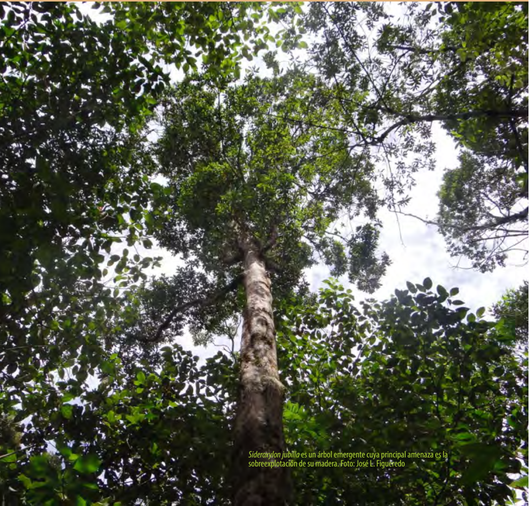
Sideroxylon jubilla es un árbol emergente cuya principal amenaza es la sobreexplotación de su madera.

Para más información: direccion@guisa.inaf.co.cu