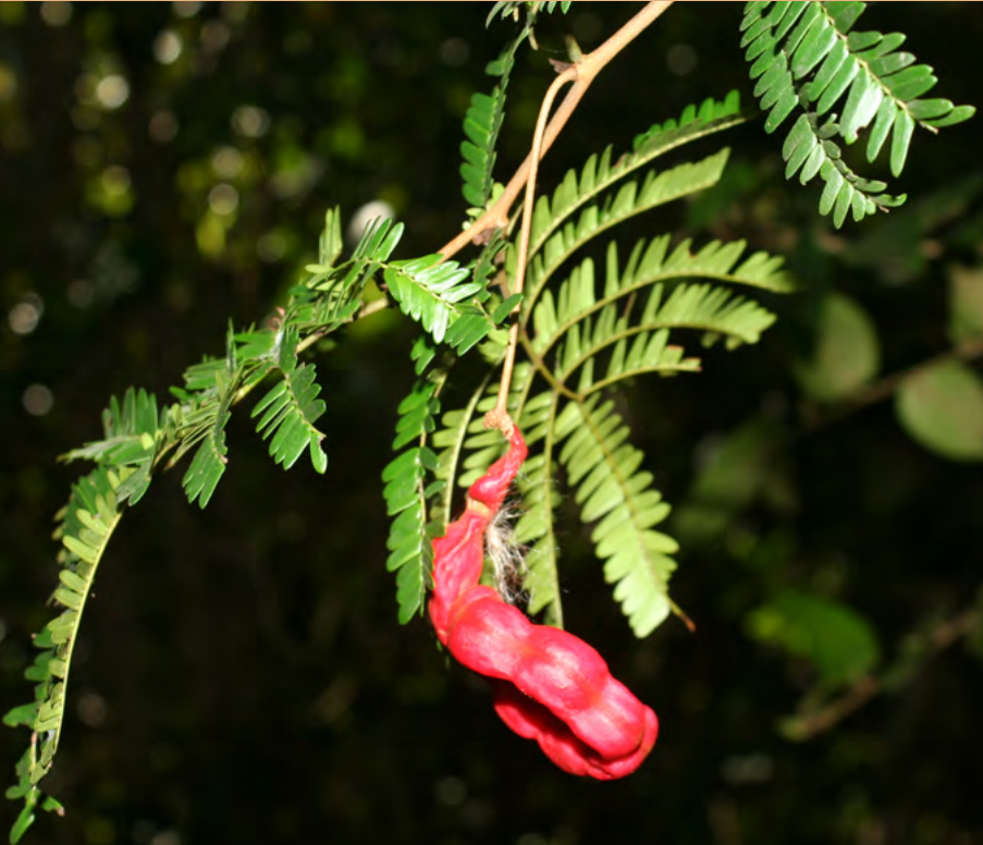
Abarema maestrensis es un árbol endémico de Cuba oriental categorizado como En Peligro Crítico.

Para más información: asosal@guisa.inaf.co.cu