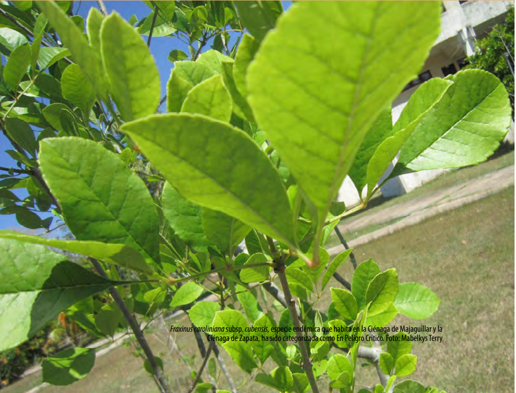
Fraxinus caroliniana subsp. cubensis , especie endémica que habita en la Ciénaga de Majaguillar y la Ciénaga de Zapata, ha sido categorizada como En Peligro Crítico.

Para más información: lenia.robledo@umcc.cu