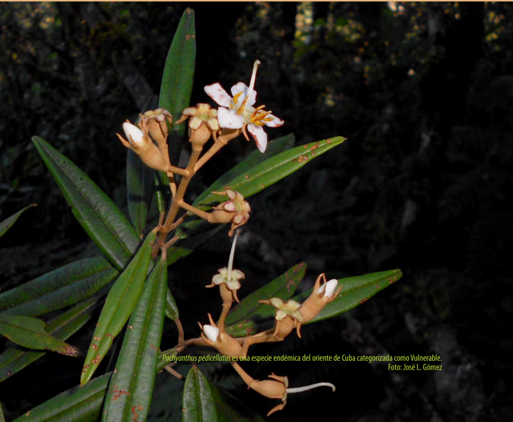
Pachyanthus pedicellatus es una especie endémica del oriente de Cuba categorizada como Vulnerable.

Para más información: yenia@guisa.inaf.co.cu