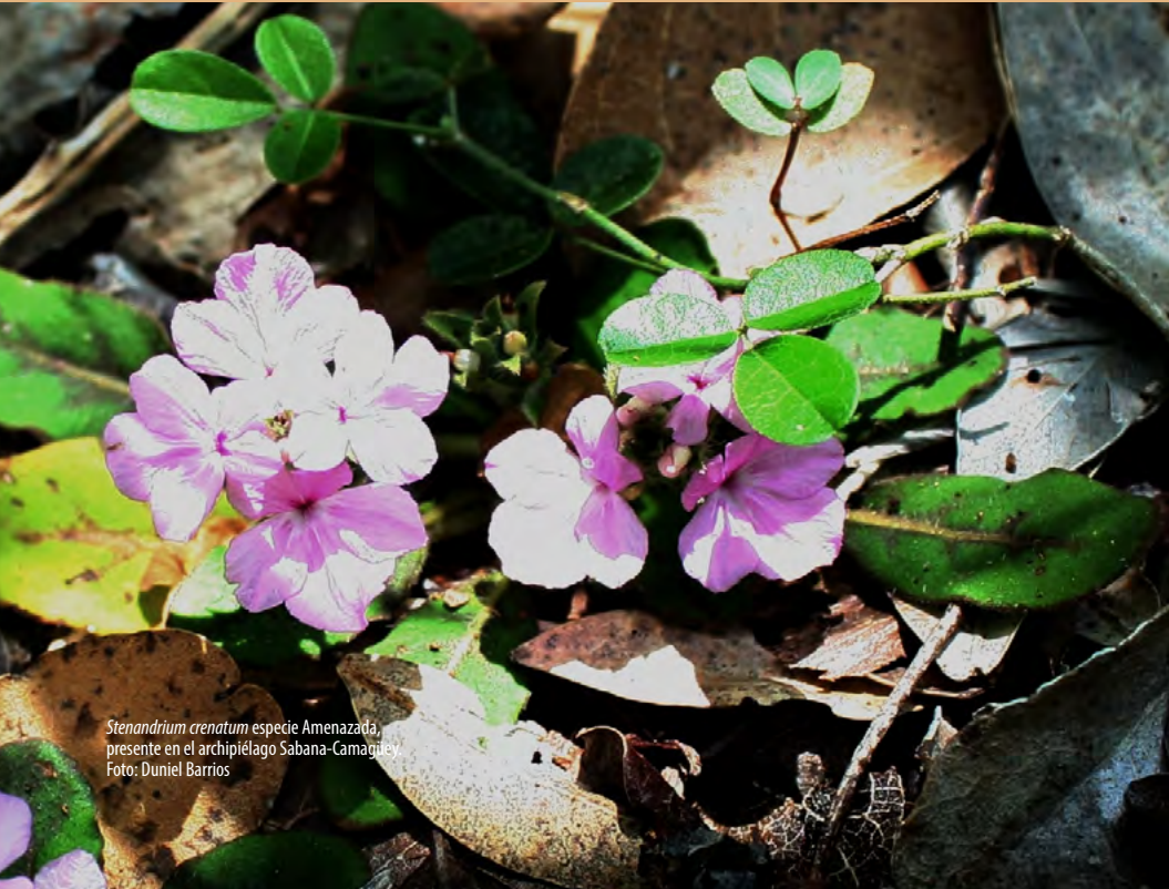
Stenandrium crenatum especie Amenazada, presente en el archipiélago Sabana-Camagüey

Para más información: marom79@cesam.vcl.cu