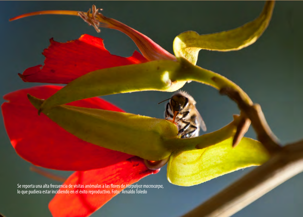
Se reporta una alta frecuencia de visitas anómalas a las flores de Harpalyce macrocarpa , lo que pudiera estar incidiendo en el éxito reproductivo.