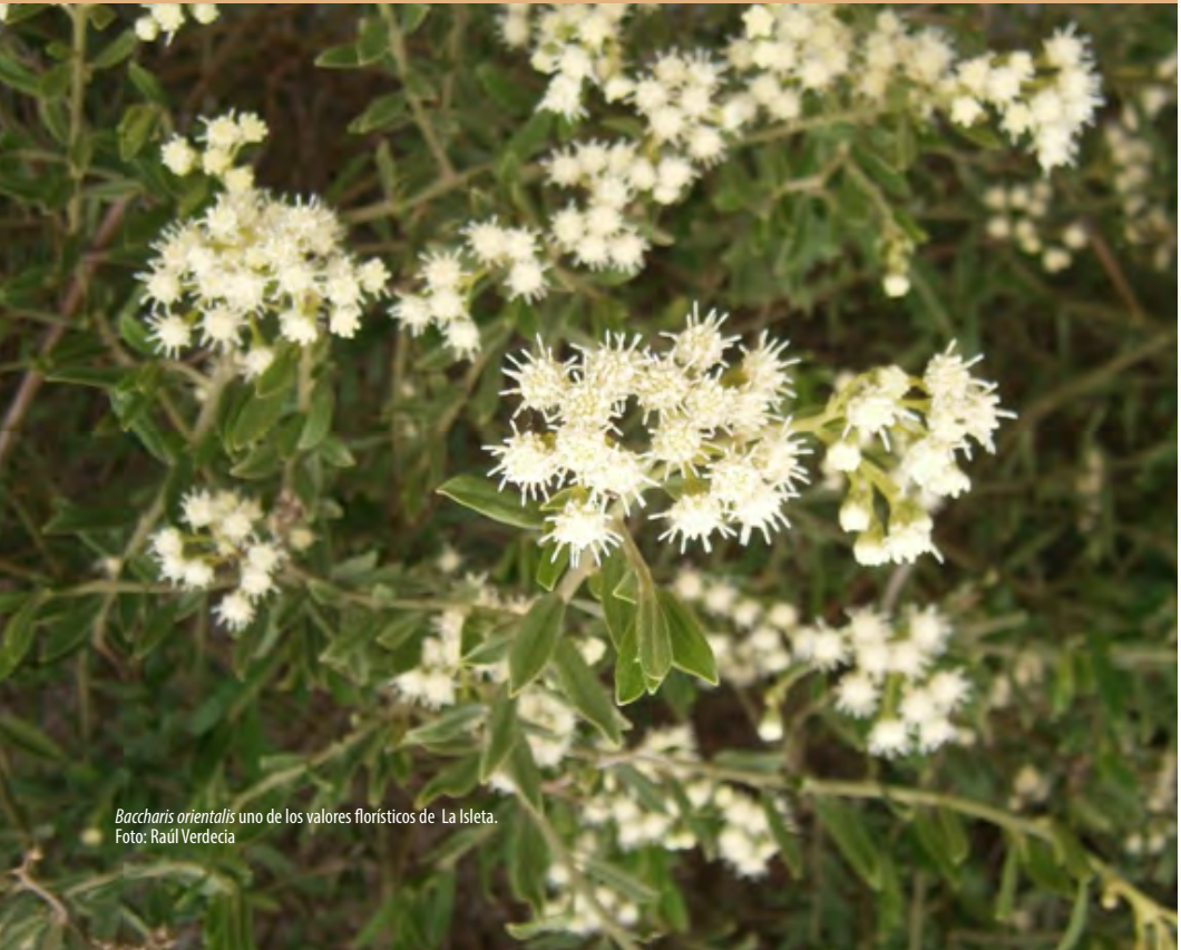
Baccharis orientalis uno de los valores florísticos de La Isleta.

Para más información: verdecopernicia@gmail.com