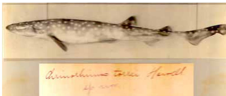
Figura 3. Foto del espécimen tipo de Scyliorhinus torrei tomada por Howell Rivero, autor de la descripción de la especie, con anotaciones de su puño y letra. La fotografía fue donada por la familia del Dr. Howell Rivero al Acuario Nacional de Cuba.

Referencia: Proc. Boston Soc. Nat. Hist. vol. 41: 43.