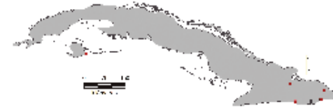
Área de ocupación donde se ha registrado Coelioxys tridentata

Este megaquíldo pertenece a la subfamilia Megachilinae, tribu Megachilini y se caracteriza por presentar un abdomen cónico y alargado, escopas ausentes y ojos pilosos.