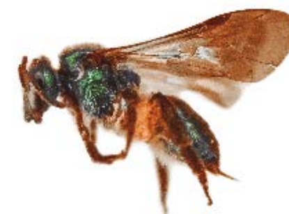
Lassioglossum engeli . © Daryl D. Cruz