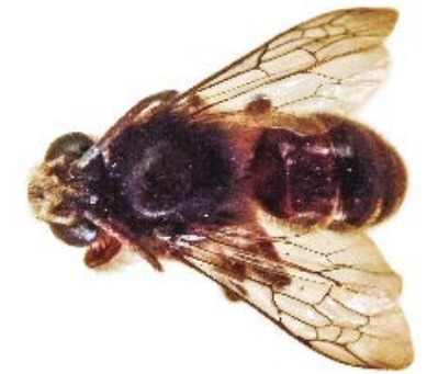
Colletes granpiedrensis . © Daryl D. Cruz