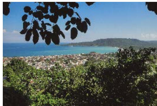
Baracoa, una de las localidades de Coelioxys tridentata . © José Espinosa