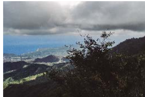
Gran Piedra, una de las localidades de Lassioglossum engeli .

Los datos aportados se basan en estudios de campo, observaciones informales de campo, literatura y datos de colecciones.