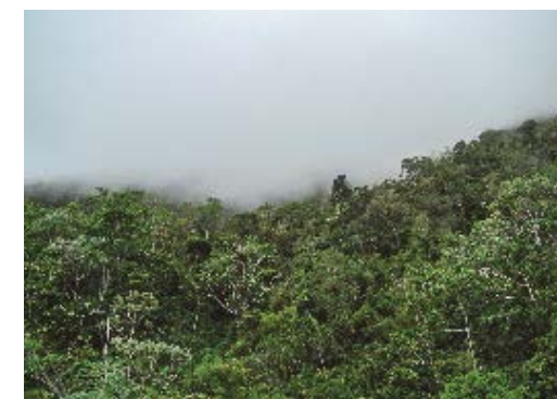
Pluvisilva montana de la Sierra Maestra, hábitat de Lassioglossum engeli .