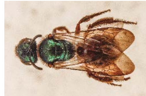
Lassioglossum sierramaestrensis .