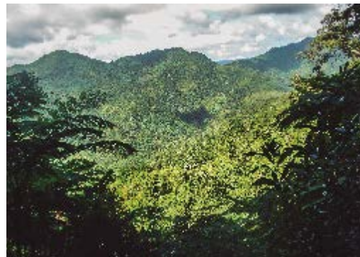
Área Protegida de Recursos Manejados Cuchillas del Toa.