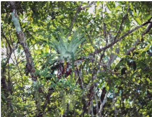
Bosque submontano, uno de los hábitats de Caupolicana nigrescense.