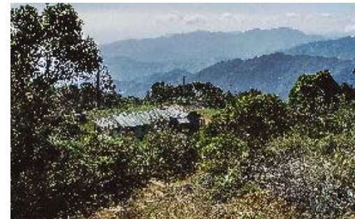
Pico Cuba, localidad de Lassioglossum sierramaestrensis . © Ariel Rodríguez Gómez