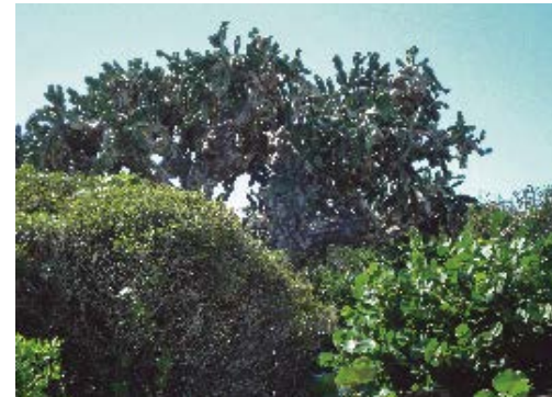
El Patriarca, Paisaje Natural Protegido Varahicacos, Matanzas.

Colletes hicaco pertenece a la subfamilia Colletinae, se caracteriza por presentar toda la pubescencia corporal clara, a diferencia de las dos especies cubanas del género, que la tienen muy oscura, excepto los pelos del