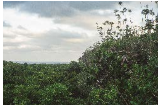
Maisí, localidad de Coelioxys tridentata .