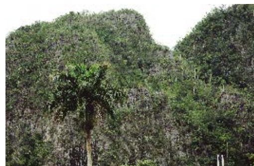
Vegetación de mogotes, hábitat de Lassioglossum adriani .