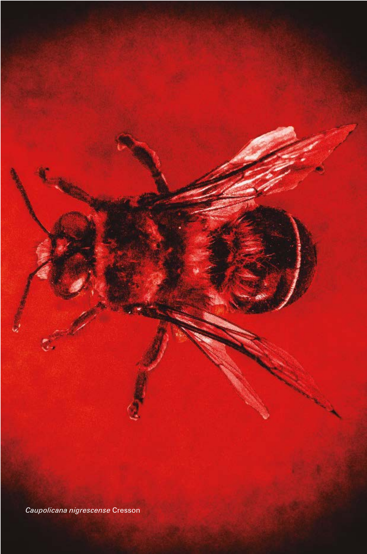
Caupolicana nigrescense Cresson