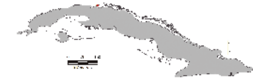
Área de ocupación donde se ha registrado Colletes hicaco

escutelo, castaño claro. La banda apical de pelos blancos sobre los tergomas metasomales (fascia) es entera. El nombre de la especie es referido a la localidad tipo: Península de Varahicacos.