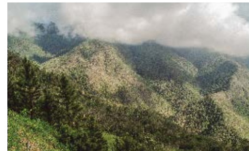
Sierra Maestra, Santiago de Cuba, hábitat de Lassioglossum sierramaestrensis .