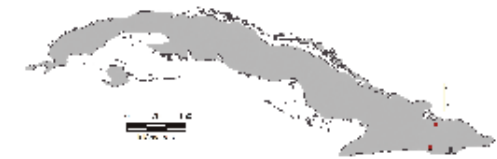
Área de ocupación donde se ha registrado Colletes granpiedrensis

pilosidad castaño sobre la cabeza y mesosoma, pelos blancos en la frente. Bandas de pelos blancos, apicales, laterales, sobre los tergomas metasomales, que no llegan a unirse. Clípeo, frente y mesosoma con puntuaciones grandes, vértex y metasoma con puntuación menor. Espacio malar mucho más ancho que largo. El nombre de la especie es referido a la localidad tipo: La Gran Piedra. Esta especie fue colectada por última vez en 1987.