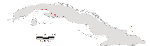
Área de ocupación donde se ha registrado Coelioxys sannicolarensis

Este megaquilido pertenece a la subfamilia Megachilinae, tribu Megachilini y se distingue por presentar un tegumento corporal negro; antenas y tégulas castaño, patas y esternos (en algunos ejemplares) castaño rojizo, alas castaño con ápices oscuros. Además presenta pubescencia del cuerpo blanca y puntuaciones grandes, unidas en vértex, gena, escudo, escutelo y mesepisterno, menores en clípeo, frente, área ocelar y metasoma. Surcos gradulares en tergos metasomales II y III bien definidos; foseas (fóvea) sobre tergo II del macho poco alargadas y profundas.