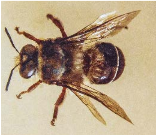
Caupolicana nigrescense.