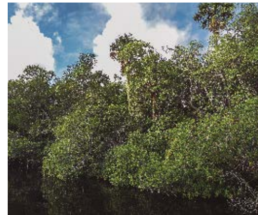
Bosque de ciénaga. Península de Zapata.