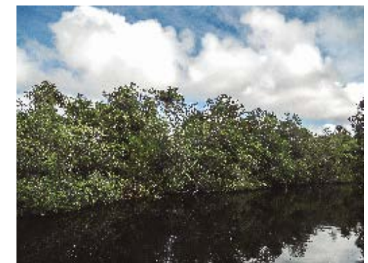
Bosque de Ciénaga, Península de Zapata, hábitat de Hylaeus limbifrons .

Hylaeus limbifrons es una especie endémica cuya distribución se restringe a la región occidental de la isla. Se ha reportado para Matanzas (Ciénaga de Zapata, Matanzas), Cienfuegos (Municipio Abreus), Pinar del Río