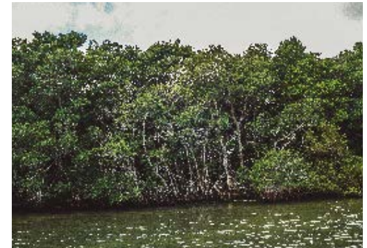
Bosque de mangle, hábitat de Coelioxys sannicolarensis.

Coelioxys sannicolarensis es una especie endémica, con distribución restringida a