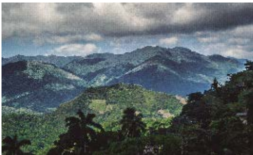
Área Protegida de Recursos Manejados Cuchillas del Toa.