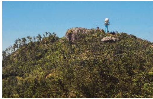
Gran Piedra, localidad tipo de Colletes granpiedrensis .

pilosidad castaño sobre la cabeza y mesosoma, pelos blancos en la frente. Bandas de pelos blancos, apicales, laterales, sobre los tergomas metasomales, que no llegan a unirse. Clípeo, frente y mesosoma con puntuaciones grandes, vértex y metasoma con puntuación menor. Espacio malar mucho más ancho que largo. El nombre de la especie es referido a la localidad tipo: La Gran Piedra. Esta especie fue colectada por última vez en 1987.