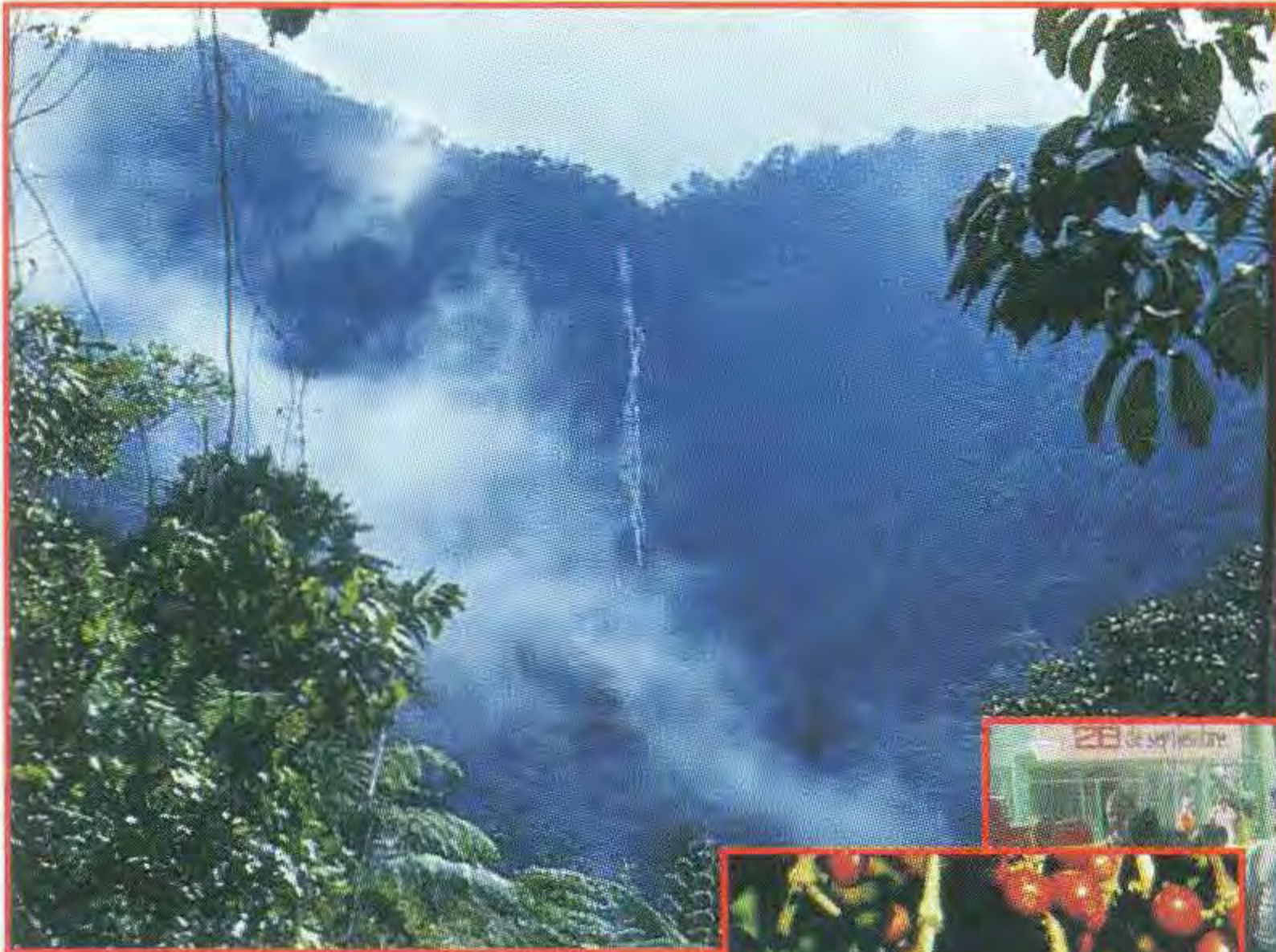
Paisaje natural RB Cuchillas del Toa.