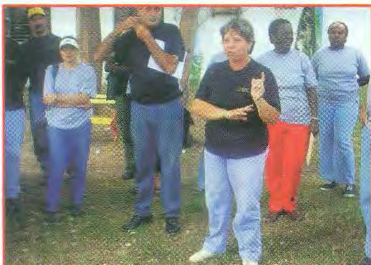
Encuentro entre especialistas de la biodiversidad agrícola y natural.