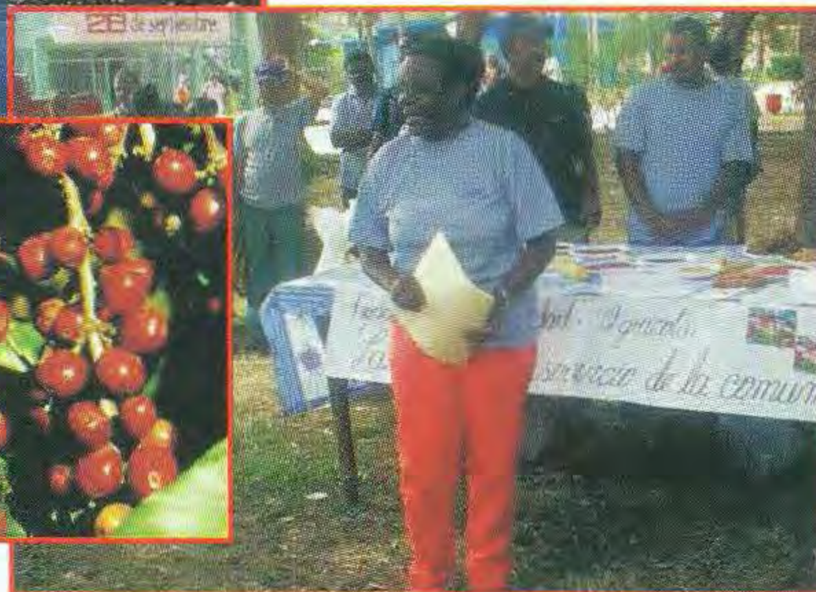
Encuentro entre campesinos de oriente y occidente en la feria de biodiversidad agrícola de Guantánamo.