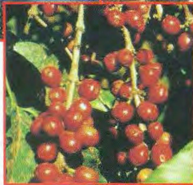
Cultivo del cafeto en las montañas de Yateras.