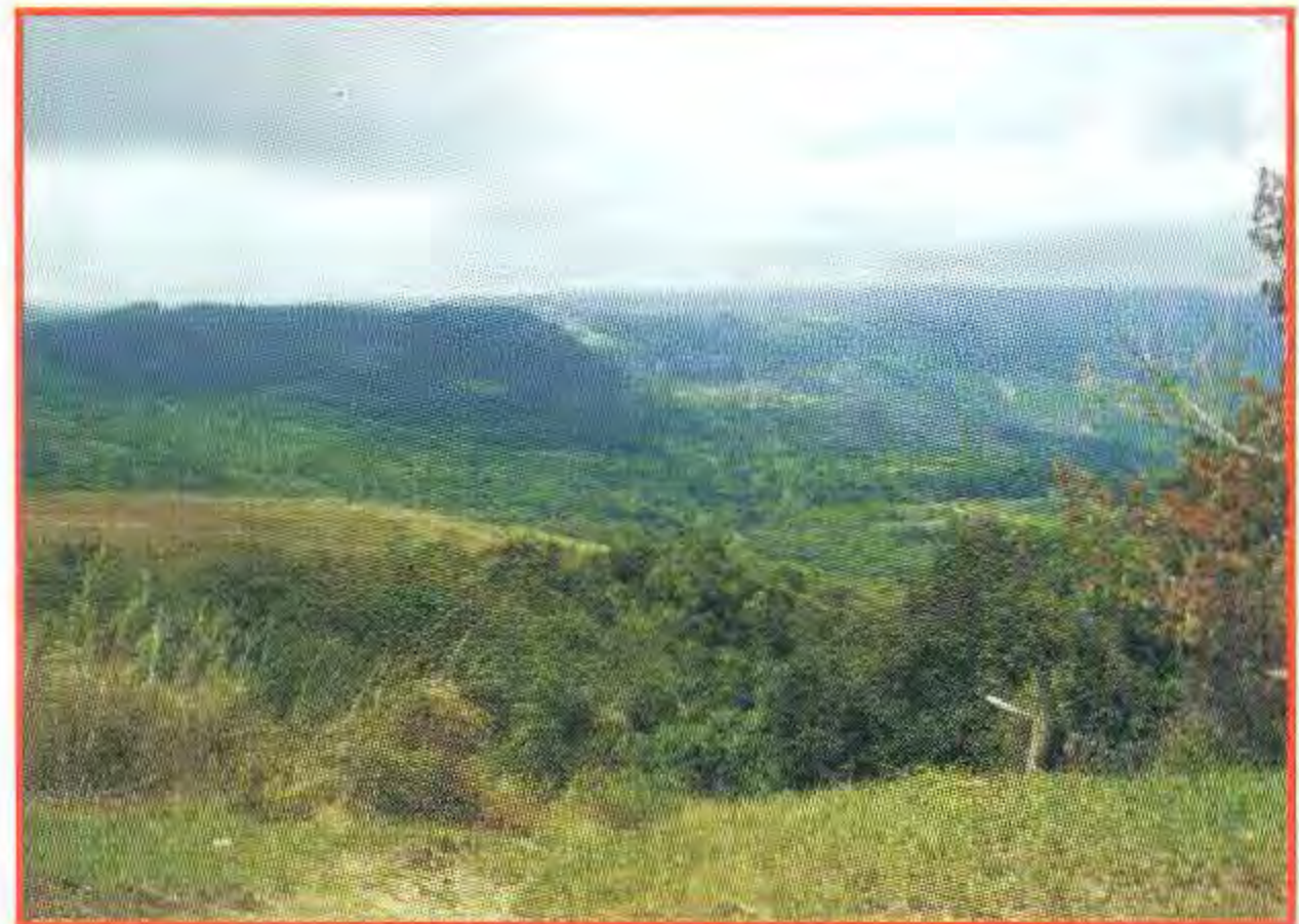
Presencia de neblinas en la RB Cuchillas del Toa.