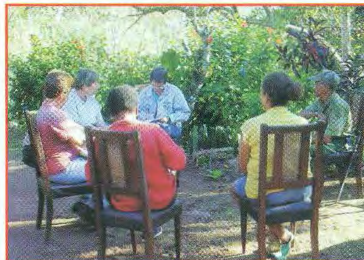
Visita de un grupo de investigadores a un huerto casero en Pinar del Río.