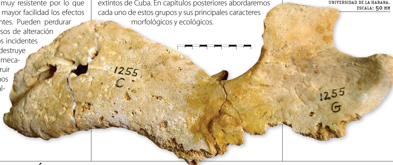
FIGURA 2. Rama mandibular izquierda, vista labial, del dugóngido del Mioceno de Cuba, Metaxytherium riveroi (= Metaxytherium crataegense ). PIEZA 1255, MUSEO ANTROPOLÓGICO MONTAÑÉ, UNIVERSIDAD DE LA HABANA. ESCALA: 50 MM