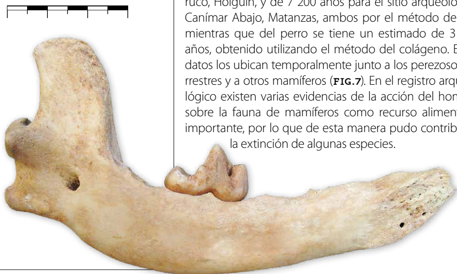
FIGURA 7. Rama mandibular de perro mudo ( Canis lupus familiaris ) en vista lingual encontrada en un sitio arqueológico. Loc. Cueva de los Perros, Matanzas. PIEZA 1045, COLECCIÓN OSCAR ARREDONDO. ESCALA: 30 MM

te ocurrió entre 12 000 y 10 000 años atrás. El fechado en hueso humano más antiguo es de 6 000 años en Seboruco, Holguín, y de 7 200 años para el sitio arqueológico Canimar Abajo, Matanzas, ambos por el método del C^{14} , mientras que del perro se tiene un estimado de 3 805 años, obtenido utilizando el método del colágeno. Estos datos los ubican temporalmente junto a los perezosos terrestres y a otros mamíferos (FIG. 7). En el registro arqueológico existen varias evidencias de la acción del hombre sobre la fauna de mamíferos como recurso alimentario importante, por lo que de esta manera pudo contribuir a la extinción de algunas especies.