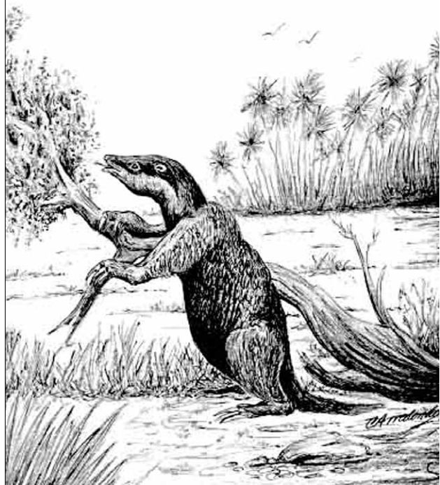
FIGURA 9. Posible aspecto externo de un ejemplar de Parocnus browni en un paisaje natural. ILUSTRACIÓN DE CARLOS ARREDONDO.