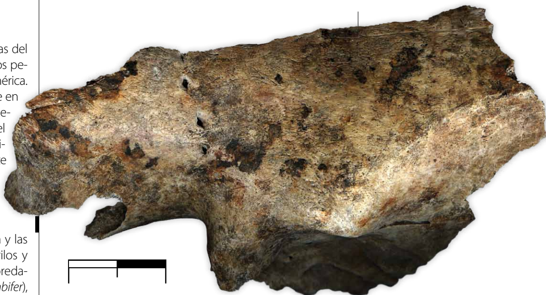
FIGURA 4. Porción rostral de un perezoso joven ( Megalocnus rodens ) con evidentes huellas de dientes de cocodrilo. Loc. Solapa del Megalocnus , Corralillo. Villa Clara. PIEZA S/N. ARQUEOCENTRO SAGUA LA GRANDE. ESCALA: 10 MM

En Cuba se conocen diversas especies de aves rapaces que depredan sobre poblaciones de vertebrados e invertebrados. En el pasado existieron rapaces con proporciones corporales y hábitos similares a las actuales. Sin embargo, en muchas de estas aves se desarrolló el gigantismo probablemente asociado a la ausencia de mamíferos carnívoros y a la extraordinaria abundancia de alimento que representaban los mamíferos y otros vertebrados.