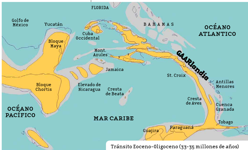
Tránsito Eoceno-Oligoceno (33-35 millones de años)

Si bien el período geológico en que estuvo emergida la Cresta de Aves fue corto –geológicamente hablando–, uno o dos millones de años son más que suficientes para los procesos migratorios de los mamíferos ancestrales. Probablemente, los grupos de mamíferos que utilizaron esta vía habitaban la zona de contacto. Aunque probablemente se sucedieron varias oleadas migratorias, no debió pasar toda la fauna existente. Por el momento, es prácticamente desconocida la fauna que habitaba hace 35-33 millones de años en el micro continente noroccidental de Suramérica.