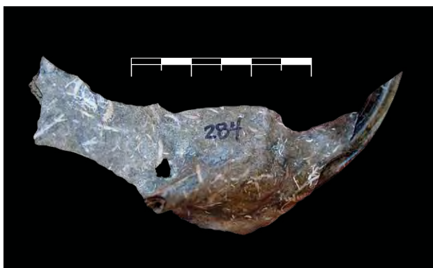
FIGURA 17. Hemimandíbula de Macrocapromys acevedo en vista lateral labial. Localidad Hueco Chico, Corralillo, Villa Clara. PIEZA 284, COLECCIÓN ARQUEOCENTRO SAGUA LA GRANDE. ESCALA: 30 MM

cie respecto de M. latus , con cierto nivel de entrenamiento se puede detallar que el neurocráneo de M. acevedo , en vista superior, es más estrecho, y los huesos nasales y las bulas auditivas son más estrechas. La mandíbula, en sentido general, es menos robusta (FIG. 17).