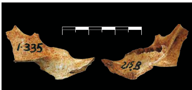
FIGURA 18. Vistas labial y lingual del holotipo de Mesocapromys kraglievichi . Localidad Cueva de Paredones, Ceiba del Agua, La Habana. PIEZA CZACC 1.335, COLECCIÓN IES. ESCALA: 30 MM

El material osteológico que ha permitido su caracterización está basado en hemimandíbulas. La identificación de las mandíbulas de M. kraglievichi es muy difícil, sobre todo cuando existen otras cuatro especies recientes con una morfología similar. Como carácter distintivo de la mandíbula, en vista superior, el cóndilo articular se observa por dentro del borde externo de la cresta masetérica y el cuerpo mandibular, anterior al proceso coronoides, es largo y bajo (FIG. 20).