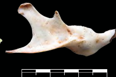
FIGURA 20. Rama mandibular de Mesocapromys kraglievichi en vista labial. Localidad Cueva Lamas, Santa Fe, Ciudad de la Habana. PIEZA S/N, COLECCIÓN OSCAR ARREDONDO. ESCALA: 30 MM

Los roedores han evolucionado durante varios millones de años en tierras antillanas y han sido un grupo relativamente exitoso. Su registro fósil distribuido en todo el territorio nacional y la abundancia extraordinaria de restos óseos en numerosas localidades, pueden sugerir el éxito ecológico de estos roedores. Tal y como ocurre en la actualidad, los caprómidos explotaron ampliamente diversos ecosistemas. Los diferentes eventos climáticos y geológicos que han provocado ascensos y descensos del nivel del mar en los últimos miles de años, con la consiguiente disminución de tierras emergidas y extensión de éstas, probablemente llevaron a la extinción algunas especies; no obstante, otras lograron sobrevivir hasta nuestros días. Probablemente, las diferencias de tamaño, la explotación de diferentes hábitats y recursos, así como la disponibilidad, abundancia y variedad de alimentos, fueron elementos que permitieron minimizar la competencia entre las diferentes especies y facilitar la coexistencia.