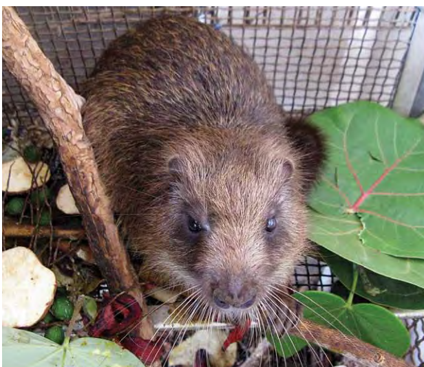
FIGURA 20. Jutía carabalí en cautiverio. Instituto de Ecología y Sistemática.

El perro jíbaro también causa daños por depredación cuando la jutía carabalí necesita desplazarse por el suelo. La rata negra, abundante en las áreas naturales, utiliza también las bejuqueras y los huecos en los árboles como refugio, y puede ser motivo de perturbaciones y transmisión de enfermedades y parásitos. Por los años 1980, en los alrededores de San Diego de los Baños, Pinar del Río, se observó alta mortalidad de jutías carabalí por una epidemia que desafortunadamente no fue estudiada y según la opinión de viejos guardabosques, ocurre periódicamente.