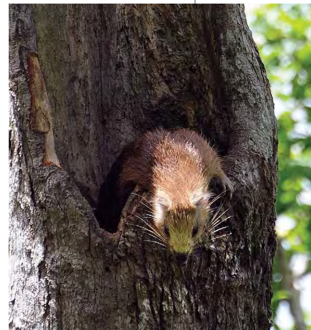
FIGURA 17. Jutía carabalí en el hueco de un árbol. Reserva de la Biosfera Sierra del Rosario.

En poblaciones con altas densidades y mayor competencia por los recursos, sí bajan de los árboles para buscar alimento. Es una especie con alta dependencia de las bejuqueras, las enredaderas y las oquedades en los troncos de los árboles en pie, donde hacen sus refugios, crían y