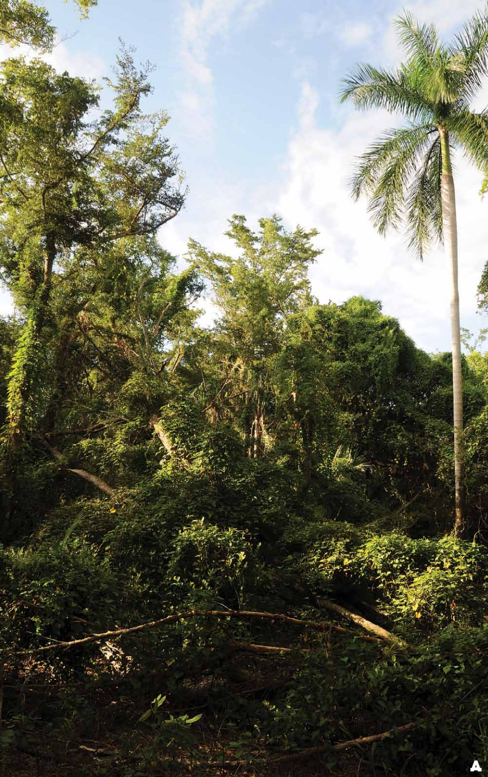
FIGURA 18. Árboles cubiertos con bejuqueras, hábitat característico de la jutía carabalí. A. Finca San Agustín, Ciego de Ávila. B. Sierra del Rosario.

En la naturaleza se alimentan de más de 30 especies de plantas, especialmente árboles frutales como mango, guayaba, naranja, zapote, etc., –de sus hojas tiernas y de la corteza, siempre presentes, y de flores y frutos, estacionalmente–. Por lo general, sostienen las hojas con las manos y cortan trozos circularmente. Además de árboles frutales se alimentan de júcaro, jagüey, macurije, jobo, almácigo, cupey, ocuje, cedro y varias especies de palmas, pinos y bejuocos. Esta especie es muy difícil de criar en cautiverio, muchas veces dejan de comer y mueren, y tiene un comportamiento más agresivo. Cuando logran adaptarse, pueden comer hojas y frutos de las plantas de las que se alimentan en vida libre, además de bejuco de boniato, maní, coco, pan, etc. (FIGS.19 Y 20).