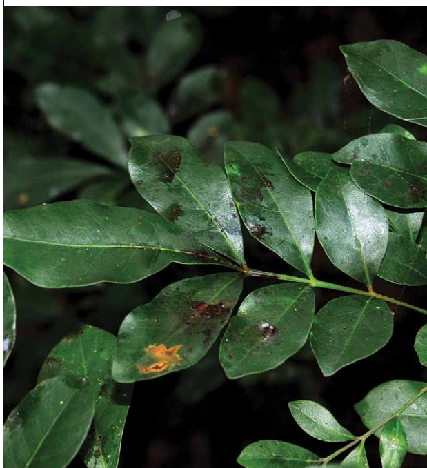
FIGURA 15. Rastros de orina sobre hojas de arbustos dejados por jutías carabalíes en la finca San Agustín, Ciego de Ávila.

Esta es la especie con hábitos más arborícolas de toda la familia. Desarrollan todas sus actividades en el dosel del bosque y raramente se observan a nivel del suelo, aunque ocasionalmente pueden utilizar como refugios las cuevas y oquedades de los farallones. Es común que dejen rastros de orina –de color oscuro rojizo– en las hierbas y