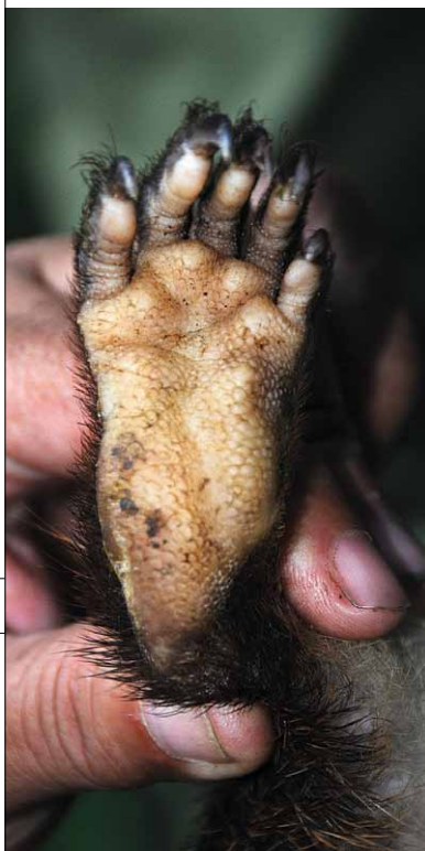
FIGURA 13. Planta de la pata posterior de jutía carabalí.