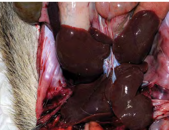
FIGURA 14. Hígado con la superficie lisa de jutía carabalí ( Mysateles prehensilis ).