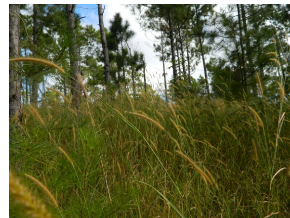
Hierba elefante invadiendo un pinar degradado en la Meseta de Cajalbana, Pinar del Río.

Ecosistemas que invade en Cuba: Principalmente sabanas, herbazales de las orillas de ríos, arroyos, bordes de diferentes tipos de bosques, carreteras, guardarrayas y campos en barbecho.