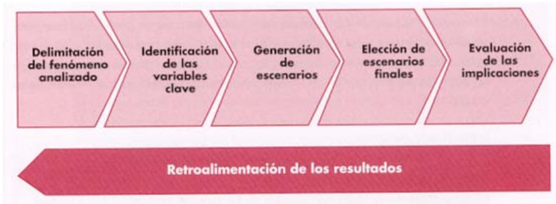
Figura 2: Diagrama de formulación del plan estratégico

Fuente: “Herramientas para la ordenación del territorio”. Curso de postgrado impartido en la maestría de Geografía, Medio Ambiente y Ordenamiento Territorial.