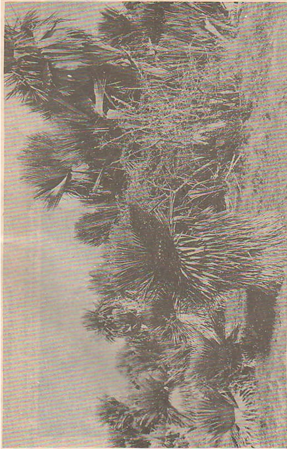
Figura 3 Porción del palmar de los Ga eguitos se distinguen a frente Copernicia macroglossa y a fondo Copernicia rigida Lugar Coto de Caza