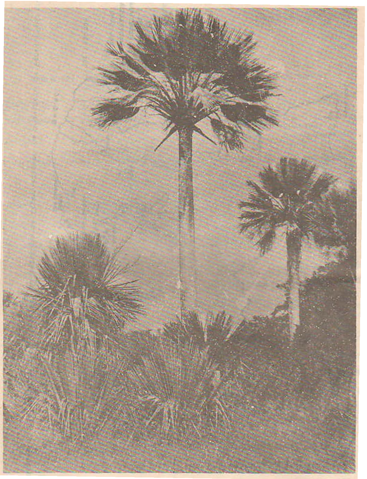
Figura 2. Plantas adultas de Copernicia X textilis , y plantas jóvenes (a la izquierda) de C. rigida . A la derecha el manglar.