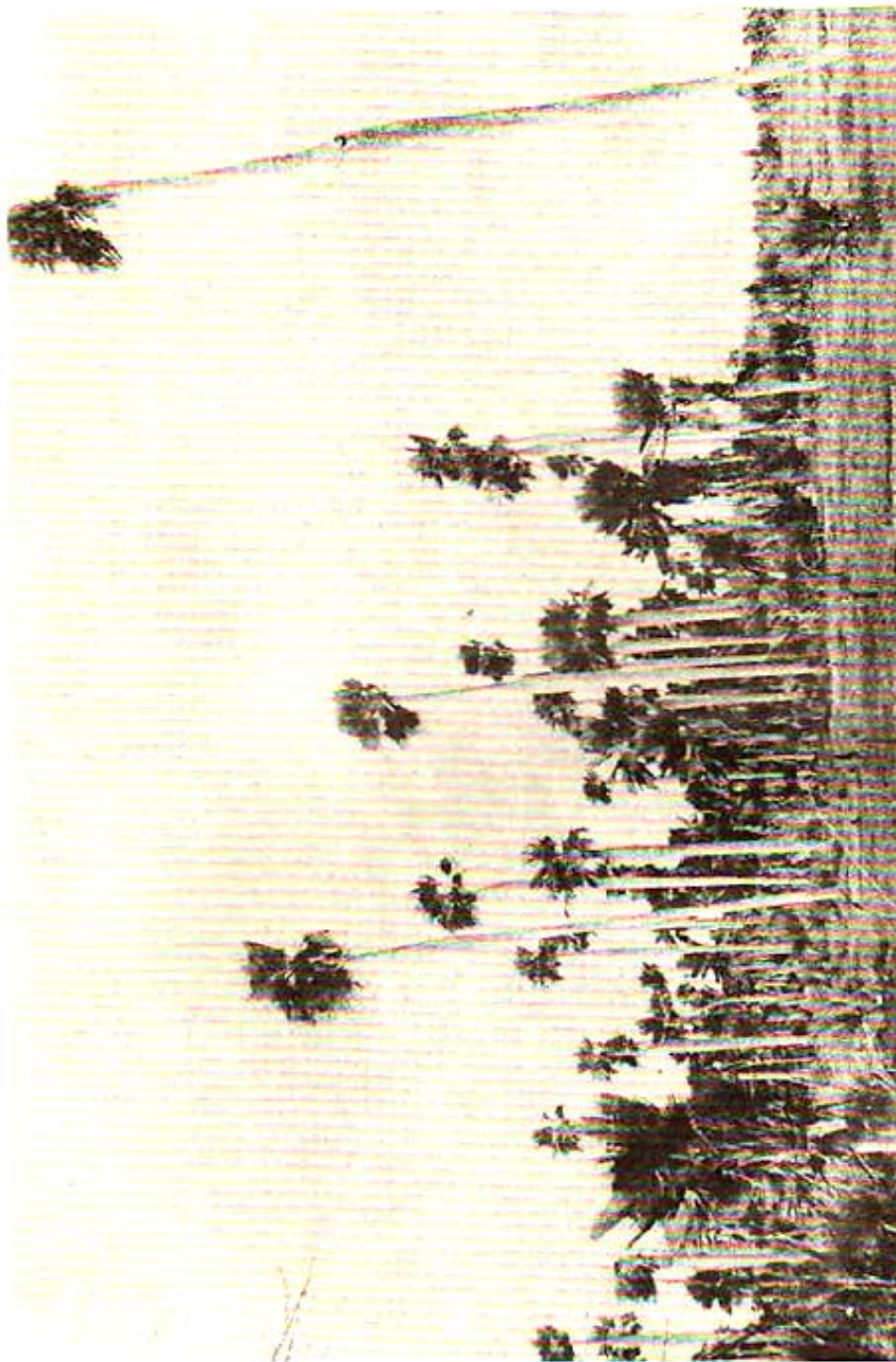
Figura 4. Palmeras de Lopernicia X textilis donde se destaca las deformaciones del cogollo, producidos posiblemente por aplicaciones de herbicidas hormonales.