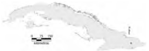
Área de ocupación donde se ha registrado Anolis macilentus .

Tiene distribución local en un hábitat continuo cuya área de ocupación es menor de 4 km 2 y el tamaño de la población no se conoce.