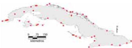
Área de ocupación donde se ha registrado Cyclura nubila nubila .

Tiene distribución nacional con hábitats fragmentados, su área de ocupación actual es de 180 km 2 y ha disminuido 20 % en los últimos 50 años; el tamaño de la población no se conoce.