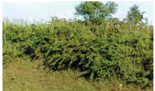
Vegetación secundaria con marabú. © HIRAM GONZÁLEZ ALONSO