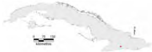
Área de ocupación donde se ha registrado Anolis oporinus .

Tiene distribución local en un hábitat continuo cuya área de ocupación es de 4 km 2 y el tamaño de la población no se conoce.