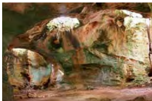
Cueva de Ambrosio.