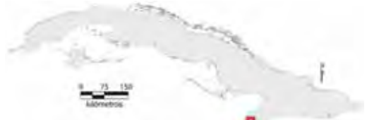
Área de ocupación donde se ha registrado Anolis guafe .

Tiene distribución regional en un hábitat continuo cuya área de ocupación es menor de 20 km 2 y el tamaño de la población no se conoce.