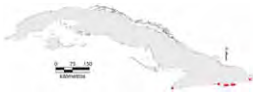
Área de ocupación donde se ha registrado Tarentola crombiei .

Tiene distribución regional con hábitat fragmentado cuya área de ocupación es de 28 km 2 y el tamaño de la población no se conoce.