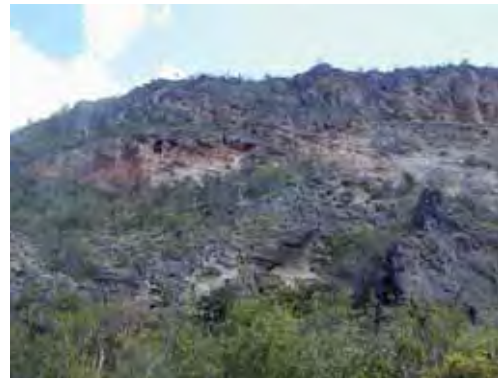
Matorral espinoso semidesértico.