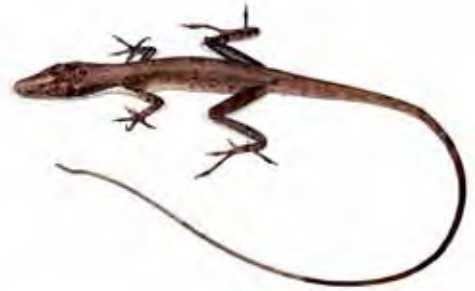
Anolis macilentus .

Especie endémica del río Pai, Monte Líbano, provincia de Guantánamo (Garrido y Hedges, 1992). Se le ha hallado solo en el bosque de galería a 650 m snm. Habita entre los tallos y ramas de las hierbas y arbustos, entre 0,5 y 2 m de altura sobre el suelo. Se le encuentra más activa a media mañana (Garrido y Hedges, 1992).