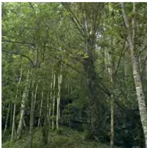
Bosque siempreverde.

en el bosque siempreverde mesófilo submontano así como también en plantaciones de pinos y café y en bosques de galería, desde 25 hasta 800 m snm (Rodríguez Schettino, 1999a). Se le encuentra entre las yerbas o en el suelo, donde permanece inmóvil encima de las hojas hasta una altura sobre el suelo de 1,5 m (Garrido y Schwartz, 1972). La media de la altura de la posta sobre el suelo es de 0,41 m y el diámetro promedio, de 0,2 cm (Henderson y Powell, 2009). Es una especie diurna que prefiere los sitios sombreados, para escapar salta varias veces hasta ocultarse en la vegetación (Rodríguez Schettino, 1999a). La reproducción en la naturaleza no se conoce, pero en cautiverio Garrido (1980) observó que la cópula duró 14,3 minutos como promedio y la más larga, 35 minutos; dos huevos puestos midieron 8,2 x 5,0 y 8,2 x 4,3 mm. La alimentación en vida libre es desconocida, pero en cautiverio ha aceptado insectos pequeños (Rodríguez Schettino, 1999a). En la Sierra de Trinidad fueron encontradas numerosas colonias aisladas las cuales permanecen en el mismo lugar todo el tiempo (Rodríguez Schettino, 1999a).