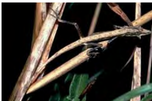
Anolis vanidicus . © KEVIN DE QUEIROZ

Especie endémica de las Montañas de Guamuha, en las provincias de Cienfuegos y Sancti Spiritus (Garrido y Schwartz, 1972; Rodríguez Schettino, 1999a). Habita en el bosque pluvial submontano y