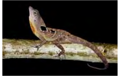
Anolis quadriocellifer .