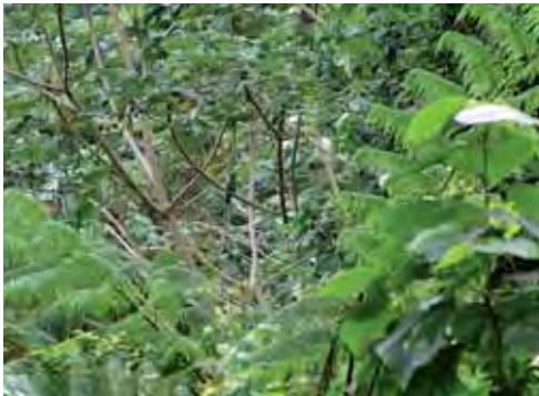
Bosque pluvial.

1930; Hardy, 1958; Ruibal y Williams, 1961; Schwartz, 1968; Estrada, 1994; Rodríguez Schettino, 1999a). Vive en el bosque pluvial submontano y en el bosque siempreverde mesófilo submontano, en sitios sombríos y húmedos. También puede encontrarse en áreas abiertas del interior del bosque, en los bordes y senderos. Los machos perchan en troncos de árboles y rocas y las hembras son más frecuentes sobre troncos caídos y rocas en el suelo (Ruibal y Williams, 1961; Estrada, 1994; Rodríguez Schettino, 1999a); la media de la altura sobre el suelo de la posta es de 1,04 m y la del diámetro, de 8,5 cm (Henderson y Powell, 2009). Cuando escapa corre hacia el estrato herbáceo, donde se esconde (Ruibal y Williams, 1961). Duerme sobre hojas de arbustos, alrededor de 1 m de altura sobre el suelo (Schwartz y Henderson, 1991) y con la cola enroscada a una hoja o rama fina (Hardy, 1958). De acuerdo con lo que Garrido (1980) observó en cautiverio, la fase precopulatoria dura 64 segundos, mientras que la cópula demora 28,66 min como