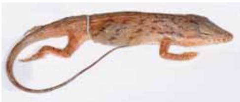
Anolis oporinus .