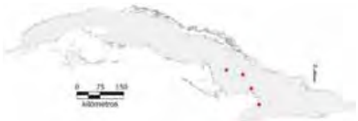
Área de ocupación donde se ha registrado Anolis terueli .

Tiene distribución regional con hábitats fragmentados cuya área de ocupación es de 16 km 2 y el tamaño de la población no se conoce.