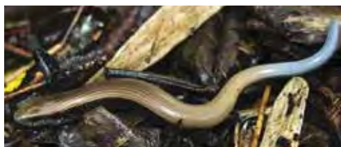
Diploglossus garridoi juvenil.