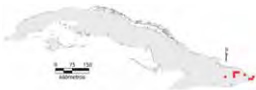
Área de ocupación donde se ha registrado Anolis cyanopleurus .

La especie tiene distribución regional, su hábitat está fragmentado con área de ocupación de 40 km 2 y el tamaño de la población no se conoce.