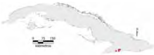
Área de ocupación donde se ha registrado Anolis clivicola .

Tiene distribución regional en un hábitat fragmentado cuya área de ocupación es de 16 km 2 y el tamaño de la población no se conoce.