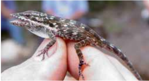
Anolis toldo . © GERARDO BEGUÉ QUIALA