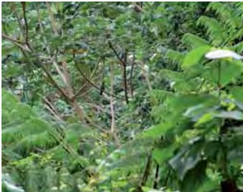
Bosque pluvial.