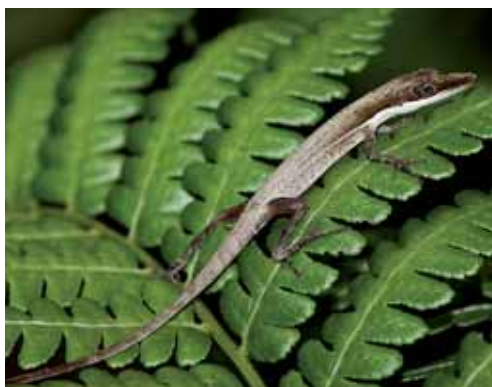
Anolis inexpectata .