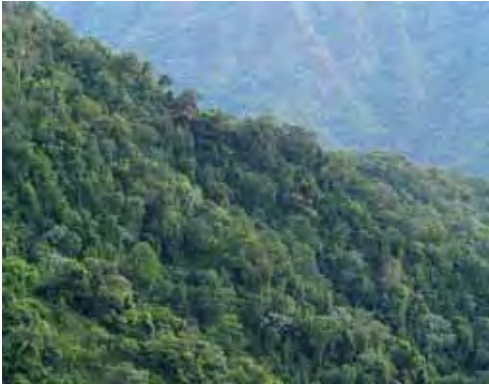
Bosque pluvial.