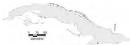
Área de ocupación donde se ha registrado Anolis altitudinalis .

Esta especie es endémica local y altitudinal en el Pico Turquino, provincia de Santiago de Cuba. Se le ha encontrado solo desde el Alto del Cardero (1 230 m snm) hasta 1 720 m snm en el Pico Cuba (Garrido, 1985; Garrido y Hedges, 2001). Habita en el bosque pluvial montano y en el bosque nublado típico, que son las formaciones vegetales que existen en ambas localidades, respectivamente (Schwartz y Henderson, 1991). De los pocos individuos hallados, tres hembras se observaron entre la hojarasca y un macho en un tronco de árbol a cerca de 4 m de altura sobre el suelo, todos en el Alto del Cardero; una hembra se encontró entre las partes bajas de las plantas de fresa en el Pico Cuba a 1 400 m snm. Los cuatro emitieron chillidos al ser manipulados (Garrido, 1985). Los huevos son de color blanco cremoso, ovalados de 10 x 5,7 mm (Garrido, 1985).