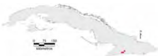
Área de ocupación donde se ha registrado Diploglossus garridoi .

Especie endémica de la Sierra Maestra, provincia de Granma (Thomas y Hedges, 1998; Díaz et al. , 2005; Fong, 2009). Hasta el momento se ha recolectado en bosque pluvial montano, pinar y vegetación secundaria, entre 600 y 1 700 m snm. Vive en el suelo, generalmente se encuentra bajo objetos superficiales (rocas, troncos caídos, basura y otros) (Thomas y Hedges, 1998). Una hembra grávida en junio contenía cuatro huevos (Thomas y Hedges, 1998).