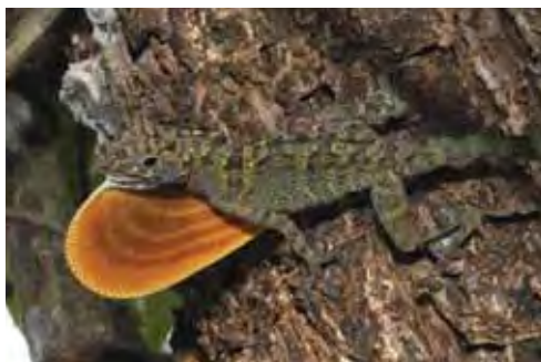
Anolis rubribarbus .

Los machos perchan sobre troncos de árboles y pinos, a pocos metros del suelo y defienden agresivamente sus territorios. Las hembras y juveniles se sitúan a menor altura que los machos y, en ocasiones, utilizan el estrato herbáceo, cerca del suelo. Cuando escapan, corren rápidamente hacia el suelo (Ruibal y Williams, 1961; Garrido, 1967). Sus