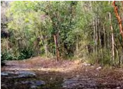
Bosque siempreverde micrófilo costero.