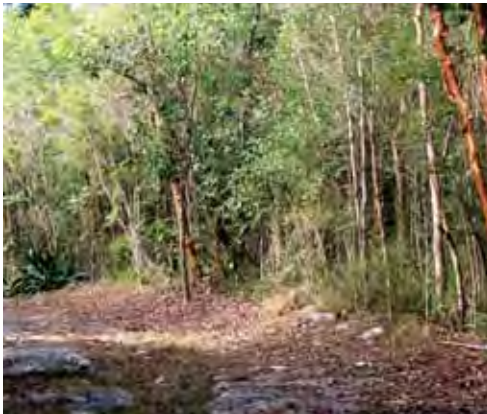
Bosque siempreverde micrófilo costero. © HIRAM GONZÁLEZ ALONSO