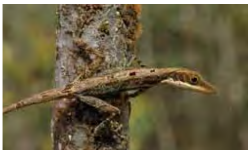
Anolis alfaroi .

Esta especie es endémica local del municipio de Yateras, provincia de Guantánamo. Se le ha hallado solo a 2 km al norte de La Mución, en el bosque aciculifolio con Pinus cubensis a 730 m snm. Habita entre las hierbas y arbustos a menos de un metro de altura sobre el nivel del suelo.