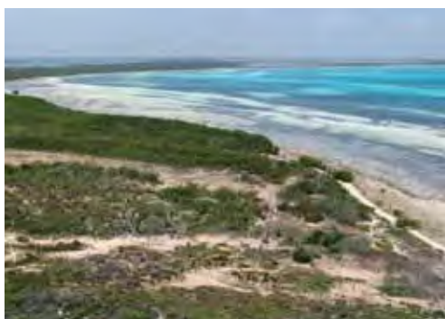
Bosque siempreverde micrófilo costero.