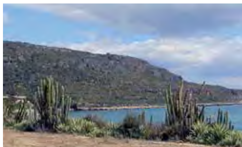
Matorral espinoso semidesértico costero.

(Díaz y Hedges, 2008). En las heces fecales, encontradas en las bolsas de recolecta de seis adultos, se hallaron cucarachas (Blaberinae y Blattidae), grillos, un coleóptero elatérico, hormigas del género Camponotus y varias piedras muy pequeñas (Díaz y Hedges, 2008). Deposita los huevos en nidos comunales en plantas secas de Agave , los cuales son blancos y ligeramente ovalados; 12 midieron entre 8,2 y 9,9 mm de anchura y entre 11,0 y 13,3 mm de longitud (media = 9,1 X 12,1 mm) (Díaz y Hedges, 2008).