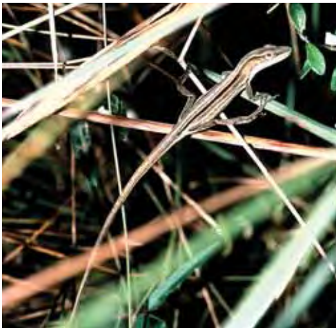
Anolis relictus . © KEVIN DE QUEIROZ