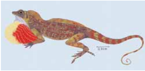
Anolis ahli . © RODRÍGUEZ SCHETTINO (1999b)