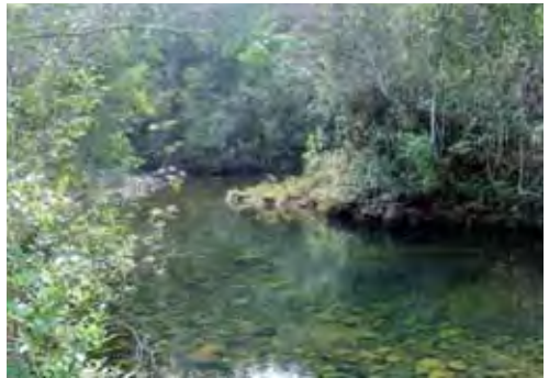
Bosque de galería.

Tiene distribución local en un hábitat continuo cuya área de ocupación es menor de 4 km 2 y el tamaño de la población no se conoce.