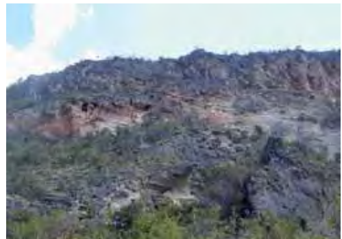
Matorral espinoso semidesértico costero.