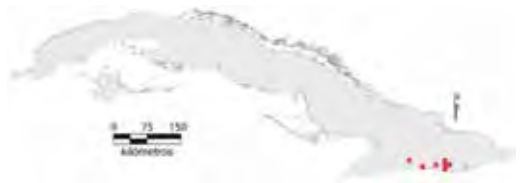
Área de ocupación donde se ha registrado Anolis relictus .

Tiene distribución regional con hábitats fragmentados cuya área de ocupación es de 28 km 2 y el tamaño de la población no se conoce.