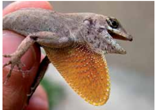
Anolis birama . © NILS NAVARRO