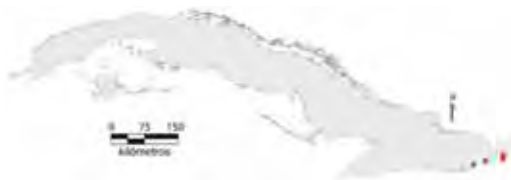
Área de ocupación donde se ha registrado Anolis imias .

Tiene distribución regional con hábitat continuo, cuya área de ocupación es de 16 km 2 y el tamaño de la población no se conoce.