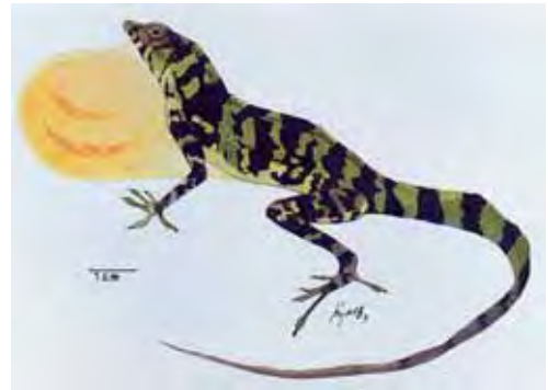
Anolis imias .