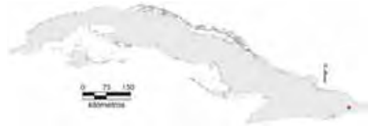
Área de ocupación donde se ha registrado Anolis vescus .