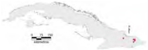
Área de ocupación donde se ha registrado Anolis cupeyalensis .

Tiene distribución regional, en un hábitat fragmentado cuya área de ocupación es de 20 km 2 y el tamaño de la población no se conoce.