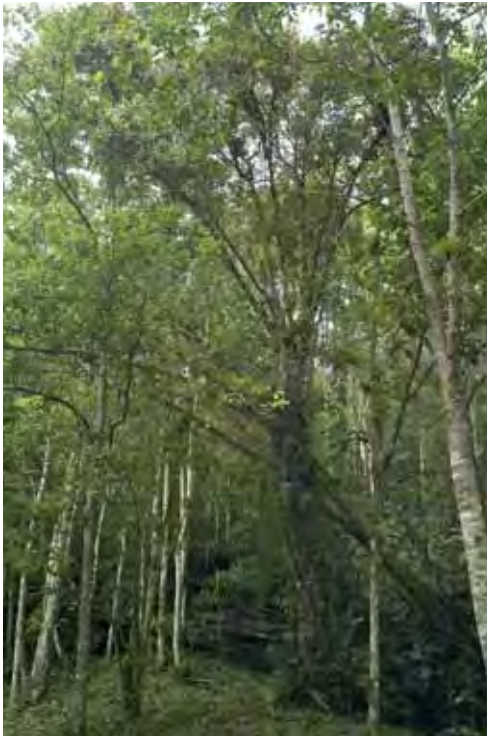
Bosque siempreverde.