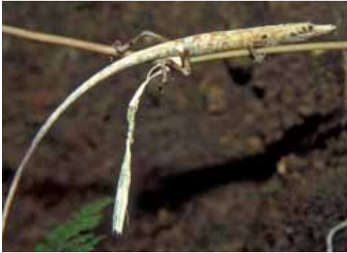
Anolis spectrum .

Especie endémica del centro y occidente de Cuba, en poblaciones aisladas de las provincias de Pinar del Río, La Habana y Matanzas (Gundlach, 1867; Buide, 1967; Garrido y Schwartz, 1972; Garrido, 1975; Silva et al. , 1982). Habita en pastos con focos de cultivos, sabanas naturales y vegetación secundaria,