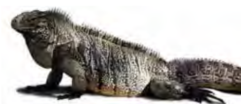
Cyclura nubila nubila . © JULIO A. LARRAMENDI