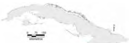
Área de ocupación donde se ha registrado Anolis ruibali .

Especie endémica de la Meseta de Cabo Cruz, en la provincia de Granma (Rodríguez Schettino, 1999; Navarro et al. , 2001; Navarro y Garrido, 2004). Probablemente, su distribución se extienda por la costa sur hasta los alrededores de La Mula, en la provincia de Santiago de Cuba. Aunque esta especie ha sido poco estudiada, su hábitat de mayor elección coincide con el de las demás especies del grupo argillaceus . Puede encontrarse en todo tipo de vegetación (natural o secundaria), con preferencia por el bosque siempreverde micrófilo costero y subcostero. Esta más activa luego de las 10:00 h, sobre arbustos de Aroma Amarilla ( Acacia farnesiana ) que crecen en zonas