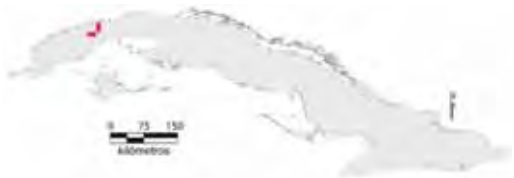
Área de ocupación donde se ha registrado Chamaeleolis barbatus .

Tiene distribución regional con hábitat fragmentado cuya área de ocupación es de 16 km 2 y el tamaño de la población no se conoce.