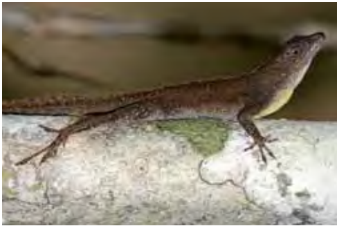
Anolis confusus .