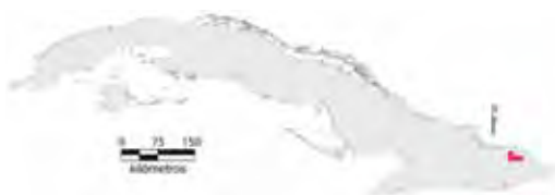
Área de ocupación donde se ha registrado Anolis inexpectata .

Tiene distribución regional en un hábitat fragmentado cuya área de ocupación es menor de 16 km 2 y el tamaño de la población no se conoce.