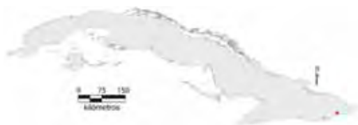
Área de ocupación donde se ha registrado Leiocephalus onaneyi .

Tiene distribución local con estado y área del hábitat desconocidos; el tamaño de la población no se conoce, aunque su área de ocupación es menor de 4 km 2 .