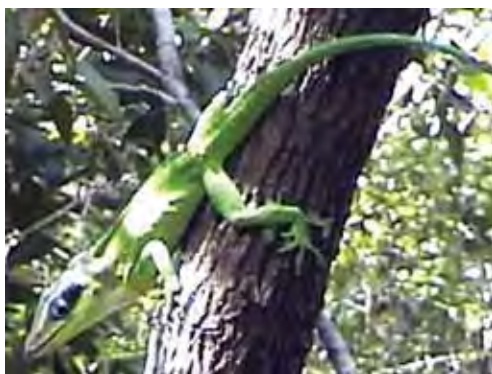
Anolis pigmaequestris . © ÁNGEL ARIAS BARRETO