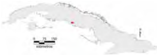
Área de ocupación donde se ha registrado Chamaeleolis guamuhaya .

Tiene distribución regional en hábitat fragmentado cuya área de ocupación es de 8 km 2 y el tamaño de la población no se conoce.