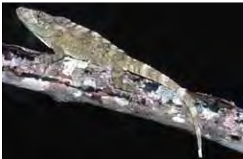
Chamaeleolis guamuhaya .

Especie endémica de las montañas de Guamuhaya, provincia de Sancti Spiritus (Garrido y Schwartz, 1967; Garrido, 1982; Garrido et al. , 1991). Se le ha encontrado solo en los alrededores de Topes de Collantes entre 500 y 900 m snm, en el bosque