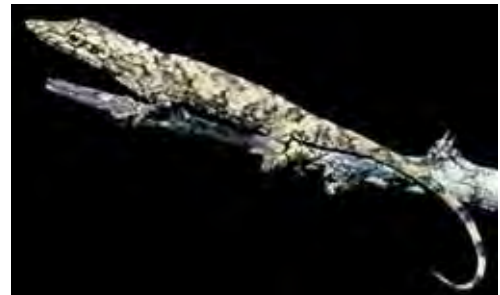
Anolis garridoi . © KEVIN DE QUEIROZ