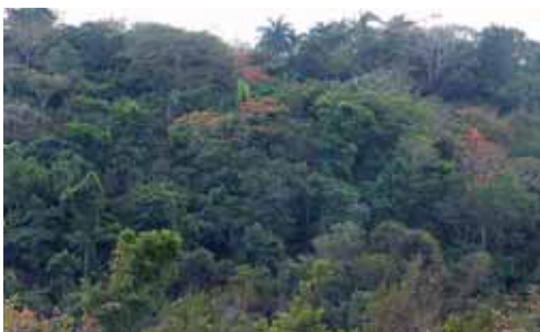
Bosque siempreverde.