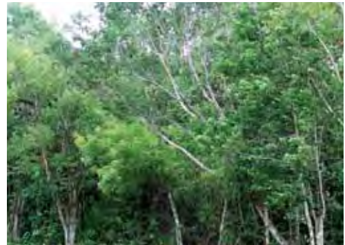
Bosque semidecídúo.