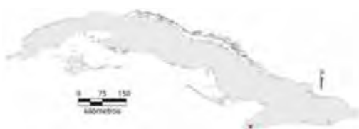
Área de ocupación donde se ha registrado Chamaeleolis aguerori .

Tiene distribución local en un hábitat continuo cuya área de ocupación es de 4 km 2 y el tamaño de la población no se conoce.