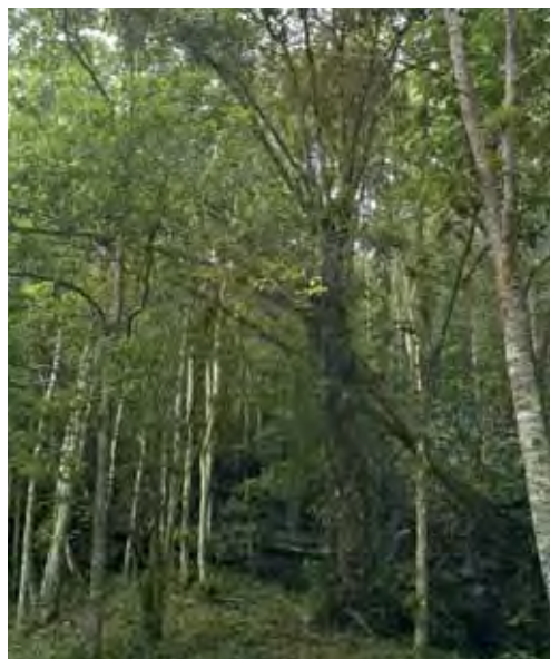
Bosque siempreverde.