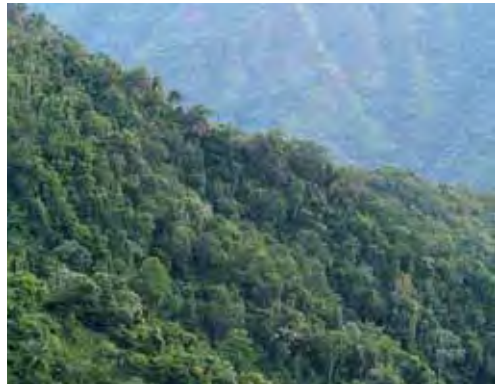
Bosque pluvial.