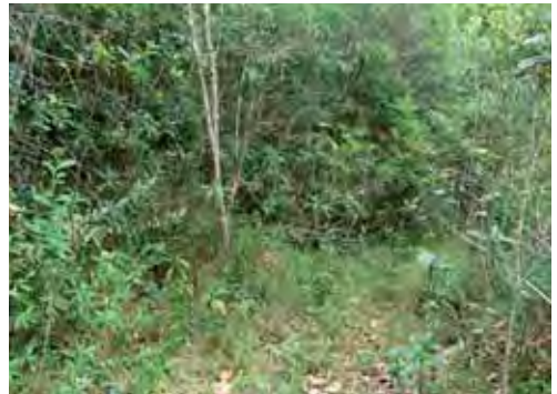
Bosque pluvial.

hojas cuando se ve en peligro (Garrido, 1975). Al parecer su ciclo de reproducción es corto, pues las hembras capturadas en enero, febrero y junio no estaban grávidas (Rodríguez Schettino, 1999b). Aunque se le ha encontrado en varias localidades, no se le observa fácilmente por lo que, al parecer, no es abundante. No obstante, Garrido (1975) recolectó 16 ejemplares en la población de Nuevo Mundo en 1972, Fong et al. (2005b) encontraron la especie como común en El Toldo, al igual que N. Navarro (com. pers., 2009) la halló como numerosa en la misma localidad.