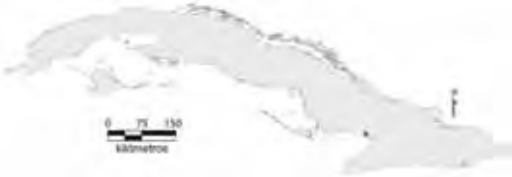
Área de ocupación donde se ha registrado Anolis birama .

Su distribución es local en un hábitat deteriorado, con área de ocupación es menor de 4 km 2 y el tamaño de la población no se ha calculado.