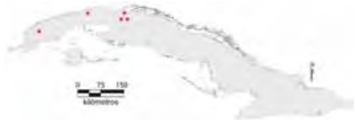
Área de ocupación donde se ha registrado Anolis spectrum .

Tiene distribución regional con el estado de los hábitats desconocidos, el área de ocupación es de 20 km 2 y el tamaño de la población no se conoce.