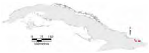
Área de ocupación donde se ha registrado Anolis fugitivus .

hojas cuando se ve en peligro (Garrido, 1975). Al parecer su ciclo de reproducción es corto, pues las hembras capturadas en enero, febrero y junio no estaban grávidas (Rodríguez Schettino, 1999b). Aunque se le ha encontrado en varias localidades, no se le observa fácilmente por lo que, al parecer, no es abundante. No obstante, Garrido (1975) recolectó 16 ejemplares en la población de Nuevo Mundo en 1972, Fong et al. (2005b) encontraron la especie como común en El Toldo, al igual que N. Navarro (com. pers., 2009) la halló como numerosa en la misma localidad.