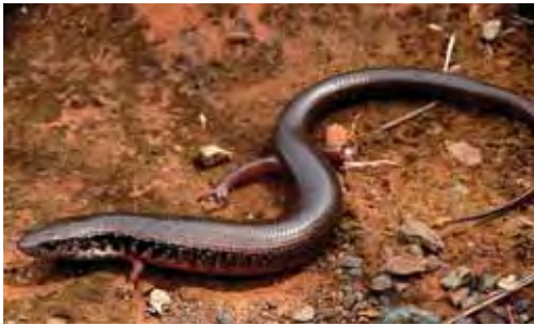
Diploglossus nigropunctatus .