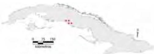
Área de ocupación donde se ha registrado Anolis vanidicus .

Tiene distribución regional con el estado del hábitat desconocido, el área de ocupación es de 16 km 2 y el tamaño de la población no se conoce.