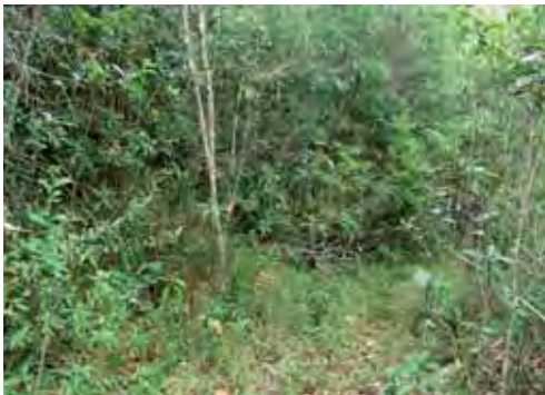
Bosque pluvial.