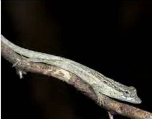
Anolis ruibali . © NILS NAVARRO PACHECO