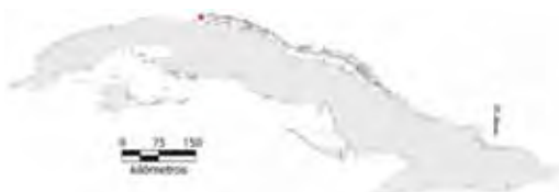
Área de ocupación donde se ha registrado Aristelliger reyesi .

Tiene distribución local con hábitats fragmentados cuya área de ocupación es de 4 km 2 y ha disminuido en 20 % en los últimos 15 años; el tamaño de la población no se conoce.