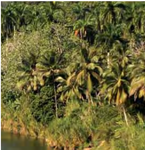
Bosque de galería.