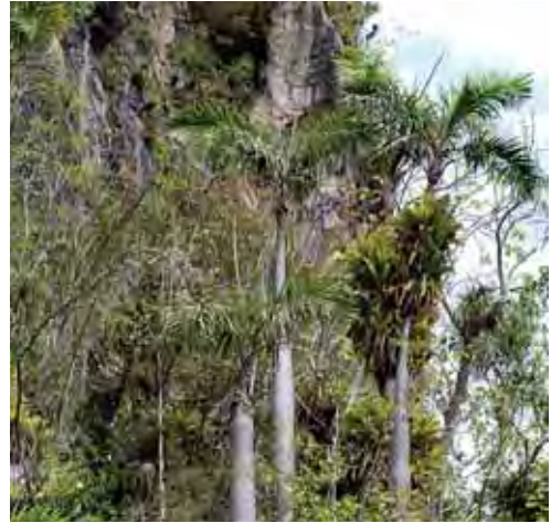
Vegetación de mogote.