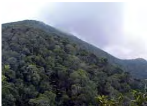
Bosque siempreverde.

más altas y periféricas de las guásimas y otros árboles, a 3 o 4 m de altura sobre el suelo (Rodríguez Schettino, 1999b). La altura media de esta altura es de 2,3 m y del diámetro de las ramas, de 0,9 cm (Henderson y Powell, 2009). Se agazapa sobre las ramas, casi inmóvil y se mueve lentamente; cuando se le molesta, salta hacia la vegetación herbácea del suelo donde se hace casi imperceptible (Garrido, 1983). Una vez que dos machos se enfrentan, despliegan parcialmente los pliegues gulares y abren las bocas (Garrido, 1983). En marzo de 1980 se encontró común (10 individuos) en la localidad tipo (La Emajagua) (Rodríguez Schettino, 1985), pero en mayo de 1986 ya no se le halló ni en el mismo lugar ni en los mismos árboles (Rodríguez Schettino, 1999b). Díaz et al. (1996) recolectaron 12 ejemplares en La Pimienta y Fong (2000), un ejemplar en 3 km al norte de la desembocadura del río La Mula.