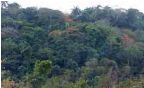
Bosque siempreverde.