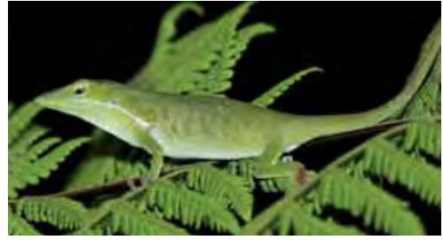
Anolis altitudinalis .