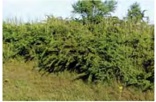
Vegetación secundaria con aromales.

Especie endémica de las provincias de Camagüey, Las Tunas y Granma (Garrido, 1975; Navarro et al. , 2001). Habita en vegetación secundaria y cultivos con focos de pastos. Se le ha encontrado sobre postes de cercas en pastos con aromales ( Acacia farnesiana ). Se alimenta primariamente de insectos (Navarro et al. , 2001).