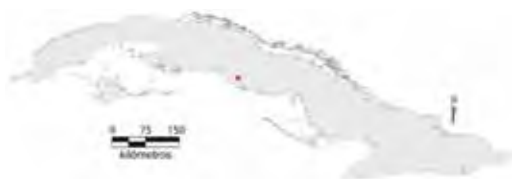
Área de ocupación donde se ha registrado Anolis garridoi .

Especie endémica de Topes de Collantes, provincia de Sancti Spiritus (Díaz et al. , 1996). Se le ha encontrado solo en los alrededores de Topes de Collantes entre 700 y 800 m snm, en el bosque siempreverde mesófilo submontano (Rodríguez Schettino, 1999b), aunque algunos individuos han sido vistos en senderos al borde del bosque. Es una especie del grupo de los habitantes de ramas de árboles y arbustos (Rodríguez Schettino, 1999b) y solo un individuo ha sido hallado sobre el tronco de un árbol. Se le ha observado en alturas sobre el suelo entre 0,3 y 30 m, siempre en lugares