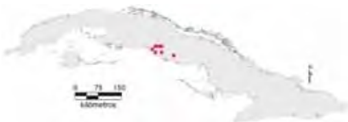
Área de ocupación donde se ha registrado Anolis ahli .

1930; Hardy, 1958; Ruibal y Williams, 1961; Schwartz, 1968; Estrada, 1994; Rodríguez Schettino, 1999a). Vive en el bosque pluvial submontano y en el bosque siempreverde mesófilo submontano, en sitios sombríos y húmedos. También puede encontrarse en áreas abiertas del interior del bosque, en los bordes y senderos. Los machos perchan en troncos de árboles y rocas y las hembras son más frecuentes sobre troncos caídos y rocas en el suelo (Ruibal y Williams, 1961; Estrada, 1994; Rodríguez Schettino, 1999a); la media de la altura sobre el suelo de la posta es de 1,04 m y la del diámetro, de 8,5 cm (Henderson y Powell, 2009). Cuando escapa corre hacia el estrato herbáceo, donde se esconde (Ruibal y Williams, 1961). Duerme sobre hojas de arbustos, alrededor de 1 m de altura sobre el suelo (Schwartz y Henderson, 1991) y con la cola enroscada a una hoja o rama fina (Hardy, 1958). De acuerdo con lo que Garrido (1980) observó en cautiverio, la fase precopulatoria dura 64 segundos, mientras que la cópula demora 28,66 min como