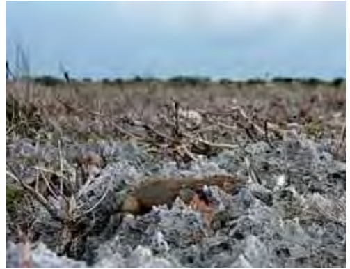
Vegetación de costa rocosa.

El género Cyclura es exclusivo de la región del Caribe. La subespecie representante del género en Cuba, Cyclura nubila nubila , es endémica y se