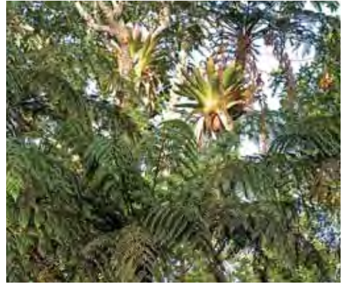
Bosque nublado.