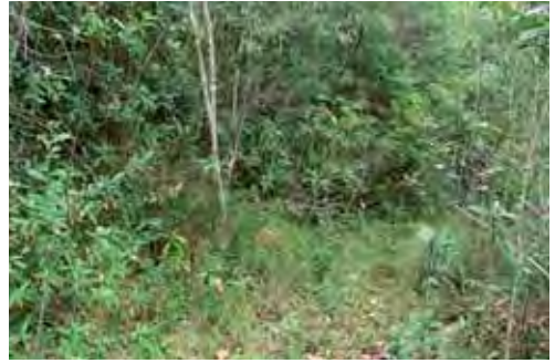
Bosque pluvial.

Especie endémica de la región oriental de Cuba, provincias de Holguín y Guantánamo (Garrido, 1975; Estrada et al. , 1987). Se halla en las comunidades herbáceas secundarias, donde abundan los helechos rastreros, a orillas de ríos y arroyos. Se le encuentra desde el nivel del mar hasta 704 m snm. Habita en las hojas y tallos de las hierbas, cerca del suelo, a la sombra; se mantiene agazapada y salta entre las