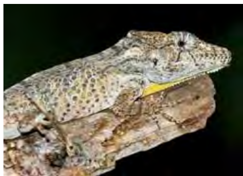
Chamaeleolis aguerori .

Especie endémica de Cabo Cruz, en la provincia de Granma (Díaz et al. , 1998). Se le ha encontrado en el bosque siempreverde micrófilo costero y subcostero y en plantaciones de soplillo ( Lysiloma latiliqua ). Las heces de cinco individuos contenían restos de coleópteros, lepidópteros y ortópteros (Díaz et al. , 1998).