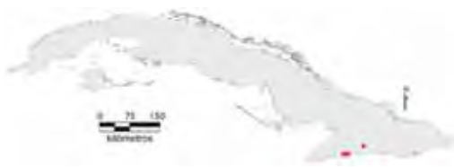
Área de ocupación donde se ha registrado Anolis guazuma .

más altas y periféricas de las guásimas y otros árboles, a 3 o 4 m de altura sobre el suelo (Rodríguez Schettino, 1999b). La altura media de esta altura es de 2,3 m y del diámetro de las ramas, de 0,9 cm (Henderson y Powell, 2009). Se agazapa sobre las ramas, casi inmóvil y se mueve lentamente; cuando se le molesta, salta hacia la vegetación herbácea del suelo donde se hace casi imperceptible (Garrido, 1983). Una vez que dos machos se enfrentan, despliegan parcialmente los pliegues gulares y abren las bocas (Garrido, 1983). En marzo de 1980 se encontró común (10 individuos) en la localidad tipo (La Emajagua) (Rodríguez Schettino, 1985), pero en mayo de 1986 ya no se le halló ni en el mismo lugar ni en los mismos árboles (Rodríguez Schettino, 1999b). Díaz et al. (1996) recolectaron 12 ejemplares en La Pimienta y Fong (2000), un ejemplar en 3 km al norte de la desembocadura del río La Mula.