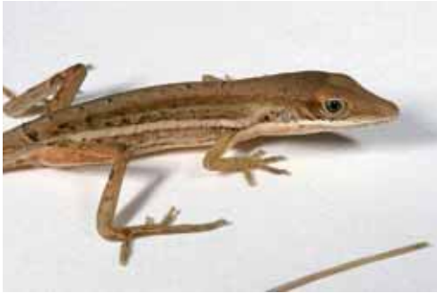
Anolis juangundlachi .