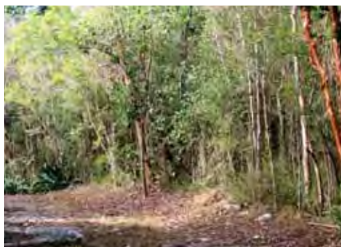
Bosque siempreverde micrófilo costero.

Tiene distribución local en un hábitat continuo cuya área de ocupación es de 4 km 2 y el tamaño de la población no se conoce.