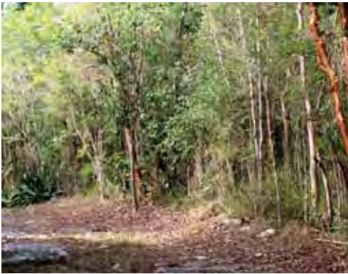
Bosque siempreverde micrófilo costero.