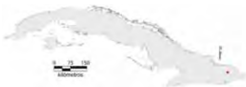
Área de ocupación donde se ha registrado Anolis alfaroi .