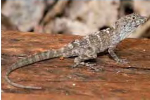
Anolis guafe .