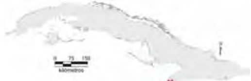
Área de ocupación donde se ha registrado Anolis confusus .

Tiene distribución regional, cuya área de ocupación es de 8 km 2 y el tamaño de la población no se conoce.