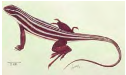
Leiocephalus onaneyi . © RODRÍGUEZ SCHETTINO (1999b)