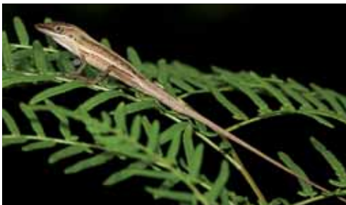
Anolis cupeyalensis .

La especie habita en el extremo oriental de Cuba. Se le encuentra en seis localidades, dentro de dos áreas protegidas. Sin embargo, las seis localidades están en zonas de minería y una de ellas, además, en el área del trasvase Este-Oeste, tramo Melones-Sabanilla, por lo que se proyecta una afectación