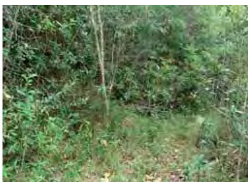
Bosque pluvial.

encontrado en nueve localidades, no se le observa fácilmente; sin embargo, Fong et al. (2005) la clasificaron común en El Toldo.