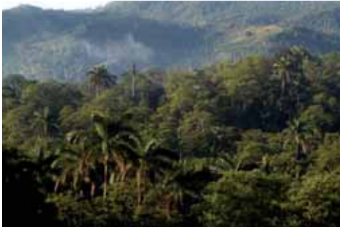
Bosque siempreverde.

siempreverde mesófilo submontano (Rodríguez Schettino, 1999a). Es una especie del grupo de los habitantes de troncos y ramas altas de árboles. Se le ha visto en alturas sobre el suelo entre 2 y 6 m, siempre en lugares sombreados (Garrido et al. , 1991; Rodríguez Schettino, 1999a). Se mueve lentamente, cuando se le molesta, trepa a otra rama (Garrido et al. , 1991). En cautiverio capturó insectos con la lengua extendida (Rodríguez Schettino, 1999a).