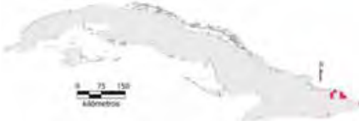
Área de ocupación donde se ha registrado Anolis rubribarbus .

Tiene distribución regional con hábitats en estado desconocido; su área de ocupación es de 28 km 2 y el tamaño de la población no se conoce.