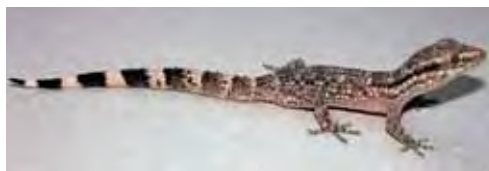
Tarentola crombiei .

Esta especie es endémica de la costa sur oriental de Cuba, provincia de Guantánamo (Díaz y Hedges, 2008). Se le ha hallado en el matorral espinoso semidesértico costero, desde la costa hasta alrededor de 400 m snm (Díaz y Hedges, 2008). De noche está activa sobre arbustos entre 0,5 y 3 m de altura sobre el suelo y sobre rocas. De día se refugia dentro de las hojas de plantas del género Agave