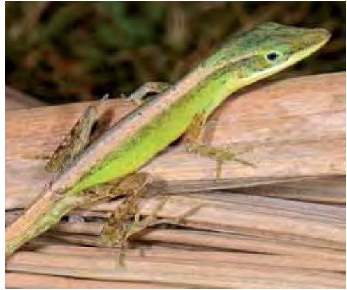
Anolis cyanopleurus .