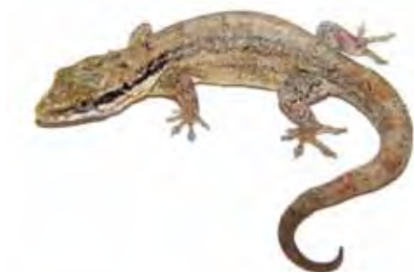
Aristelliger reyesi .