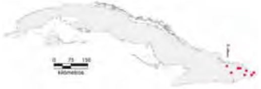
Área de ocupación donde se ha registrado Diploglossus nigropunctatus .

Tiene distribución regional con hábitats fragmentados cuya área de ocupación es de 32 km 2 y el tamaño de la población no se conoce.