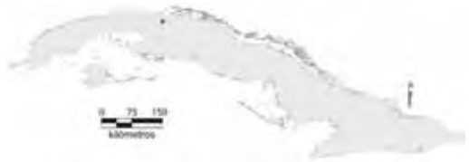
Área de ocupación donde se ha registrado Anolis juangundlachi .

Tiene distribución local en un hábitat continuo cuya área de ocupación es menor de 4 km 2 y el tamaño de la población no se conoce.