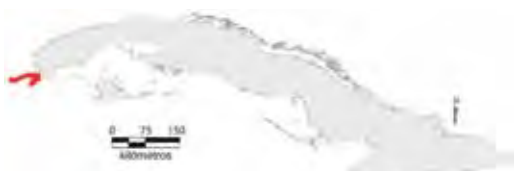
Área de ocupación donde se ha registrado Anolis quadriocellifer .

Tiene distribución regional en hábitats fragmentados cuya área de ocupación es menor de 52 km 2 y el tamaño de la población está estable.