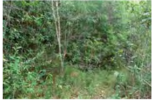
Bosque pluvial.

Tiene distribución local con hábitat continuo cuya área de ocupación es menor de 4 km 2 y el tamaño de la población no se conoce.