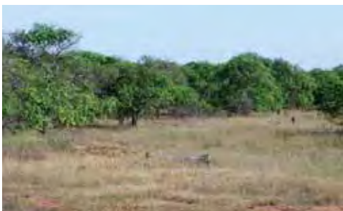
Pastos con focos de cultivos.

desde la costa hasta 200 m snm (Rodríguez Schettino, 1999). Ocupa las pequeñas ramas y hojas del estrato herbáceo, nunca a más de un metro por encima del suelo, y prefiere los sitios sombreados (Ruibal, 1964; Garrido y Schwartz, 1972). Permanece inmóvil sobre ramas y hojas donde es casi imperceptible. Para escapar, generalmente, salta con rapidez y se oculta debajo de las hojas aunque algunos individuos escapan corriendo velozmente