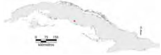
Área de ocupación donde se ha registrado Anolis delafuentei .

Tiene distribución local en un hábitat continuo cuya área de ocupación es menor de 4 km 2 y el tamaño de la población no se conoce.