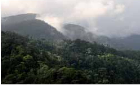
Bosque nublado.