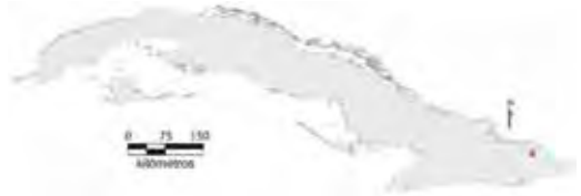
Área de ocupación donde se ha registrado Anolis toldo .

Tiene distribución local en hábitat continuo cuya área de ocupación es de 4 km 2 y el tamaño de la población no se conoce.