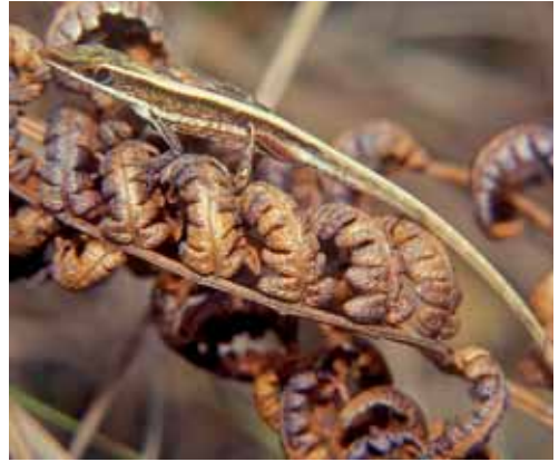
Anolis fugitivus .

Especie endémica de la región oriental de Cuba, provincias de Holguín y de Guantánamo (Garrido, 1975; Schwartz y Henderson, 1988; Fong et al. , 2005a y b). Se halla en las comunidades herbáceas secundarias, donde abunda la "cortadera" ( Arthrostylidium sp.) a orillas de ríos y arroyos (Garrido, 1975), en el bosque pluvial submontano y de baja altitud (Rodríguez Schettino et al. , 1999). Se le encuentra desde el nivel del mar hasta 704 m snm y habita en las hojas y tallos de las hierbas, cerca del suelo, a la sombra, donde se le localiza durante las primeras horas del día y a últimas horas de la tarde (Rodríguez Schettino, 1999b). Se mantiene agazapada y salta entre las