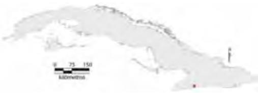
Área de ocupación donde se ha registrado Anolis incredulus .

Tiene distribución local en un hábitat continuo cuya área de ocupación es de 4 km 2 y el tamaño de la población no se conoce.