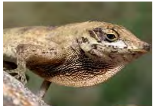
Anolis clivicola .

Especie endémica de la Sierra Maestra, provincias de Granma y de Santiago de Cuba (Barbour y Shreve, 1935; Schwartz y Garrido, 1971; Schwartz y Henderson, 1988; Díaz et al. , 2005). Se le ha encontrado en el bosque nublado típico y en el bosque pluvial montano entre 800 y 1 872 m snm. Habita sobre troncos, helechos, entre las hierbas y en la hojarasca; los machos llegan hasta 6 m de altura sobre el suelo, mientras que las hembras y juveniles están en el suelo, raíces y hierbas (Garrido, 1980; Rodríguez Schettino, 1999b).