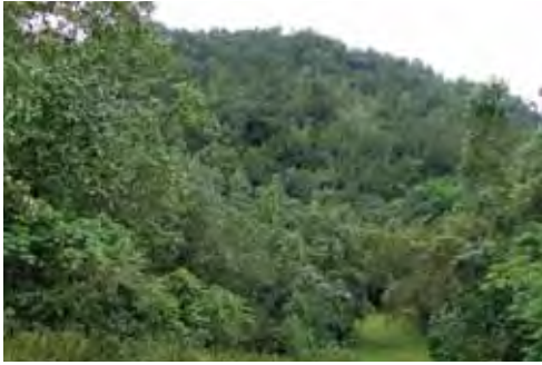
Bosque pluvial.

hábitos y coloración críptica dificultan su detección. Se desconocen sus hábitos alimentarios en vida libre. En cautiverio ha sido alimentada con guasasas ( Drosophila ), hormigas y cochinillas (Isopoda) (Rodríguez Schettino, 1999b).