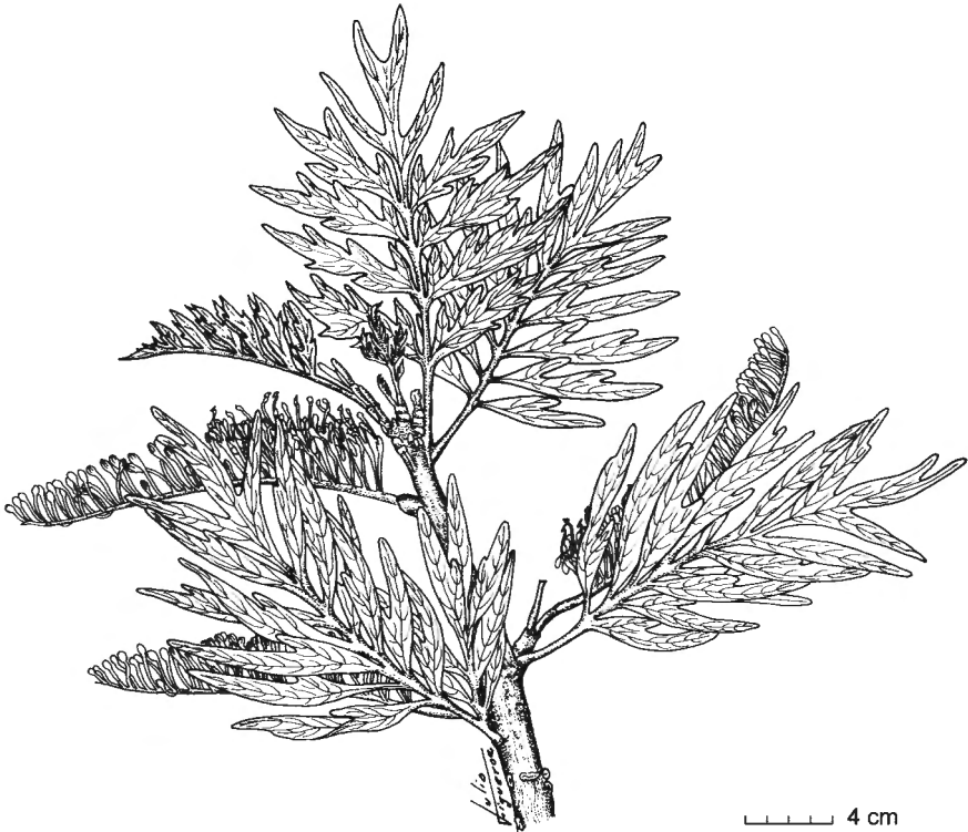
Figura 1. Grevillea robusta A. Cunn. ex R. Br. (adaptado de fuente no identificada por Julio Figueroa); Rama florecida.