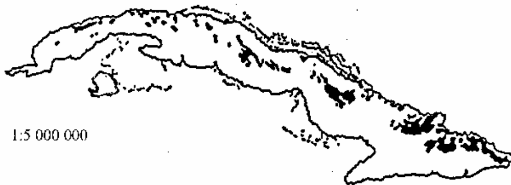
Fig. 1. Principales afloramientos de serpentina

Se conoce comúnmente como flora y vegetación de serpentina aquella que se desarrolla sobre suelos derivados de rocas serpentinitas; la serpentina es el conjunto de minerales ricos en Magnesio, con una composición cercana a Mg_3 Si_2 O_5 (OH)_4 , conteniendo cantidades variables de Hierro y Aluminio, que constituyen el principal componente de dichas rocas. El aspecto veteado como la piel de una serpiente le ha dado ese nombre (y también el de ofiolitas).