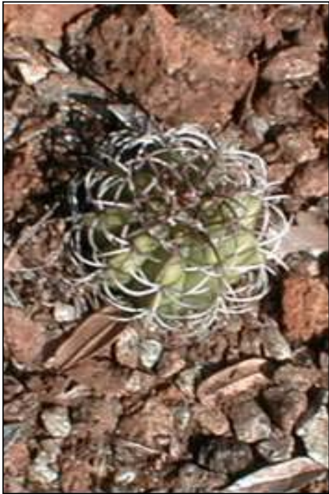
Melocactus actinacanthus Areces En Peligro Crítico (CR)