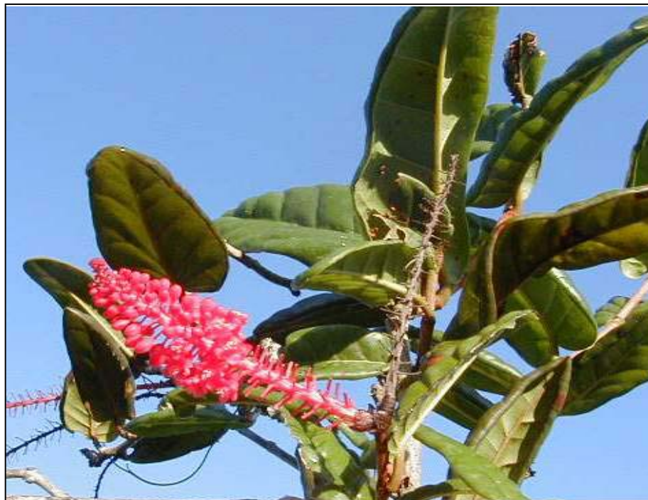
Cocoloba cowellii Britt. En Peligro (EN)