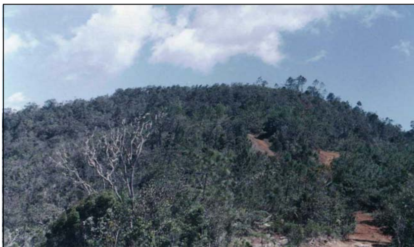
Pinares y charrascales. Explanada del Duaba, Guantánamo