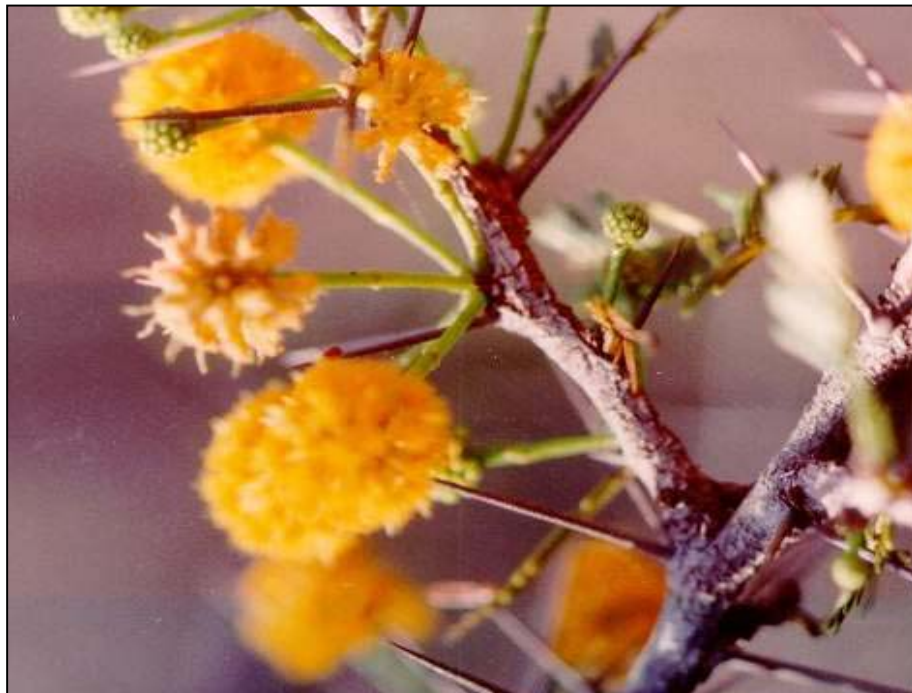
Acacia daemon Ekman ex Urb. En Peligro (EN)