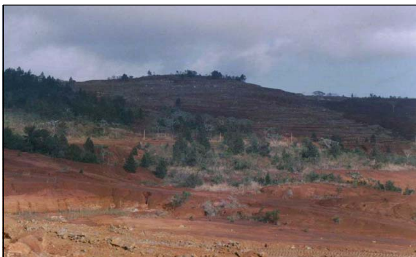
Pinares y charrascales. Explotación minera, Mayarí, Holguín