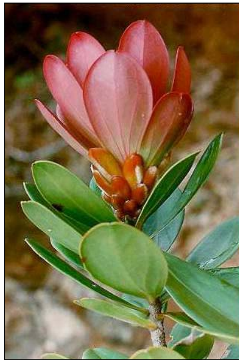
Purdiaea velutina Britt. et Wils.