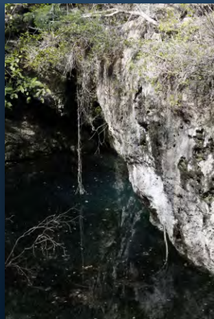
Sistema espeleo-lacustre de la Ciénaga de Zapata

La especie está distribuido en todos los ecosistemas dulceacuícolas cubanos.