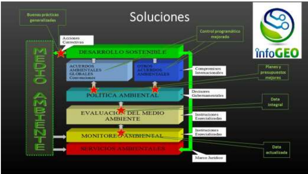
Ilustración 2 Esquema de los puntos de intervención del proyecto en el contexto del manejo del medio ambiente y el conocimiento en el ámbito ambiental.

El proyecto está constituido por tres componentes, la Componente 1 (Diseño y Conceptualización General del SNIA y perfeccionamiento del flujo de información y el marco legal del CITMA), dedicada en esencia al contenido del sistema de manejo de la información y el conocimiento, donde se prevé determinar los roles y funciones, así como el despliegue del Sistema Nacional de Información ambiental (SNIA). A partir de esta salida, se precisarán estos mismos aspectos en el ámbito del segmento ambiental del CITMA, donde es posible establecer el marco regulatorio correspondiente. La Componente 2 (Fortalecimiento de capacidades de la plataforma INFOGEO y sus nodos) está dedicada fundamentalmente a proveer la plataforma informática y de comunicaciones necesaria para llevar adelante la implementación del SNIA en el segmento ambiental del CITMA. La Componente 3