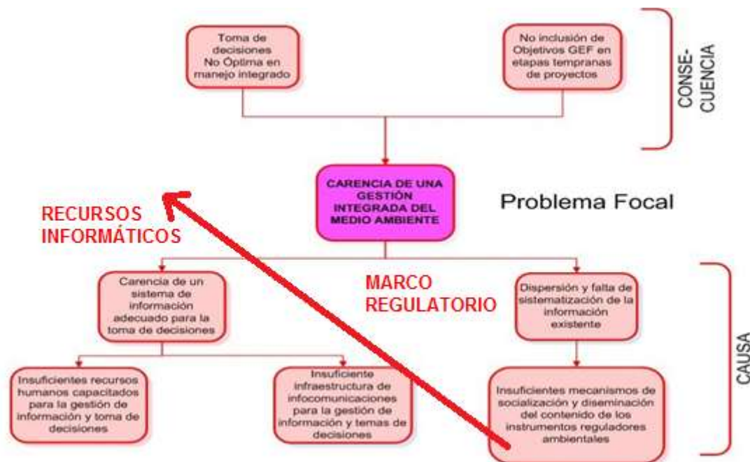
Ilustración 1 Árbol de problemas donde se muestran los dos aspectos básicos de las causas del Problema Focal, la carencia de recursos informáticos y su base tecnológica por una parte y un marco regulatorio de la actividad débil

Los estudios de sostenibilidad de los proyectos financiados por el FMAM indicaron la necesidad de que los países llevaran a cabo un proyecto de auto-evaluación de barreras en el cumplimiento de los objetivos globales planteados por el FMAM. No obstante haberse obtenido buenos resultados en todas y cada una de las intervenciones financiadas por el FMAM, el estudio de barreras llevado a cabo en Cuba en relación con los objetivos del FMAM culminado con el informe de país conocido como Informe NCSA (Evaluación Nacional de Capacidades para el Manejo Ambiental Global en Cuba dentro del CBD, el UNCCD y el UNFCCC) mostró, que existían barreras con un carácter transversal a los puntos focales de FMAM.