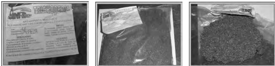
Figura 8.2. Muestra de bioplaguicida Trichoderma que se comercializa para el control de hongos fitopatógenos del suelo.

El más utilizado pertenece al género Trichoderma (figura 8.2), que se emplea principalmente en el control de enfermedades fungosas del suelo, aunque también hay experiencias para regular poblaciones de hongos que afectan los frutos en la etapa de post-cosecha y existen avances en el tratamiento contra patógenos foliares, hongos que sirven de alimento a los insectos y fitonemátodos, entre otros.