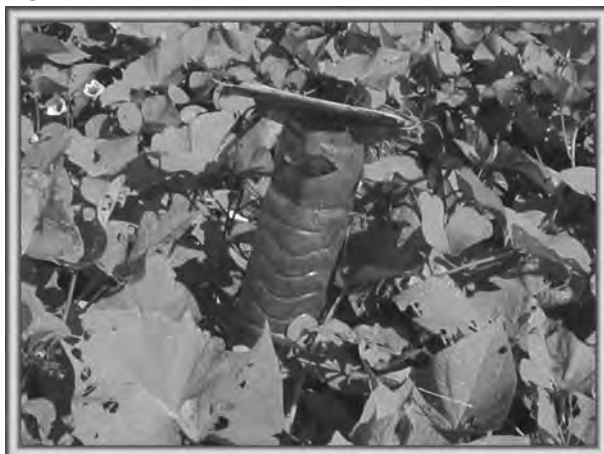
Figura 8.5. Trampa rústica de frasco plástico de desecho, confeccionada para la captura de adultos del tetuán del boniato. Encima de la trampa se coloca un techito o cubierta de bráctea de palma real para proteger la trampa de las radiaciones solares directas y de la lluvia.

Pomos plásticos, feromona y bioplaguicida (trampa de tetuán). Son las trampas del tetuán del boniato ( Cylas formicarius ) que emplean una feromona específica para la atracción de los adultos. El bioplaguicida Beauveria bassiana , en forma sólida, se introduce en el fondo de la trampa para que infecte los adultos atrapados. Posteriormente, dichos adultos son liberados para que dispersen el hongo en el resto de la población que está en el campo y la trampa se activa de nuevo con el bioproducto (figura 8.5).