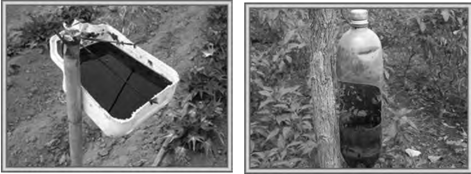
Figura 8.9. Trampa de melaza con pedestal. Recipiente abierto y frasco con orificios laterales.

Trampa de pseudo tallo de plátano combinada con bioplaguicidas. Recomendada para la captura e inoculación con bioplaguicidas de adultos del picudo negro ( Cosmopolites sordidus ). En este caso el bioplaguicida se coloca en la trampa para que cuando los adultos acudan se infecten y al regresar a la planta contaminen al resto de la población; es decir, los adultos dispersan el control biológico en el campo. Pueden utilizarse de dos formas: