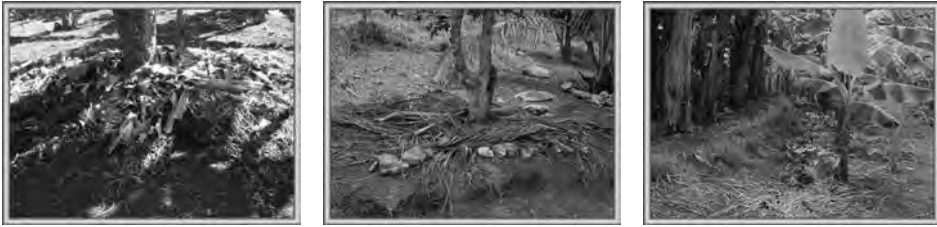
Figura 6.2. El arroje de los subproductos del deshierbe y otras labores es una práctica que ofrece diversos servicios ecológicos.

Por otra parte, las plantas que se consideran de cobertura son aquellas que tienen un sistema radicular poco profundo y cubren la superficie del suelo, por lo que no compiten con el cultivo; en cambio, ayudan a mantener la humedad del suelo, suprimen el desarrollo de las plantas indeseables y protegen el suelo de la erosión por las corrientes de agua.