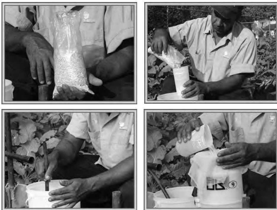
Figura 8.1. La preparación del caldo en las aplicaciones de bioplaguicidas exige: (1) calidad del producto, (2) buena pre mezcla, (3) agitar bien para diluir el producto y separar las esporas del sustrato y (4) filtrar para que al caldo no vayan partículas del sustrato.

y con la tecnología de aplicación (equipos, parámetros, etc.), entre otros elementos como la capacidad técnica y de observación del agricultor, etcétera.