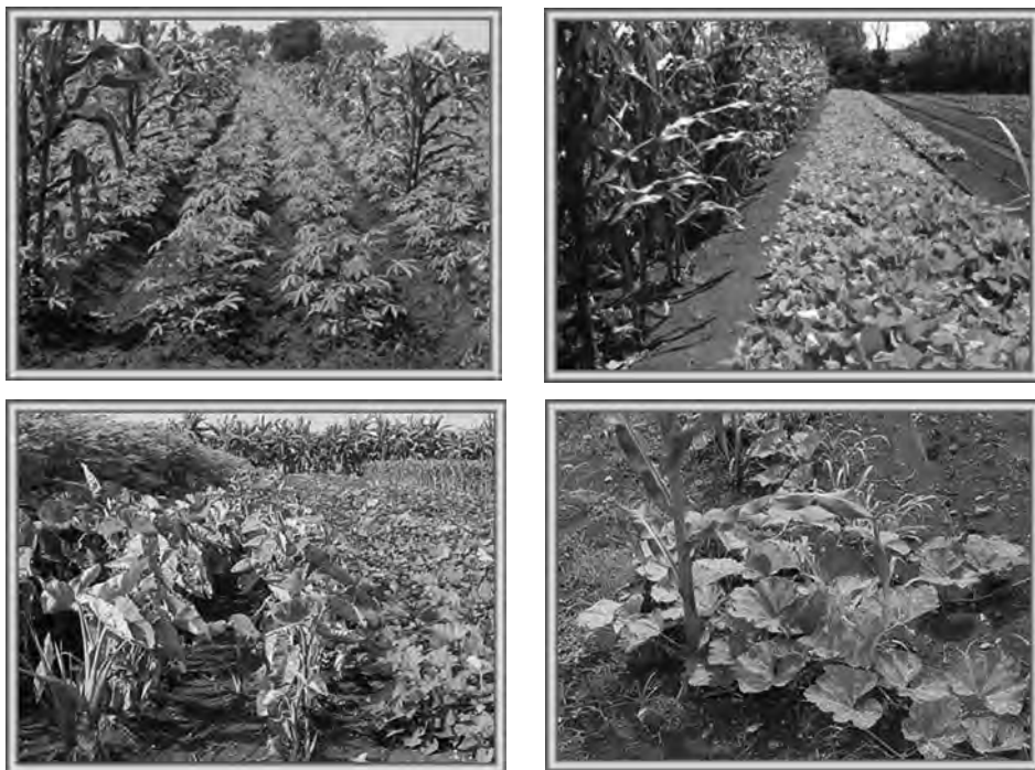
Figura 7.2. Principales usos del maíz por sus efectos ecológicos en los policultivos. De izquierda a derecha: Intercalamiento, barrera viva, mosaico de cultivos y asociación.

En Cuba se aprecian buenos resultados, principalmente en el sector cooperativo, donde las asociaciones maíz-frijol se han incrementado y surgen otras variantes muy interesantes, como la asociación maíz-boniato, que permite el aumento de la fauna de hormigas, que actúa