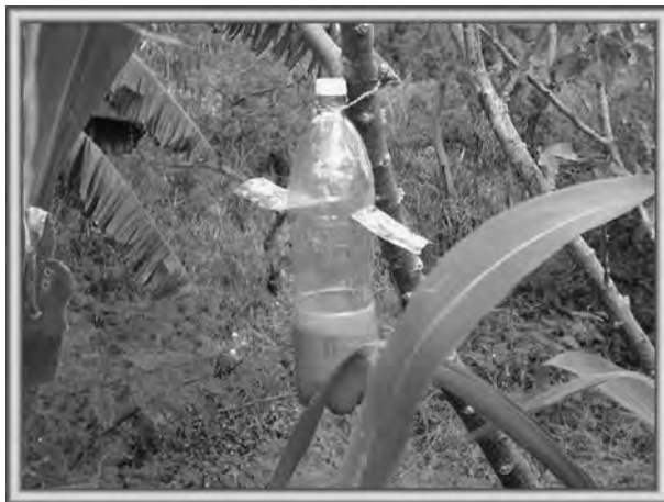
Figura 8.4. La trampa rústica de frasco plástico de desecho para introducir el atrayente olfativo y combinado con el amarillo como atrayente visual.

Pomos plásticos, feromona y bioplaguicida (trampa de tetuán). Son las trampas del tetuán del boniato ( Cylas formicarius ) que emplean una feromona específica para la atracción de los adultos. El bioplaguicida Beauveria bassiana , en forma sólida, se introduce en el fondo de la trampa para que infecte los adultos atrapados. Posteriormente, dichos adultos son liberados para que dispersen el hongo en el resto de la población que está en el campo y la trampa se activa de nuevo con el bioproducto (figura 8.5).