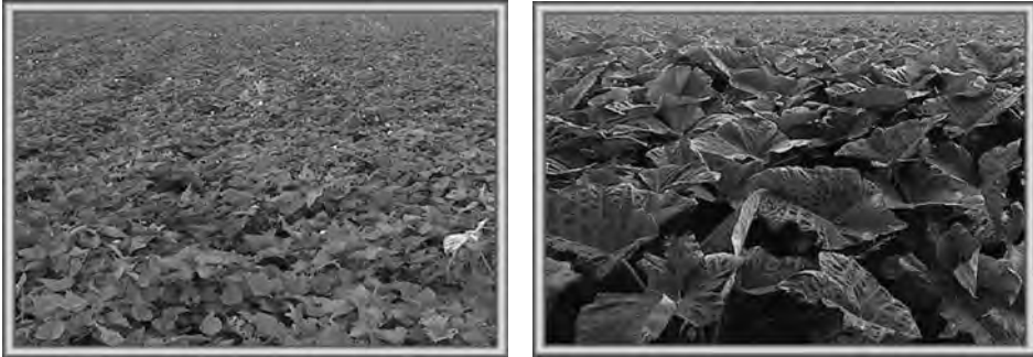
Figura 6.1. Los sistemas de rotación que incluyen cultivos que cubren, como el boniato y la malanga, contribuye a reducir los niveles de arvenses en los campos.

El sistema de rotación de cultivos es contextual, pues su éxito depende mucho de las condiciones edafoclimáticas, de las especies de plantas que se cultivan y de las exigencias del mercado, entre otros factores.