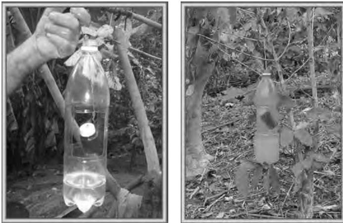
Figura 8.6. Trampa rústica de frascos plásticos y atrayentes alcohólicos utilizadas para la captura de la broca del café ( Hypothenemus hampei ).

Una variante de esta trampa es sustituir el agua del fondo del pomo por bioproducto sólido de Beauveria bassiana , utilizando cepas locales de este hongo. Se procede de la misma forma que las trampas de tetuán, al liberar las hembras adultas capturadas (infectadas) para que dispersen el hongo en el cafetal, lo cual es más efectivo para las trampas que se colocan en las etapas de post cosecha y pre cosecha.