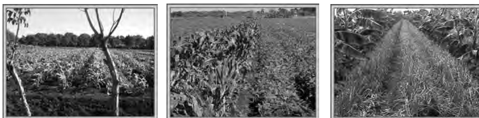
Figura 7.1. Ejemplos de intercalamientos de cultivos.

Asociar e intercalar cultivos no es más que la siembra de más de un cultivo en el mismo espacio; es decir, un campo, una parcela, un cantero, etc. (figura 7.1). Sin embargo, hay que tener mucho cuidado con la tendencia a asociar e intercalar cultivos sin un criterio técnico, porque se puede favorecer el desarrollo de ciertos organismos causales de plagas.