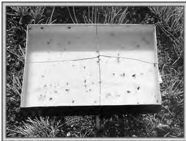
Figura 8.7. Bandejas amarillas para la captura de adultos de pulgones. Observe que en su interior se pinta de amarillo y en el exterior de negro. La trampa se coloca sobre un pedestal para separarla del suelo.

Pancartas o tableros engomados. Generalmente se construyen de material resistente a la lluvia y el sol. Se pintan de colores que atraigan los insectos de interés y se recubre de un pegamento. Se coloca en sitios convenientes en los campos (figura 8.8).