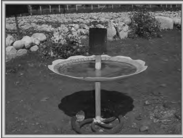
Figura 8.3. Trampa rústica de mechón (fibra impregnada de petróleo dentro de un recipiente de metal) y fondo de metal debajo para la captura de adultos de lepidópteros en un organopónico de la agricultura urbana.

8.3) o un neumático cortado en el medio, donde se coloca la solución de melaza u otra que atraiga y capture los adultos. Muy utilizadas para atraer poblaciones de adultos de lepidópteros en pastos y otros cultivos.