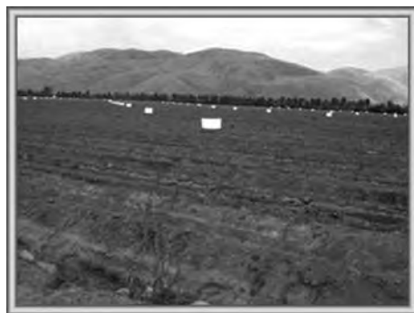
Figura 8.8. Muestra de una trampa de tablero engomado. Izquierda: color amarillo para la captura de moscas blancas y otros; derecha: color blanco para capturar thrips.

Melaza. Se utilizan recipientes de cualquier tipo, los que pueden colocarse sobre el suelo o mediante un pedestal (figura 8.9). Son efectivas para atraer y capturar diferentes insectos que son atraídos por los olores de la melaza.