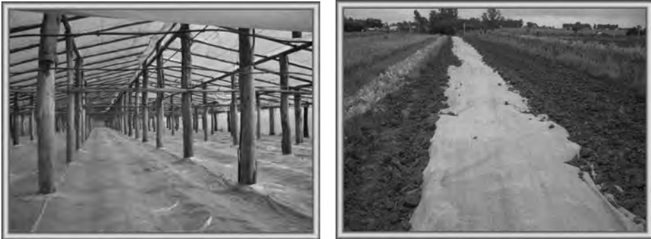
Figura 6.3. Solarización del suelo en una casa de cultivo para reducir poblaciones de plagas del suelo (nemátodos, hongos fitopatógenos y arvenses).

Una alternativa evaluada y con grandes posibilidades para casas de cultivo, parcelas pequeñas, canteros, sustratos para bolsas, etc. es la solarización del suelo o el sustrato, que se basa en atrapar la energía calórica procedente de los rayos solares, mediante una lámina de polietileno (nylon) transparente que se deposita sobre un suelo (figura 6.3), acantarado y previamente humedecido.