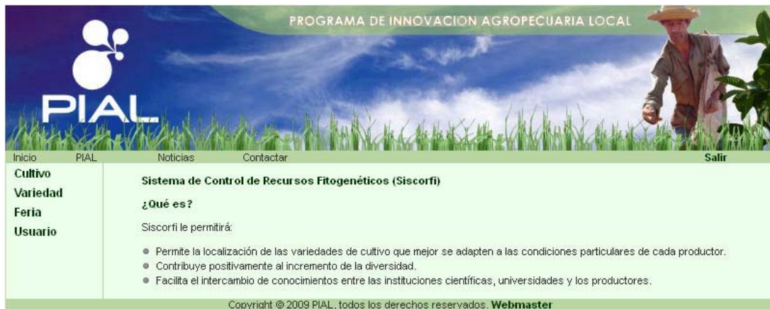
Figura 1. Pantalla inicial del sitio