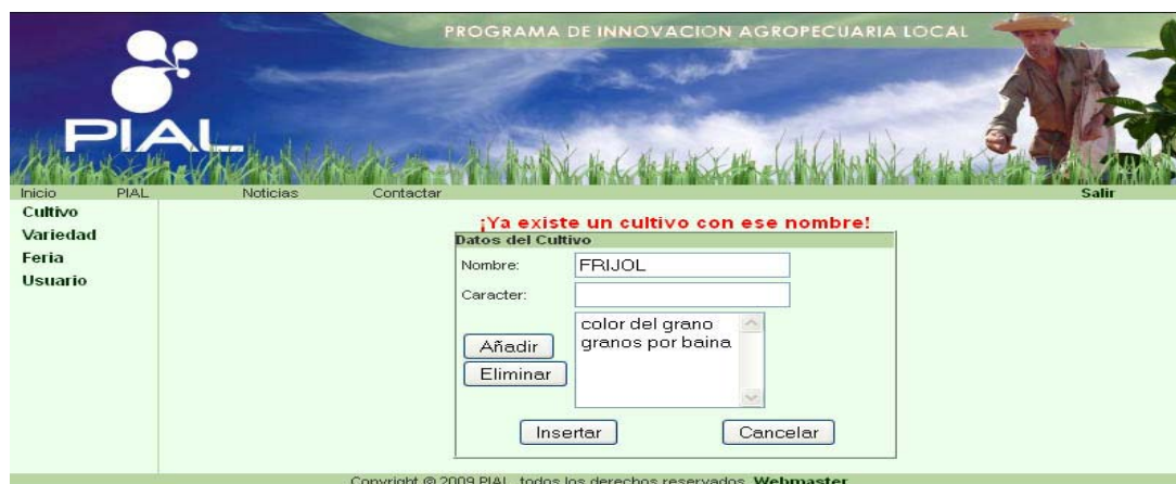
Figura 5. Mensaje de error de duplicación de información