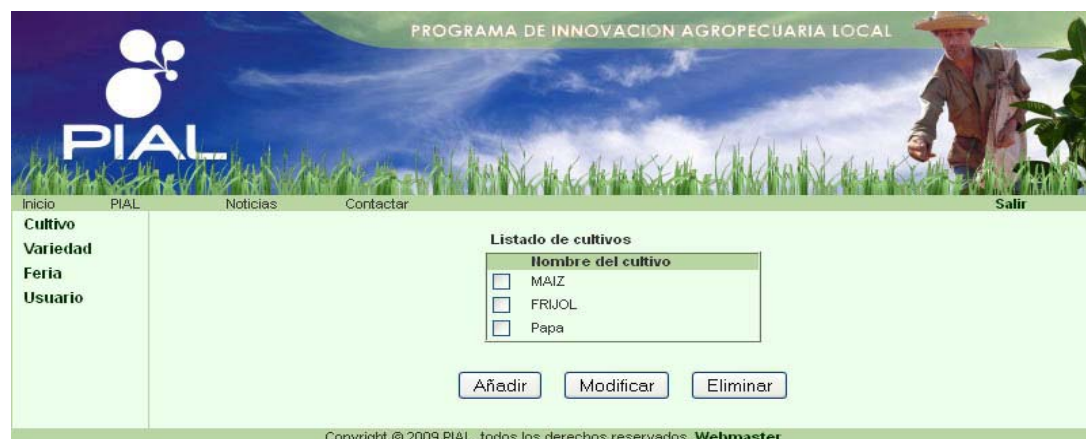
Figura 2. Pantalla de reporte de cultivos