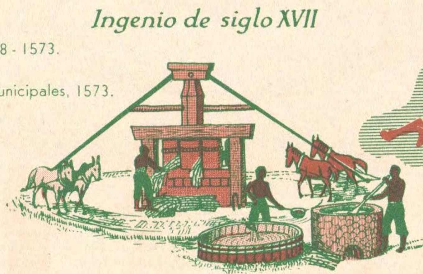
Ingenio de siglo XVII

Primeros ingenios. La Habana "ciudad". Se inaugura el primer acueducto, 1592. Casi terminados "El Morro" y "La Punta".