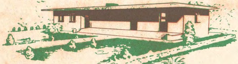
Más de 600 escuelas rurales funcionan en casas construidas recientemente.

of school age attend primary schools, while in Camagüey the percentage is 36 and in Oriente only 34. The diagram below shows that a vast percentage of children attending public schools in Cuba do not complete their studies; only 10 per cent of all first grade pupils receive their diplomas after the sixth grade. In rural areas many children leave school at an early age to help their parents in the fields. In urban centers, although many children go to work, others leave the primary school to enter preparatory schools for secondary or vocational education centers.