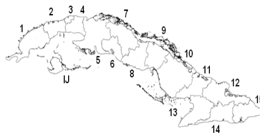
Figura 1. División político-administrativa actual. Provincias: 1, Pinar del Río; 2, Artemisa; 3, La Habana; 4, Mayabeque; 5, Matanzas; 6, Cienfuegos; 7, Villa Clara; 8, Sancti Spiritus; 9, Ciego de Ávila; 10, Camagüey; 11, Las Tunas; 12, Holguín; 13, Granma; 14, Santiago de Cuba; 15, Guantánamo; IJ, municipio especial Isla de la Juventud.

En la lista se relaciona primero el nombre actualizado de la especie según PECK (2005), la provincia en mayúsculas sostenidas, separada por una coma del municipio con mayúscula inicial, después la localidad, en el caso que esta no estuviera incluida en la etiqueta aparece como: “sin localidad precisa”, a continuación entre paréntesis se da el número de ejemplares (ej.) para esa localidad, seguido por la fecha y el o los recolectores, así como otros datos adicionales que estuvieran incluidos en la etiqueta. Los nombres de la localidad, provincia y municipio se refieren según la división político-administrativa actual (GACETA OFICIAL DE LA REPÚBLICA DE CUBA, 2010) (Fig. 1).