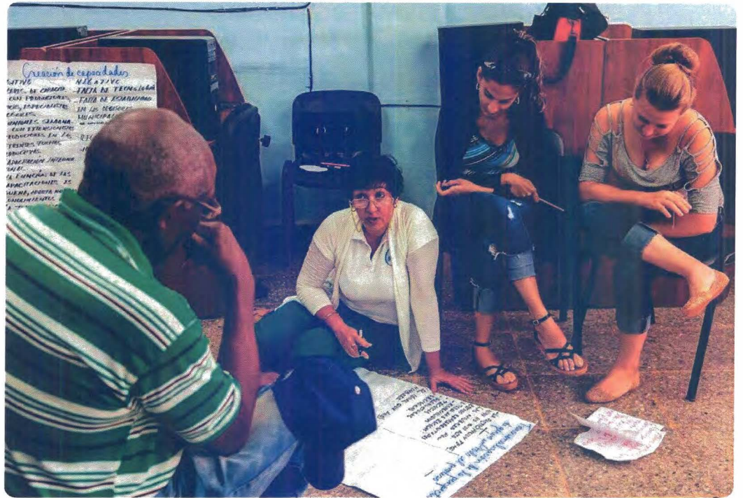
Taller de sistematización en en Güira de Melena.