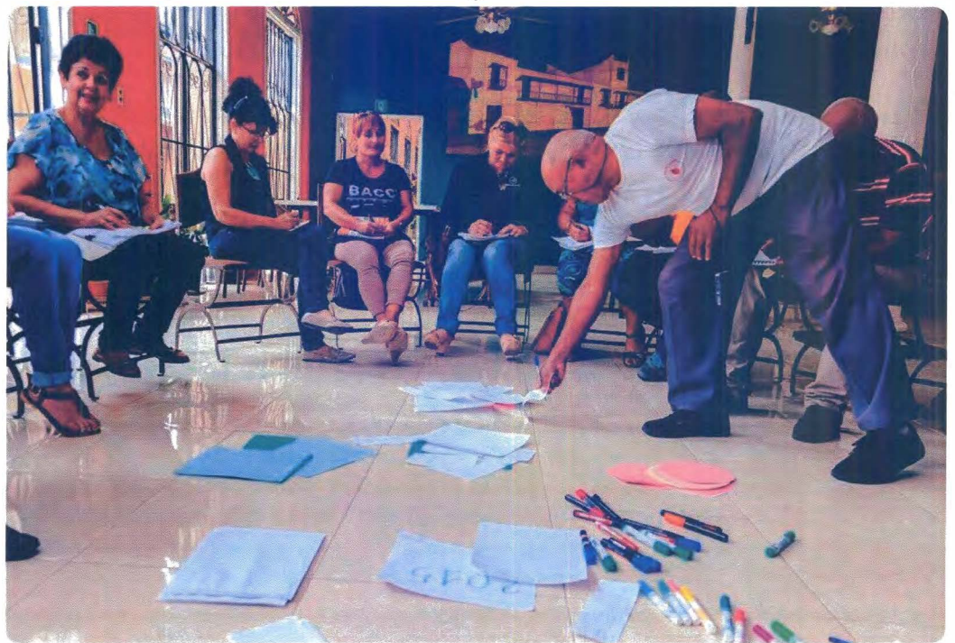
Taller de sistematización en Jimaguayú.