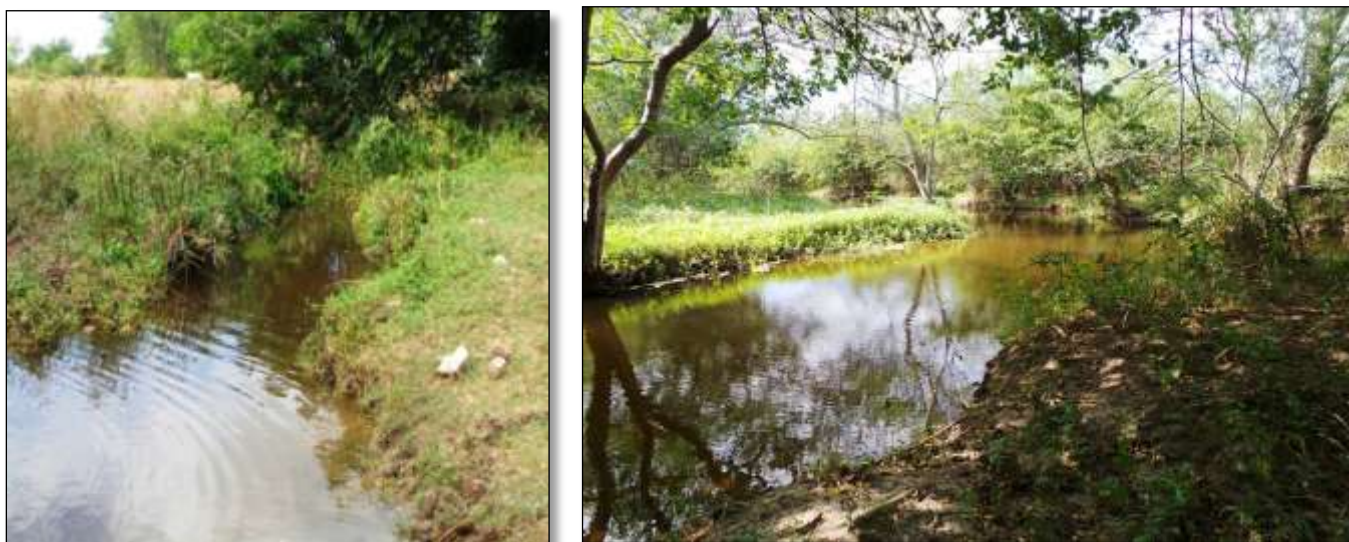
Figura 7: Afectación de los Bosques de Galerías por invasión de especies exóticas en CCSF "Cuba Va". Majibacoa, Las Tunas.

Por otra parte la vegetación del bosque de galería está en muy malas condiciones, con muy pocos representantes de la vegetación natural e invadido por marabú, inga dulce y paragüito chino.