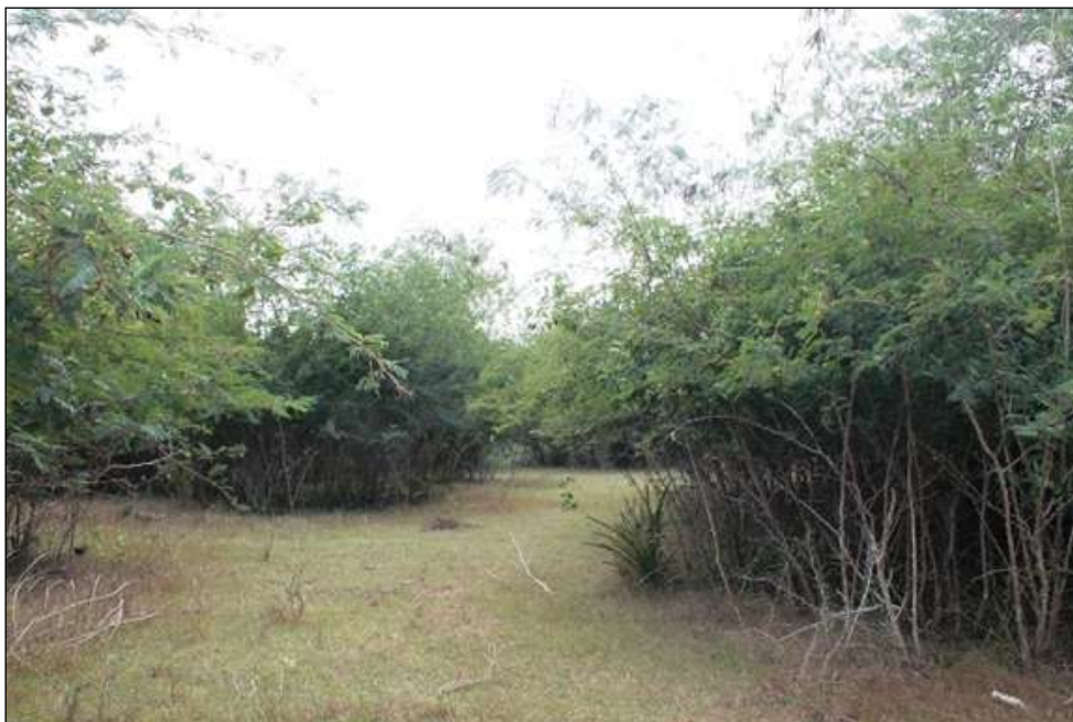
Figura 5: Afectación de la CCSF "Cuba Va". Majibacoa, Las Tunas por especies exóticas invasoras.

Se inventariaron 53 taxones, pertenecientes a 33 familias botánicas, 24 especies exóticas y de ellas 18 consideradas como especies exóticas invasoras, para un 34 % de la flora inventariada, destacándose: Pithecellobium dulce (Inga dulce), Dichrostachys cinerea (marabú). En este sitio resalto la influencia negativa del Inga dulce provocando daños importantes en las zonas de cultivos y la imposibilidad de los campesinos en muchos casos de poder talar individuos adultos de esta especie por ser un recurso de la Empresa Forestal.