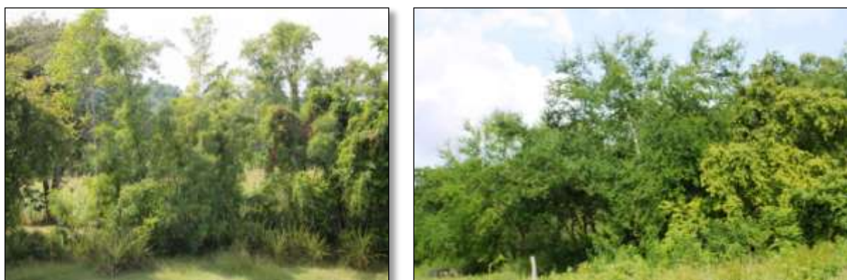
Figura 2: Especies exóticas invasoras presentes en CCSF “René Muñoz”, Horno de Guisa, Granma