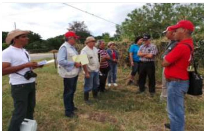
Figura 1: Visita diagnóstico a Fincas sitios demostrativos del Cpp OP15 en Cuenca del Cauto: CCSF General Ramos “El Horno”. Bayamo, Granma.