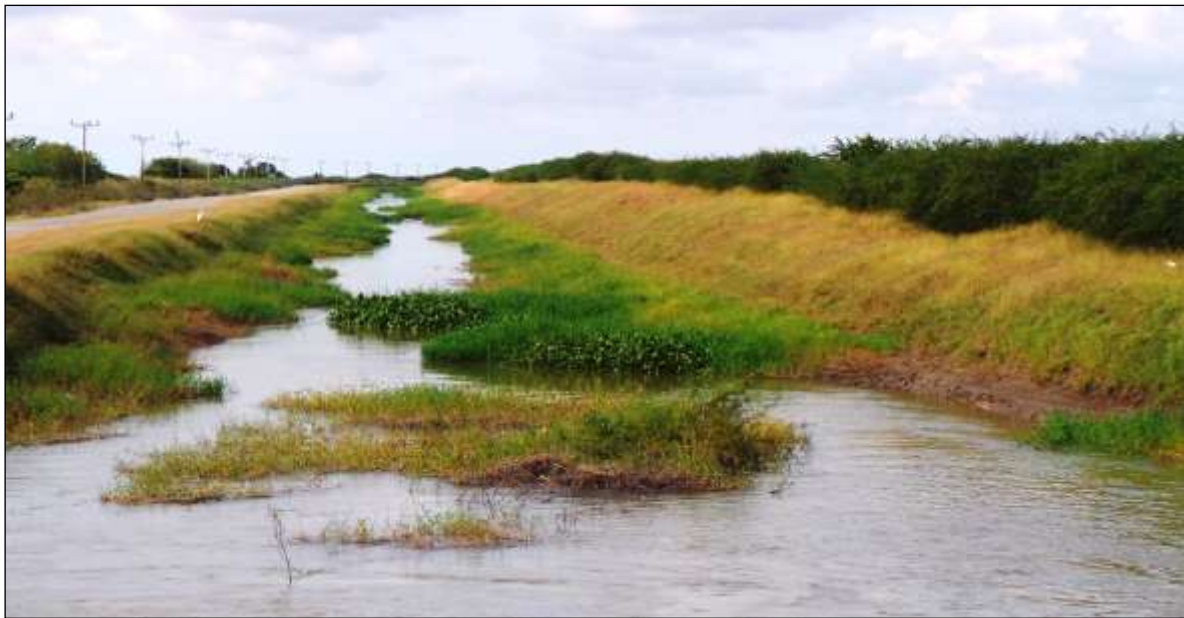
Figura 3: Canal infestado de Eichhornia crassipes en CCSF Hermes Rondón "Vado del Yeso", Río Cauto, Granma.