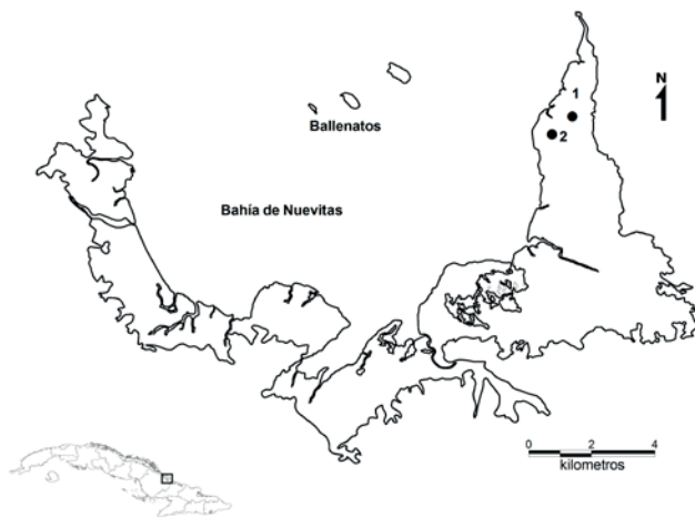
FIGURA 1. Ubicación geográfica de la colonia reproductiva de Flamenco del Caribe ( Phoenicopterus ruber ) en el humedal Boca Grande, Refugio de Fauna Cayos Ballenatos y Manglares de la Bahía de Nuevitas, Cuba. 1: 2017 y 2: 2018.

El regreso de los flamencos al humedal Boca Grande es un indicador de la efectividad del manejo que se realiza en el mismo. También refuerza los valores de este ecosistema, para la conservación del Flamenco, al poder utilizar a dicha especie como especie sombrilla y proteger este humedal y el resto de las aves acuáticas que lo habitan.