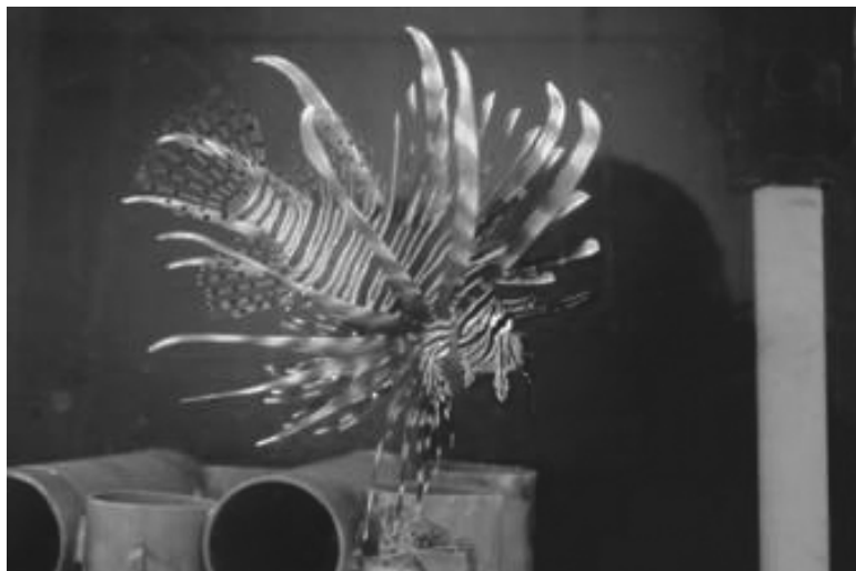
Fig. 2. Pez león ( Pterois volitans ) en las instalaciones del Acuario Nacional de Cuba.