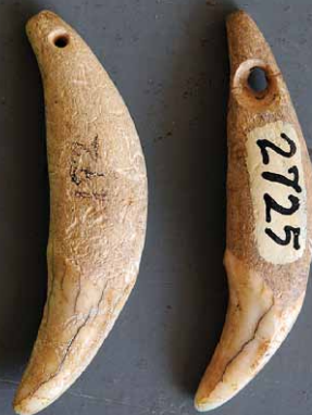
FIGURA 16. Dientes de perro perforados para colocar en collar. A. Sin localidad. B. Barrio Este, Banes, Holguín. INSTITUTO DE ECOLOGÍA Y SISTEMÁTICA No. 2160 Y 2725.

El conocido perro mudo, llamado "Aon" por los aborígenes, fue representado elegantemente en cerámicas nativas cubanas. Cerámicas utilitarias como asas de vasijas y morteros, así como pequeños ídolos, tienen representaciones que pueden ser consideradas perros (FIGS. 10, 11, 12, 13, 14 Y 15). Además, los dientes de perro fueron usados como cuentas y ornamento de collares (FIG. 16).