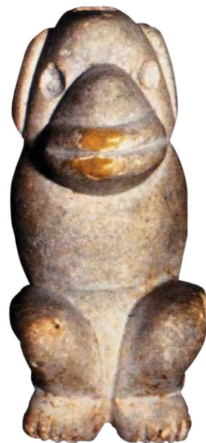
FIGURA 15. Ídolo aborigen con forma de perro, procedente de un sitio arqueológico de Guantánamo. MUSEO PROVINCIAL DE GUANTÁNAMO.