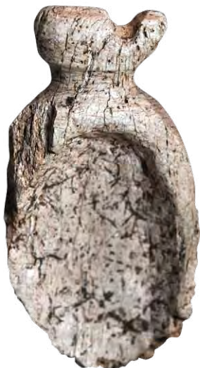
FIGURA 20. Espátulas vómicas y fragmentos de éstas con figuras antropomórficas talladas sobre huesos de manatí. Localidad Banes, Holguín. COLECCIÓN MUSEO ANTROPOLÓGICO MONTANÉ Y ÚLTIMA PIEZA, GABINETE DE ARQUEOLOGÍA.