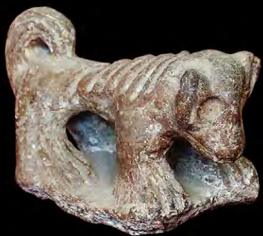
FIGURA 10. Asa con representación del perro mudo. Sitio arqueológico Varela 3, Punta de Mulas, Banes, Holguín.