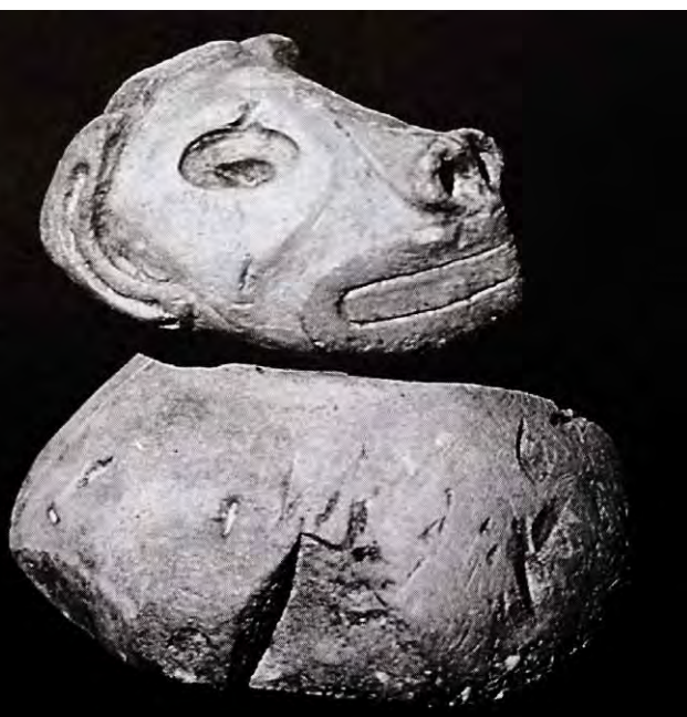
FIGURA 12. "Dios perro", figura esculpida sobre una mano de mortero encontrado en Cueva de Alcalá, Holguín, Cuba.