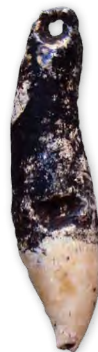
FIGURA 27. Diente de delfín con perforación en la base de la raíz con un posible uso como colgante. Localidad Solapa Alta, El Charcón, Municipio Corralillo, Villa Clara. PIEZA S/N, COLECCIÓN ARQUEOCENTRO SAGUA LA GRANDE. COLABORACIÓN DE LORENZO MORALES SANTOS.

En resumen, a través del arte aborigen podemos adentrarnos en el desarrollo cultural de aquellas sociedades y en cierta medida estimar la evolución alcanzada por su conciencia religiosa. La amplia presencia de representaciones de mamíferos es expresión de la importancia y significación que tuvo este grupo animal para la vida económica, cultural y espiritual de nuestras poblaciones humanas antiguas. Estas representaciones artísticas antiguas constituyen un legado patrimonial de invaluable valor y que debemos proteger para las presentes y futuras generaciones.