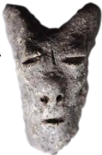
FIGURA 11. Asas de cazuelas de arcilla con cabeza de perro de la cultura sub-taína. A. Barrio Delicia, Santa María 2, Puerto Padre, Las Tunas, COLECCIÓN CENTRO DE ANTROPOLOGÍA, No. 4804. B. COLECCIÓN MUSEO ANTROPOLÓGICO MONTANÉ.