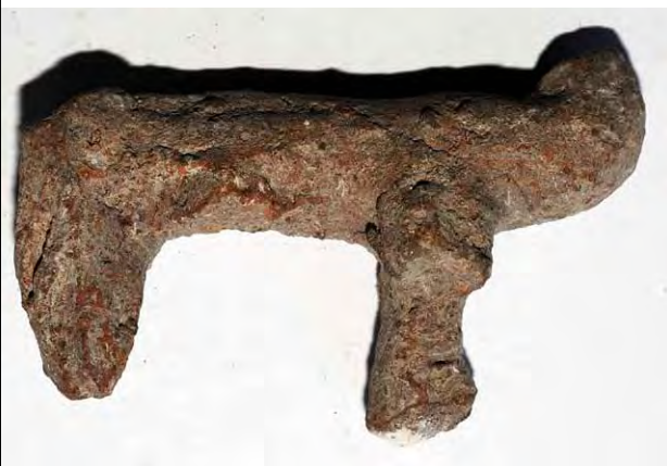
FIGURA 14. Fragmento de un ídolo de arcilla en forma de perro, tres de las patas y las orejas perdidas. Manzanillo, Granma. COLECCIÓN CENTRO DE ANTROPOLOGÍA, No. 1369.