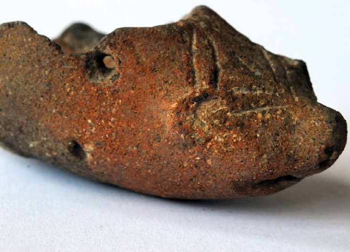
FIGURA 25. Asa de cazuela taína con la representación de un rostro que pudiera ser interpretado como de foca o de delfín. COLECCIÓN DEL MUSEO DE HISTORIA NATURAL DE LA HABANA.