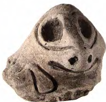
FIGURA 23. Cabeza de manatí. Nótese la representación de la aleta pectoral. COLECCIÓN CUBA DEL MUSEO DEL INDIO AMERICANO, NUEVA YORK. COLABORACIÓN DE DANIEL TORRES.

La foca tropical ( Monachus tropicalis ) fue una especie conocida por los aborígenes cubanos. Existe el reporte de dos incisivos superiores laterales empleados en la elaboración de aretes como piezas cónicas para ser colgadas en las orejas; éstos proceden de Cueva de la Pluma, provincia de Matanzas.