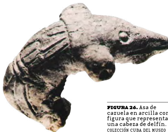
FIGURA 26. Asa de cazuela en arcilla con figura que representa una cabeza de delfín. COLECCIÓN CUBA DEL MUSEO DEL INDIO AMERICANO, NEW YORK. COLABORACIÓN DE DANIEL TORRES.

Entre los mamíferos marinos, los delfines también fueron representados en la cerámica como asas de cazuelas (FIGS. 24, 25 Y 26) y sus dientes fueron utilizados para cuentas de collares (FIG. 27).