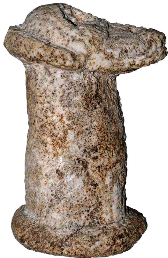
FIGURA 13. Figura de un posible perro esculpido sobre mano de mortero taíno. COLECCIÓN MUSEO ANTROPOLÓGICO MONTANÉ.