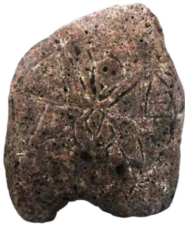
FIGURA 19. Representaciones taínas de figuras de murciélagos tallados sobre guijarros planos. Santiago de Cuba. COLECCIÓN MUSEO BACARDÍ, SANTIAGO DE CUBA.