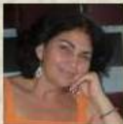
Editorial de la Directora

En las sociedades actuales influyen decisivamente el desarrollo científico y tecnológico, que llegan a tocar todos los aspectos de la vida del ser humano: la salud, la alimentación, la vivienda, el transporte, las comunicaciones, el trabajo, la economía, el ambiente y el entretenimiento. Sin embargo, la ciencia aún no es parte de la cultura ciudadana.