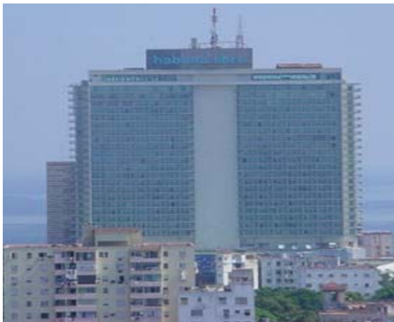
Figura No. 6