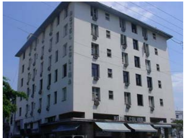
Figura No. 7