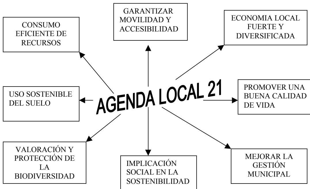
Figura 1 Principios Básicos de las Agendas 21 locales

- Plan de acción y plan de seguimiento para buscar la Continuidad del proceso mediante el uso de indicadores ambientales