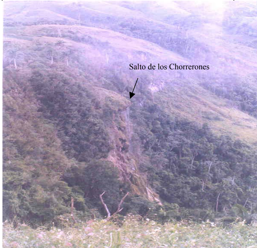
Vista panorámica del Salto de los Chorrerones desde el Tope del Nene