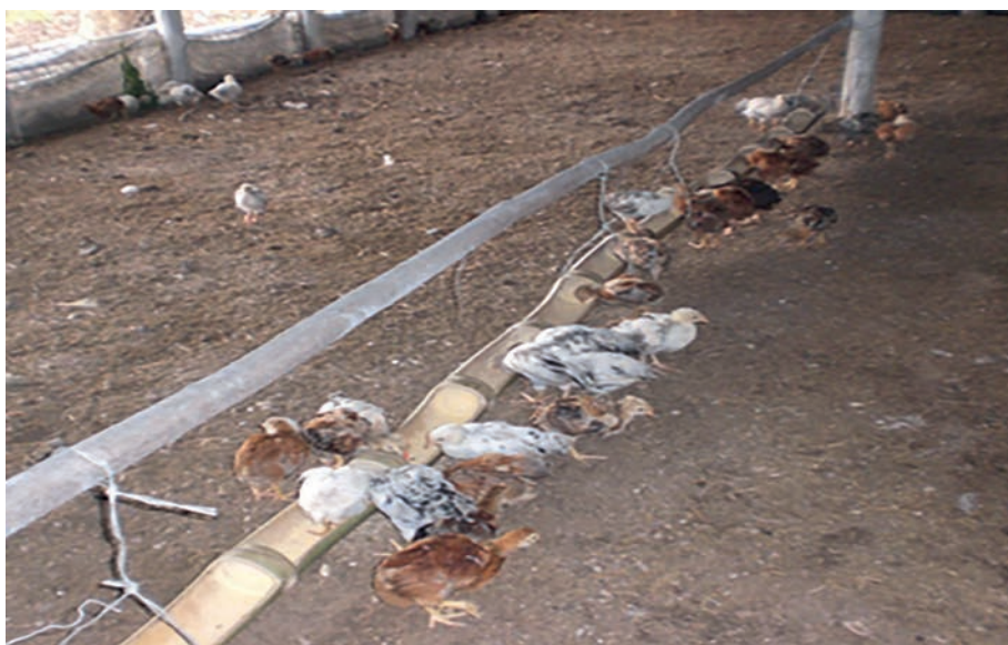
Figura 4. Administración dérmica y oral a dosis única del extracto de frutos de Cordia collococca