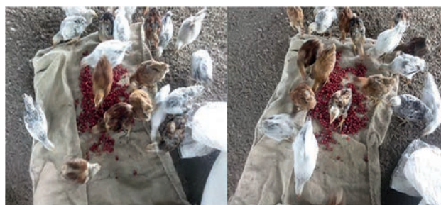
Figura 2. Pollos camperos de 34 días picoteando ateje en mantas de saco