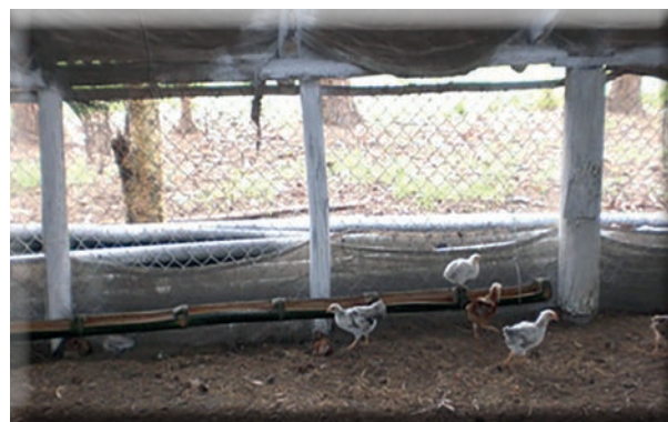
Figura 1. Pollos camperos de 34 días picoteando ateje en el comedero

En el periodo de adaptación las aves reconocen el fruto de Cordia collococca en las primeras horas de ofrecido el alimento, logrando una familiarización con el mismo. No se observó rechazo de alimento, al día siguiente no se recogió resto de alimento, se le suministró 5,5 kg por grupo diariamente.