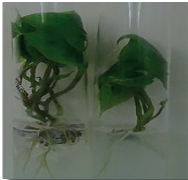
Figura 3. Desarrollo vegetativo de las plantas in vitro de ñame clon 'Blanco de guinea' a los 35 días en fase de micropropagación, procedentes del medio de cultivo MS 75 % con 6 \text{ mg L}^{-1} de Pectimorf® (izquierda) y el tratamiento control (derecha)

lo cual puede ser atribuido a su marcado efecto biorregulador de los procesos de desarrollo vegetativo de las plantas en condiciones in vitro y ex vitro .