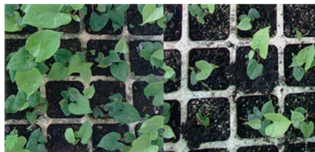
Figura 4. Plántulas de ñame clon 'Blanco de guinea' a los 45 días en fase de aclimatación, procedentes del medio de cultivo MS 75 % con 6 \text{ mg L}^{-1} de Pectimorf® (izquierda) y el tratamiento control (derecha)