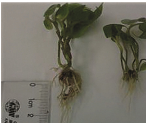
Figura 1. Desarrollo vegetativo significativo de las plantas in vitro del ñame clon 'Blanco de guinea' en el medio de cultivo con Pectimorf® a razón 6 mg L -1 (Izquierda, Tratamiento 2) con relación al control sin Pectimorf® (Derecha, Tratamiento 6)

También se han observado beneficios al cultivo como la promoción del enraizamiento, el incremento de brotes, así como resultados beneficiosos en el estadio de adaptación ex vitro (7).