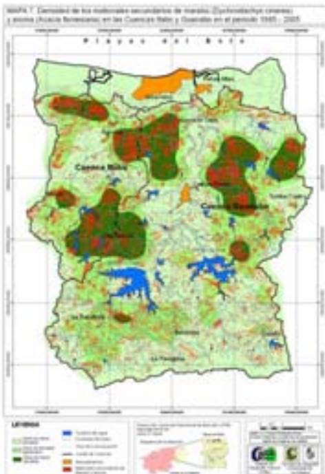
Fig.3 Áreas de mayor densidad de los matorrales de marabú ( Dychrostachys cinerea ) y aroma ( Acacia farnesiana ) en e período 1985-2005.

Mediante el análisis espacial utilizando los SIG fue posible representar aquellas áreas de mayor densidad de matorrales secundarios de marabú y aroma para el año 1985 y 2005, a partir de la generación de modelos de densidad para esos años. A fin de facilitar una mejor visualización de la expansión que han tenido en el período estudiado, así como de su localización espacial en las cuencas Itabo y Guanabo. La resta de los modelos de densidad del año 2005 y 1985 generó un tercer mapa que representa las áreas de mayor densidad en las cuencas durante el período 1985-2005. (Fig 3) .En el mismo se distinguen 6 zonas de manera general donde la concentración de matorrales secundarios de marabú y aroma es significativa en comparación con las del resto de las cuencas, dos de ellas se localizan en la cuenca Itabo y las otras cuatro en la cuenca Guanabo.