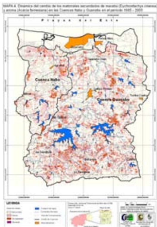
Fig.2 Dinámica de cambio de los matorrales de marabú ( Dichrostachys cinerea ) y aroma ( Acacia farnesiana ) en e período 1985-2005.