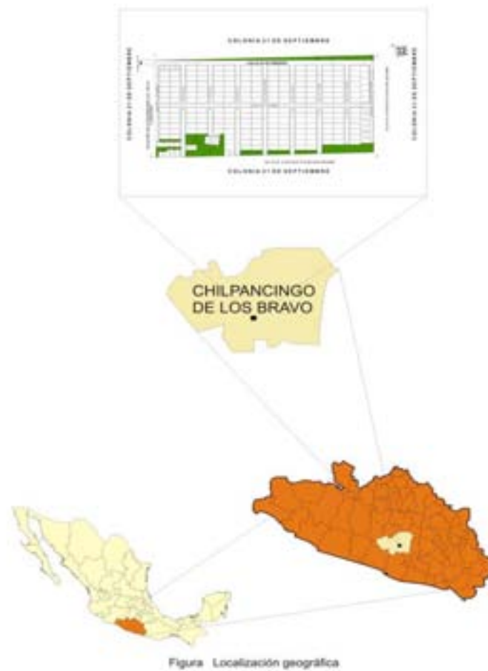
Figura 1 Localización de la zona en estudio.

La colonia 21 de septiembre se encuentra al noroeste de la ciudad de Chilpancingo, justo después de las líneas de alta tensión de la Comisión federal de Electricidad (CFE). Esta colonia es tan reciente y su proceso de regularización ha sido tan paulatino que incluso ahora no se cuenta registrada en los planos del Instituto Nacional de Estadística, Geografía e Informática (INEGI).