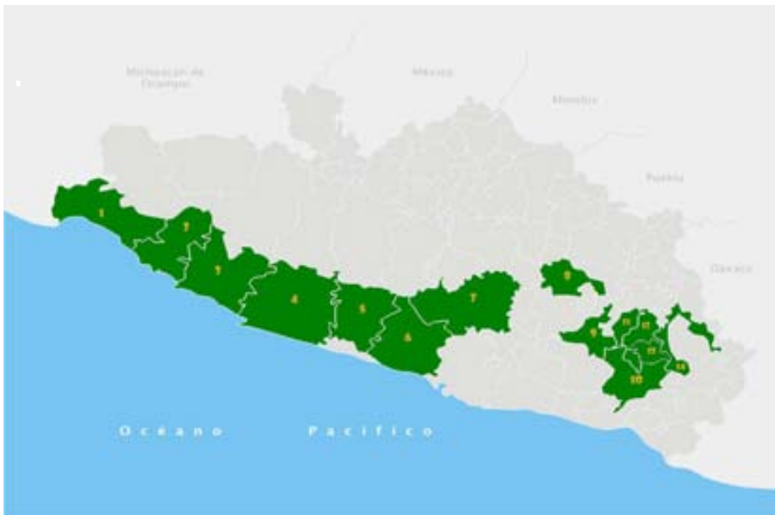
Figura no. 2

Actualmente la producción de café acusa una disminución importante comparada con la producción de hace cuarenta años cuando el Inmecafé tenía a su cargo la comercialización del grano y los productores estaban organizados en UEPC no tanto por que hubiesen adquirido la cultura de la organización para obtener un valor agregado de su producto, sino más bien con el fin de obtener los beneficios de la institución como los anticipos de cosecha, asesoría técnica, entre otros. En la actualidad, al no existir un organismo que adquiera de primera mano el producto, la comercialización es dispersa y desorganizada.