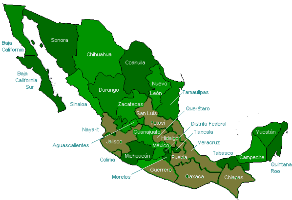
Entidades Federativas productoras de café

Entre los rasgos sociales y económicos que caracterizan a este sector productivo destacan los relativos a la carencia de infraestructura sólida, ausencia de tecnología, uso intensivo de mano de obra, la pobreza extrema de los campesinos (el 66% de los productores habla al menos una lengua indígena) y que las plantaciones se encuentran ubicadas en zonas de difícil acceso (AMECAFE, 2008). Otra característica no menos importante es la atomización de la tierra (1.38 ha/productor) derivada de la costumbre de