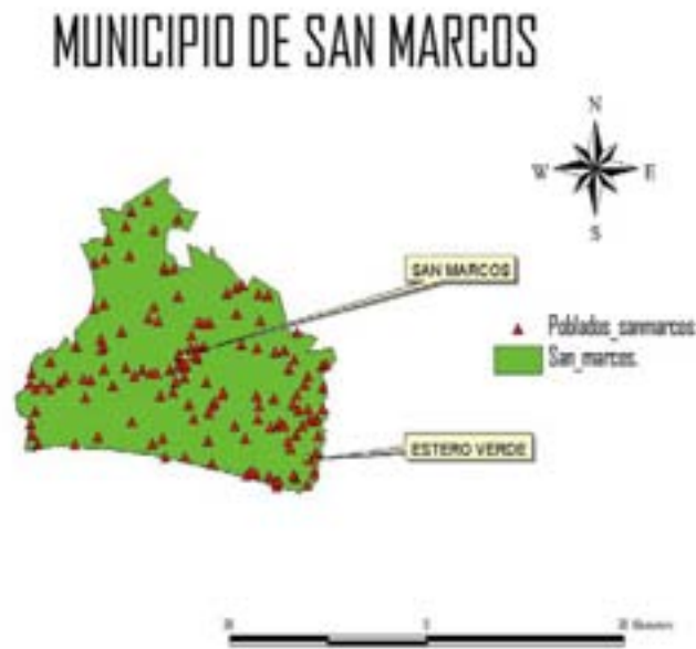
Mapa 1. Ubicación de la localidad de estudio en el Municipio de San Marcos, Guerrero.