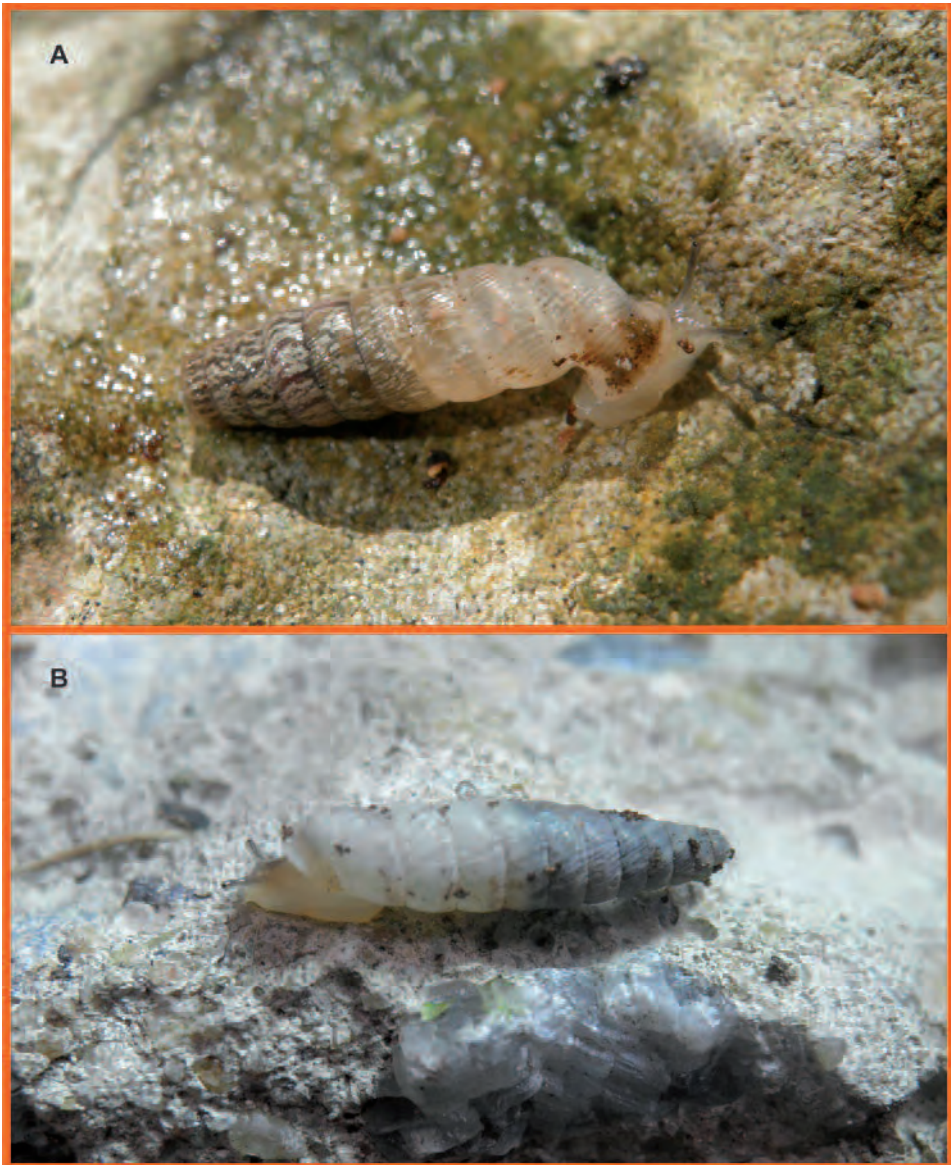
Lámina 3.- Fotos de las dos especies en vida del género Cochlodinella . (A): Cochlodinella pinera de Carapachibey. (B): Cochlodinella pirata de la Reserva Ecológica Punta del Este.