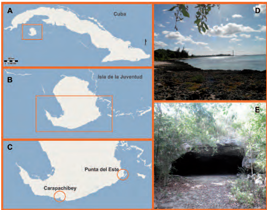
Lámina 1.- (A): Mapa de Cuba. (B): Mapa de la Isla de la Juventud. (C): Localidades tipo de las dos especies del género Cochlodinella . (D): Faro en Carapachibey. (E): Cueva en Punta del Este.

Descripción: Concha de tamaño mediano, de forma cilindro cónica, alargada y estrecha (Id= 4,73) cuando pierde la protoconcha y primeras vueltas de la teleoconcha. Protoconcha