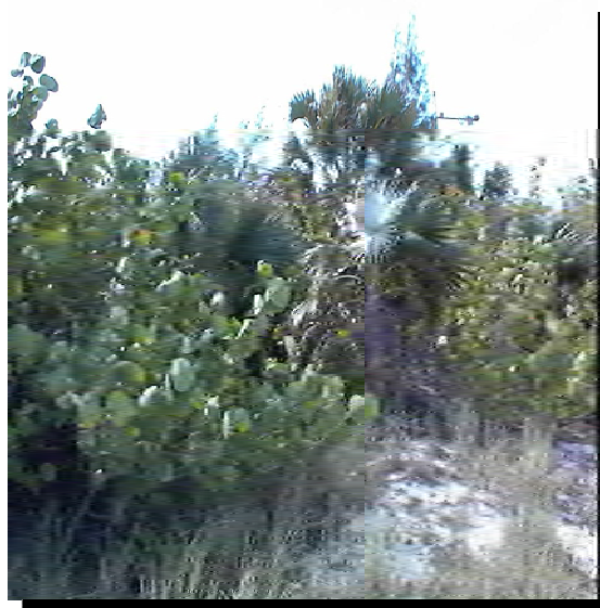
Vegetación de costa arenosa