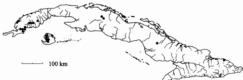
Mapa 2. Drosera capillaris Poir.