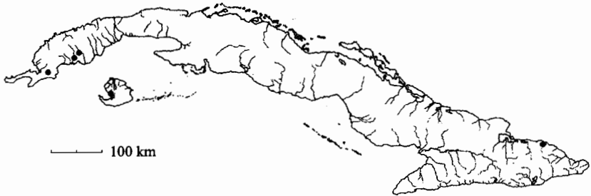
Mapa 1. Drosera intermedia Hayne

Ejemplares examinados: Cuba Occ.: Clemente, Nestor, Chrysogone 6164 (HAC), Ekman 11234 (S), León & Killip. 9489 (HAC), P.F.C. 48519 (HAJB), 51012, 51014 (HAJB, JE), Wright 1899 (HAC, S), Misión Rusa 39, 40 (HAC). Cuba Or.: Acuña 12427, Bucher 11052, 11404 (HAC).