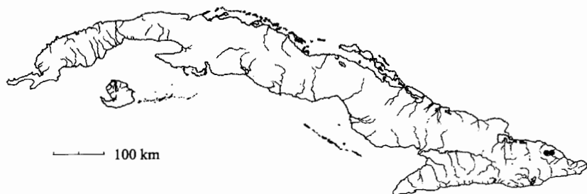
Mapa 4. Drosera moaensis C. Panfet

Ejemplares examinados: Cuba Or.: Bisse & Lippold 11298 (HAJB, JE), P.F.C. 40025, 44644 (B, HAJB, JE), 42391, 42718, 55593, 56410 (HAJB, JE), 56351 (HAJB)