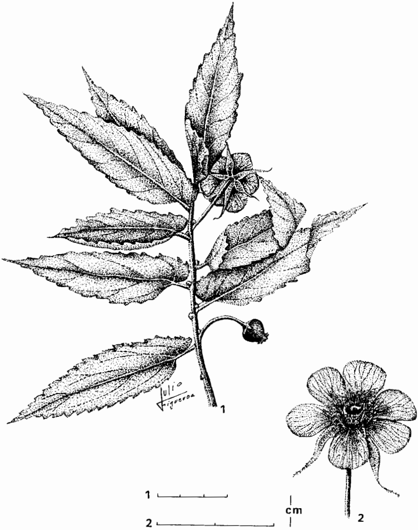
Figura 2. Muntingia calabura L. 1. Rama; 2. Flor.