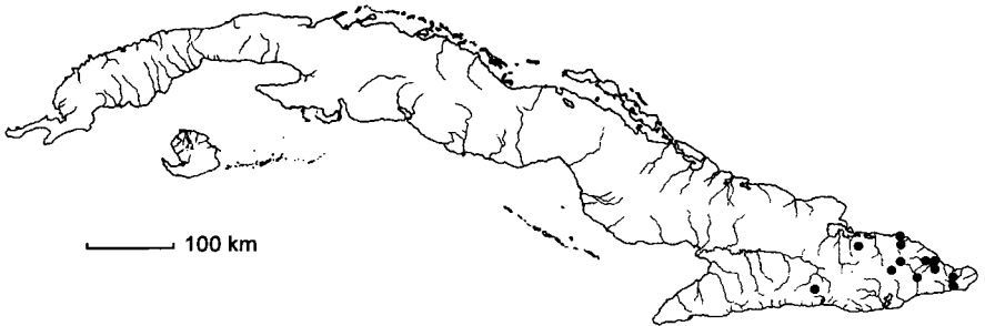
Mapa 2. Sloanea curatellifolia Griseb.

Distribución: Endémica, Cuba oriental: Ho, SC, Gu en la vegetación de bosque pluvial montano. Prefiere suelos derivados de roca ignea entre los 200 y 600 msm. – Mapa 2.