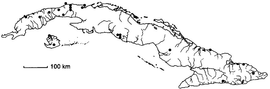
Mapa 3. Muntingia calabura L.

Distribución: De México a Colombia incluyendo las Antillas. En Cuba occidental: PR, Hab, C Hab, Mat, IJ, Cuba central: Ci, SS, Cam, LT y Cuba oriental: Ho, SC, Gu, como componente de la vegetación secundaria.