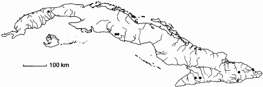
Mapa 1. Sloanea amygdalina Griseb.

Ejemplares examinados: Cuba Occ.: Acuña 24048 (HAC), Bisse 15556 (HAJB, JE), Fors 54, 4364, 4363 (HAC), León 13471 (HAC), León & Roig 15984, 6397 (HAC), P.F.C. 49021 (HAJB, JE), Roig 4363 (HAC). Cuba Centr.: Bisse & Lippold 19720 (HAC, HAJB), 19726 (HAC, HAJB, JE), Risco 27328 (HAC). Cuba Or.: Bucher 5332, 5522 (HAC), Curbelo 5640, 15014 (HAC), León & Ekman 10986 (HAC), P.F.C. 40373 (B, HAJB, JE).