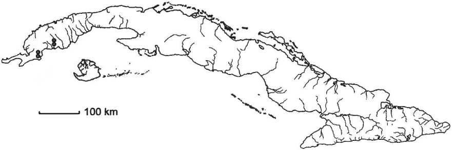
Mapa 5. Myriophyllum sparsiflorum C. Wright.

Distribución: Endémico en Cuba occidental: PR (sur de Sandino y Guane; laguna de Santa María en San Luis; Pinar del Río). En charcos o lagunas. Sólo se conocen escasas colectas, todas anteriores a 1942 y de lugares muy antropizados, por lo cual es probable que la especie se haya extinguido. – Mapa 5.