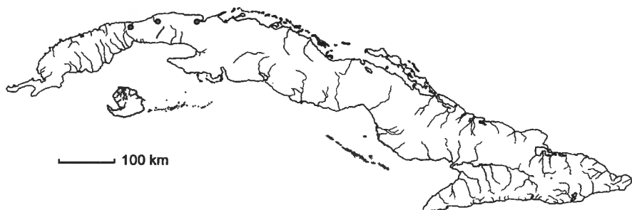
Mapa 4. Myriophyllum pinnatum (Walter) Britton & al.

Distribución: Estados Unidos de América y Cuba. Presente en Cuba occidental: Hab (Presa La Coronela), C Hab (Calabazar en la Estación Experimental Agronómica de Santiago de las Vegas), Mat (Río San Agustín). En lagunas, ríos y estanques, mayormente sobre lechos calizos. – Mapa 4.