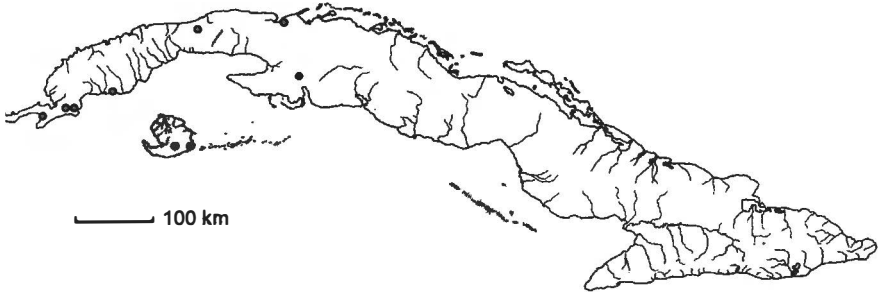
Mapa 1. Proserpinaca palustris L.

Lóbulos del cáliz aovados a deltoideos, obtusos o agudos, de 0,5 mm de largo. Fruto trígono-urceolado o piramidal, hasta 0,5 cm de largo y 0,4 cm de ancho. – Fl. y Fr.: V-VI.