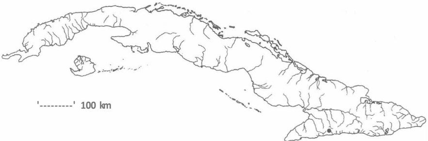
Mapa 3. Marathrum utile Tul.

Hierbas acuáticas, de hasta 35 cm de largo. Tallo corto, de 1-2 cm de largo. Hojas de 3-35 cm de largo y 1-6 cm de ancho, cuando jóvenes enteras y espatulado-cuneadas, posteriormente lobuladas, con venación reticulada o dicótoma; lámina gradualmente estrechada hacia la base; pecíolo no claramente diferenciado. Flores solitarias o en fascículos; espatela de 2-2,5 mm de largo; pedúnculos de 1-4 cm de largo, expandidos distalmente y formando una corta y ancha cúpula. Perianto de 5-8 piezas de hasta 2 cm de largo. Estambres de 2-2,5 mm de largo; anteras de 1-1,5 mm de largo. Ovario de 2-4 mm de largo, elipsoidal a ovoide; estilo de 1,5-2 mm de largo. Fruto de hasta 4 mm de largo, elipsoidal, con costillas longitudinales conspicuas. Semillas pequeñas y numerosas.