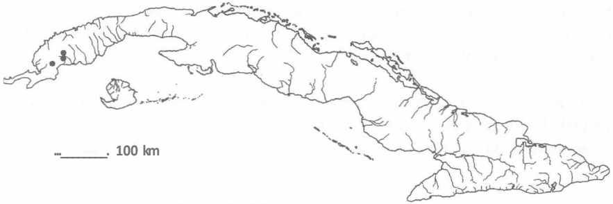
Mapa 2. Marathrum cubanum C. Wright.

Distribución: Endémica en Cuba occidental: PR (San Sebastián; Ratonés; Los Portales). En los ríos.