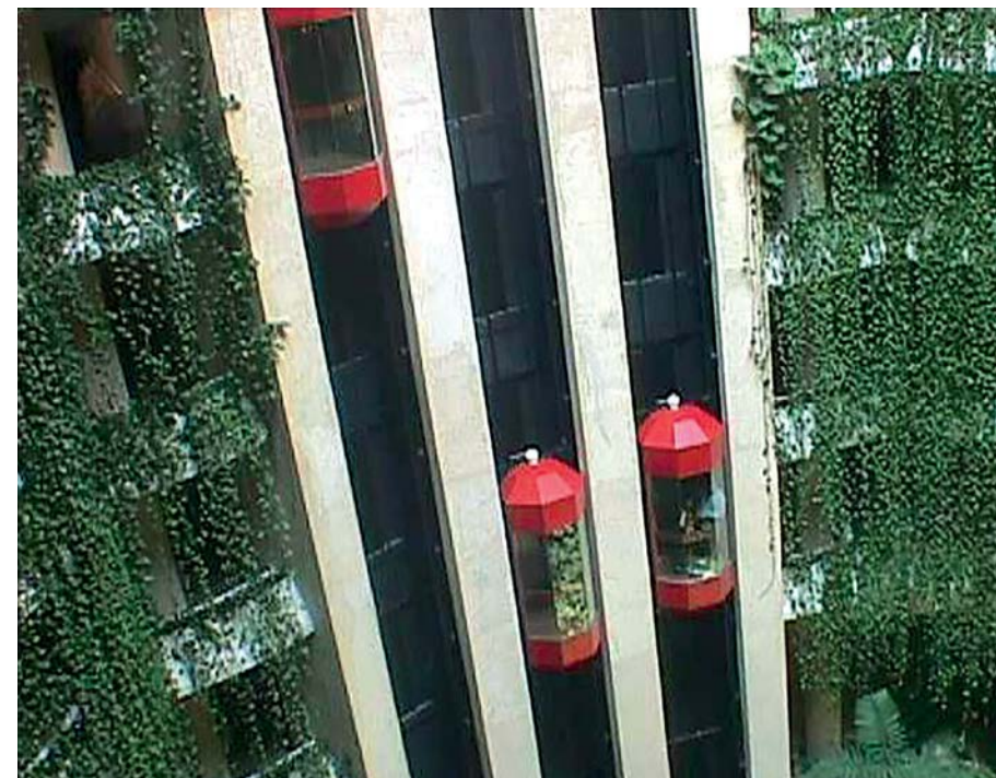
Figura 10. Jardineras con plantas colgantes, un estilo de los hoteles Meliá en Cuba.