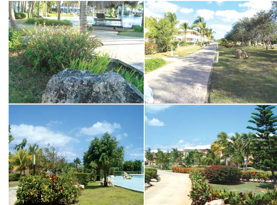
Figura 5. Jardines de varios hoteles en Varadero donde el estilo y las especies son muy semejantes.