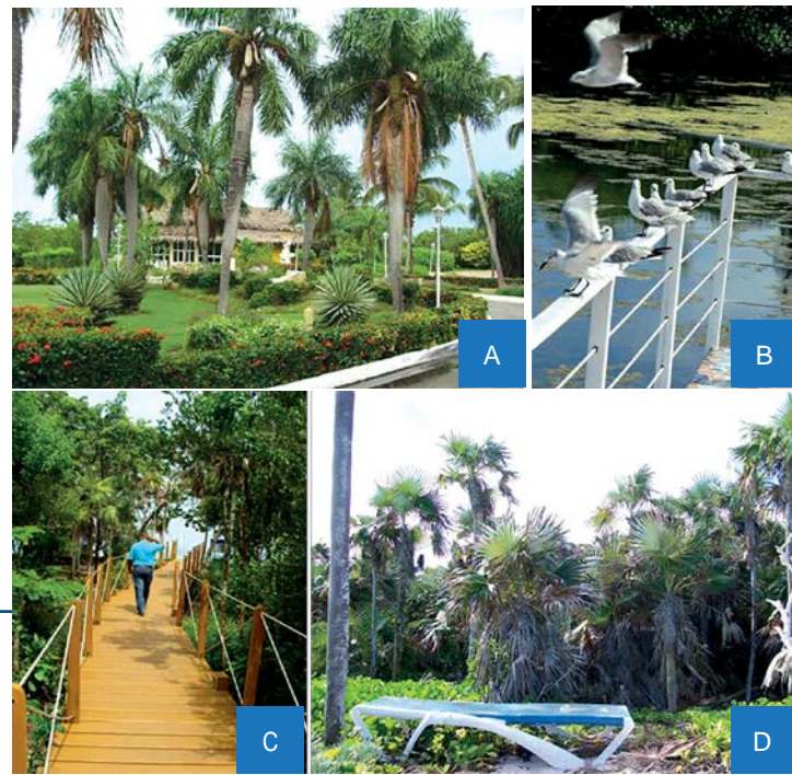
Figura 8. Incorporación creativa y funcional de espacios con valores naturales de la flora y fauna local en diferentes hoteles ubicados en el ASC. / A. Conjunto de palmeras de corojos adornan la entrada del hotel Meliá Guillermo en Cayo Guillermo / B. Gaviotas en el sistema de palafitos del hotel Iberostar / C. Pasarela de accesos a la playa a través de la vegetación costera en el hotel Pestano Cayo Coco / D. Palmares costeros en el hotel Meliá Cayo Coco.