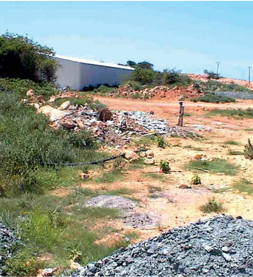
Figura 1. Restos de construcciones de apoyo, obras muertas y terrenos degradados adyacentes.

Fabre del Castillo, O. (2011). Áreas verdes, cayería Jardines del Rey. Conferencia del Curso MINTUR-CITMA Proyecto PNUD/GEF Sabana-Camagüey, Morón, mayo de 2011 (inédito).