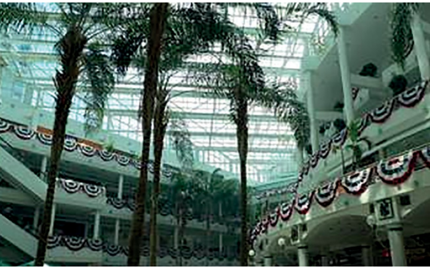
Figura 6. Centro comercial con plantas tropicales en Pentagon City Underway Station, Washington DC, Estados Unidos de América.