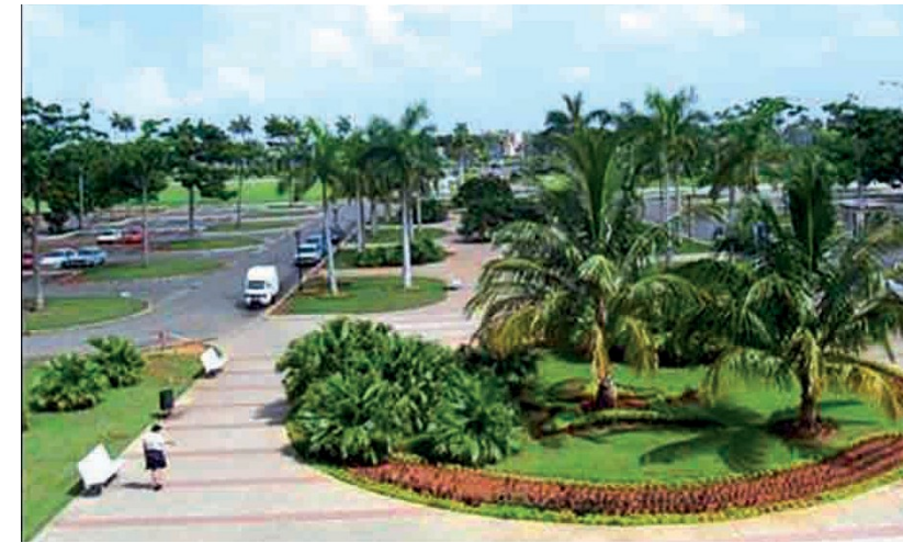
Figura 2. Jardines frente a la Terminal No. 3 del Aeropuerto Internacional "José Martí" en La Habana.

RAE (2012). Diccionario de la lengua española. 22ª edición, versión electrónica: http://www.rae.es/recursos/diccionarios/drae