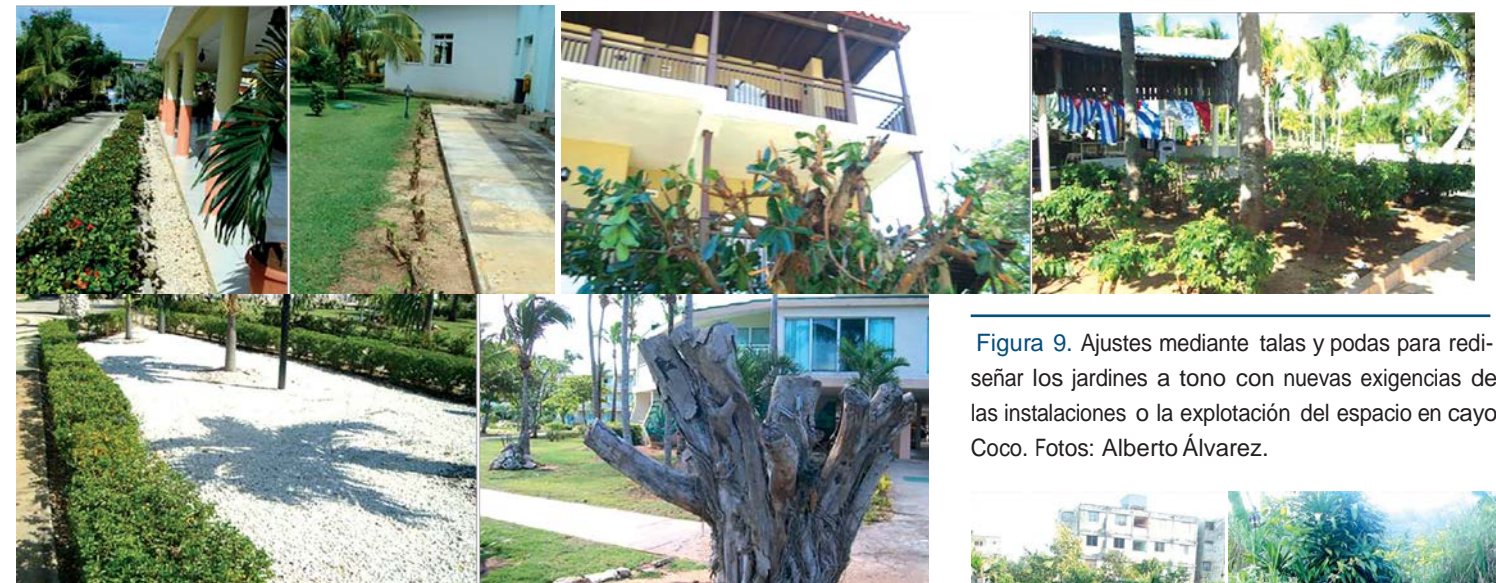
Figura 9. Ajustes mediante talas y podas para rediseñar los jardines a tono con nuevas exigencias de las instalaciones o la explotación del espacio en Cayo Coco.