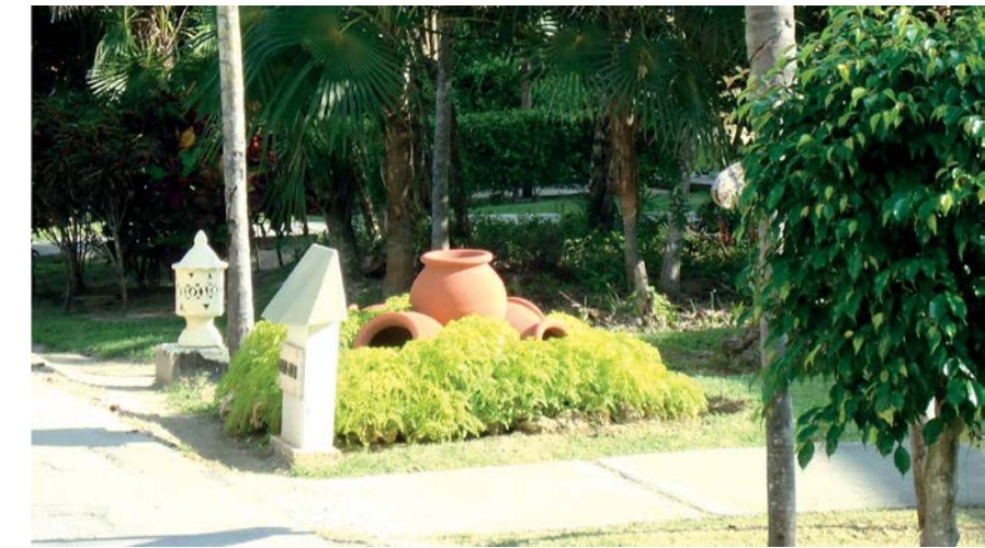
Figura 3. Jardín del patio interior del Hotel Meliá Cayo Coco.