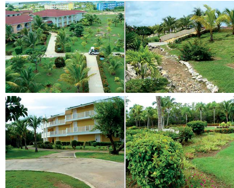
Figura 4. Vistas generales de los jardines de hoteles en cayo Coco y cayo Guillermo cuyos diseños resultan elementales, con escasa connotación escénica y ambiental.