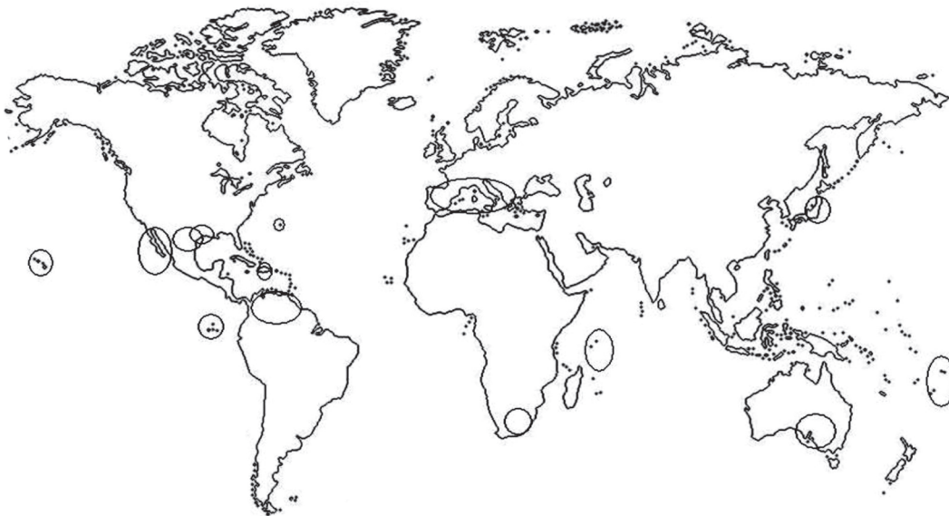
Figura 1. Territorios insulares y continentales colonizados por hormigas invasoras de acuerdo con las referencias en el texto.

Por su parte, S. invicta ha invadido áreas de las Antillas, África, Australia y Oceanía, incluida Hawaii [Davis et al. , 2001; Morrison et al. , 2004]. De manera particular Wetterer y Snelling (2006) la consideran la hormiga más perjudicial de Estados Unidos al provocar serios desequilibrios ecológicos, lo cual incluye la depredación de aves y reptiles [Holway et al. , 2002]. Por último, W. auropunctata ha provocado grandes perjuicios a la biota de las islas Galápagos, además de extenderse por otros grupos insulares del Pacífico y África Occidental [Loope y Krushelnycky, 2007].